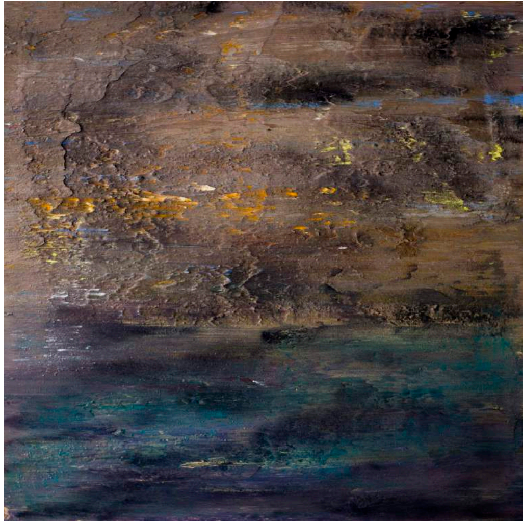
Imagined prussian landscapes of Haydn, 2017 100 x 100 x 13 cm. Técnica mixta.