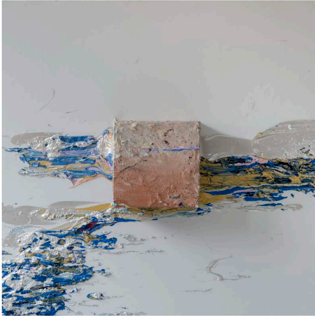
Vibraciones lunínicas, 2017 100 x 100 x 17 cm. Técnica mixta.