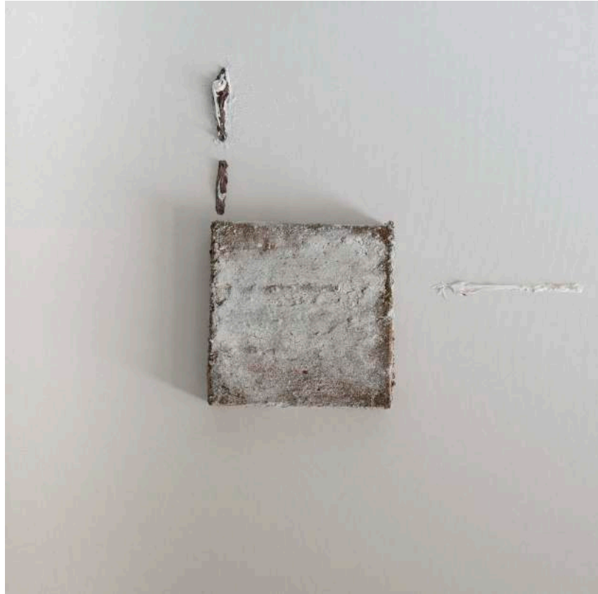
La terre et la lumière, 2013 70 x 70 x 8 cm. Técnica mixta.