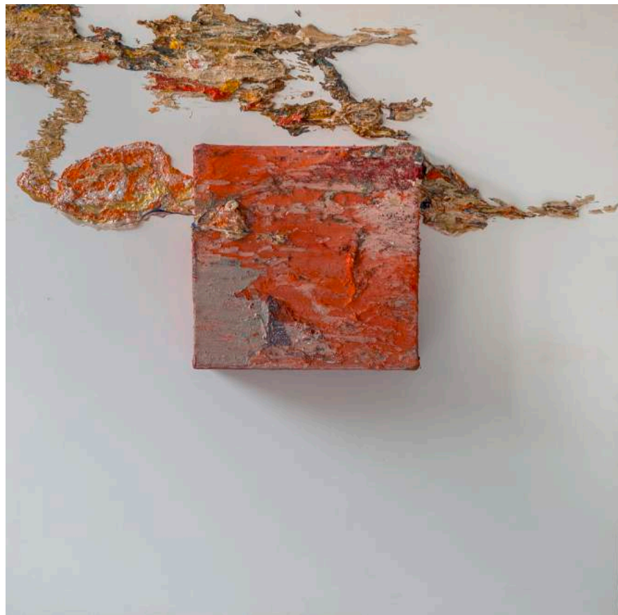
Alchime tellurique en trois dimensions, 2014 100 x 100 x 17 cm. Técnica mixta.