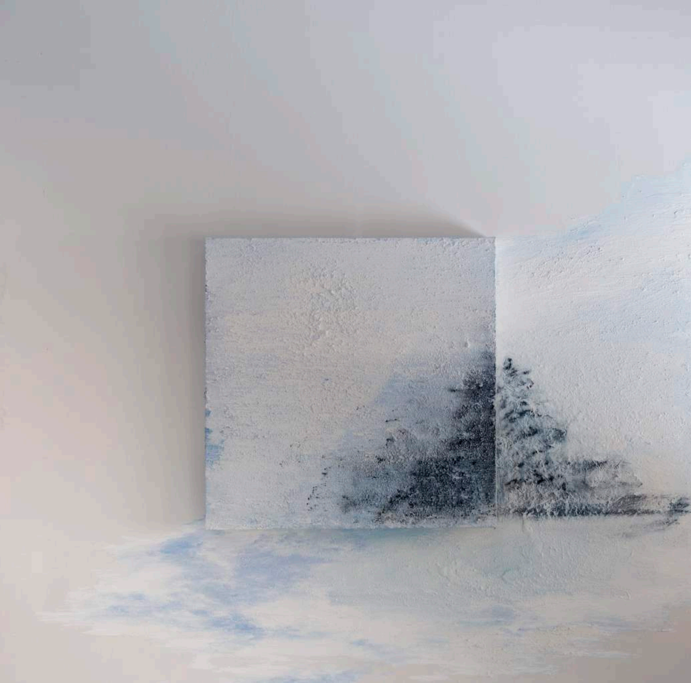
Haydn chromatic sonorities, 2017 200 x 200 x 19 cm. Técnica mixta.