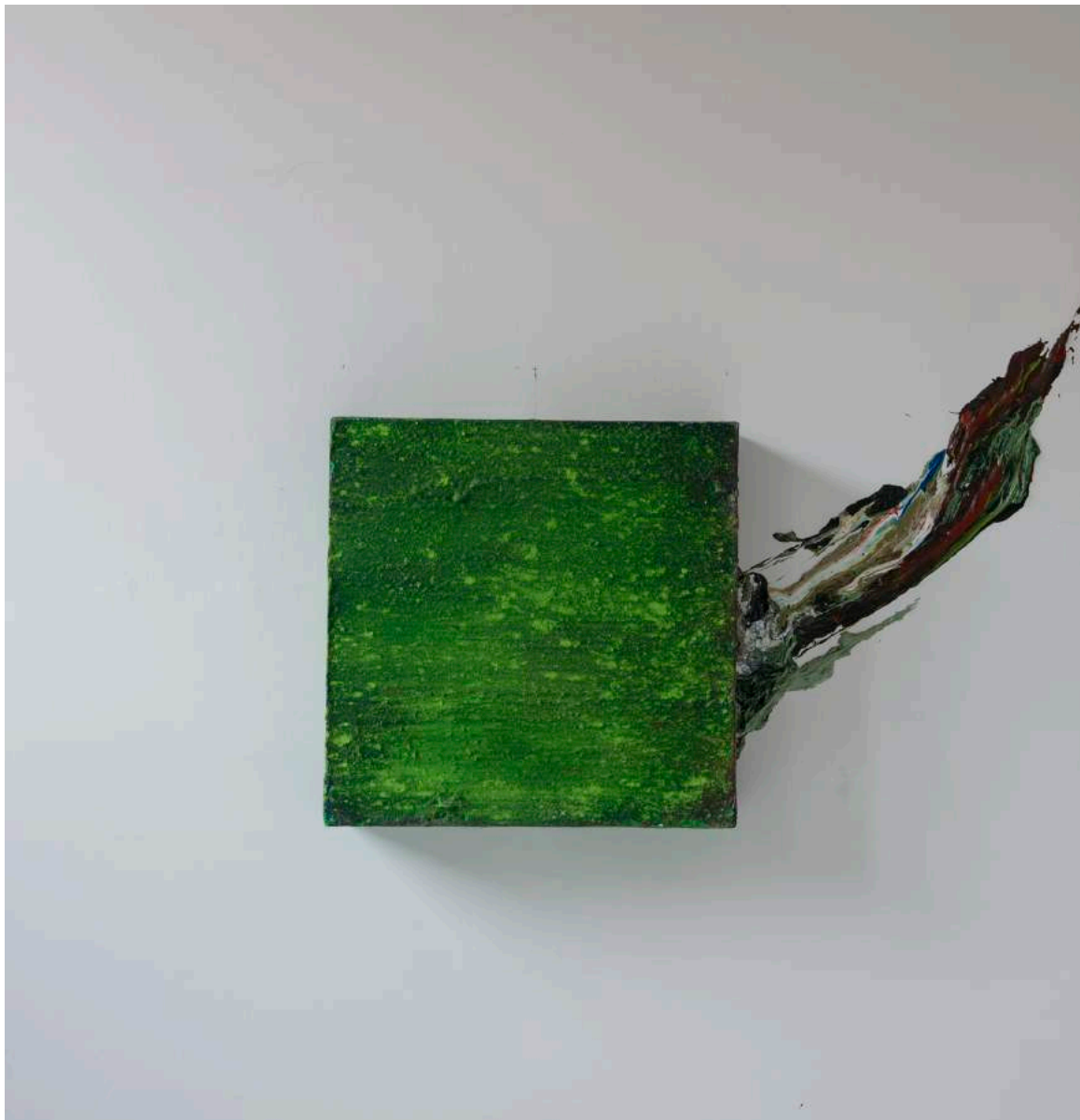
Expanded perennial grass painted, 2017 150 x 150 x 20 cm. Técnica mixta.