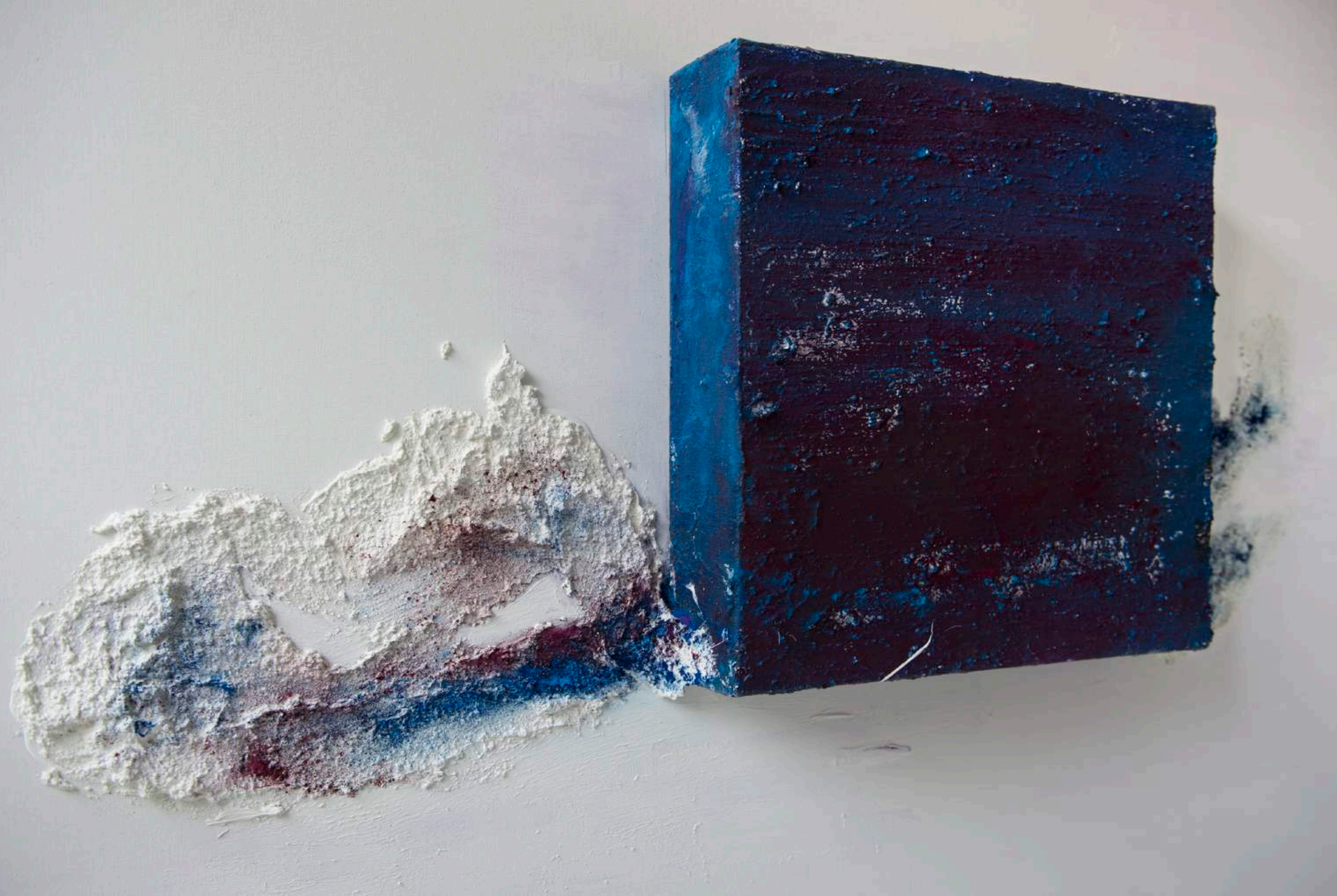
Fulguraciones cósmicas, 2015 (Detalle). 150 x 150 x 21 cm. Técnica mixta.