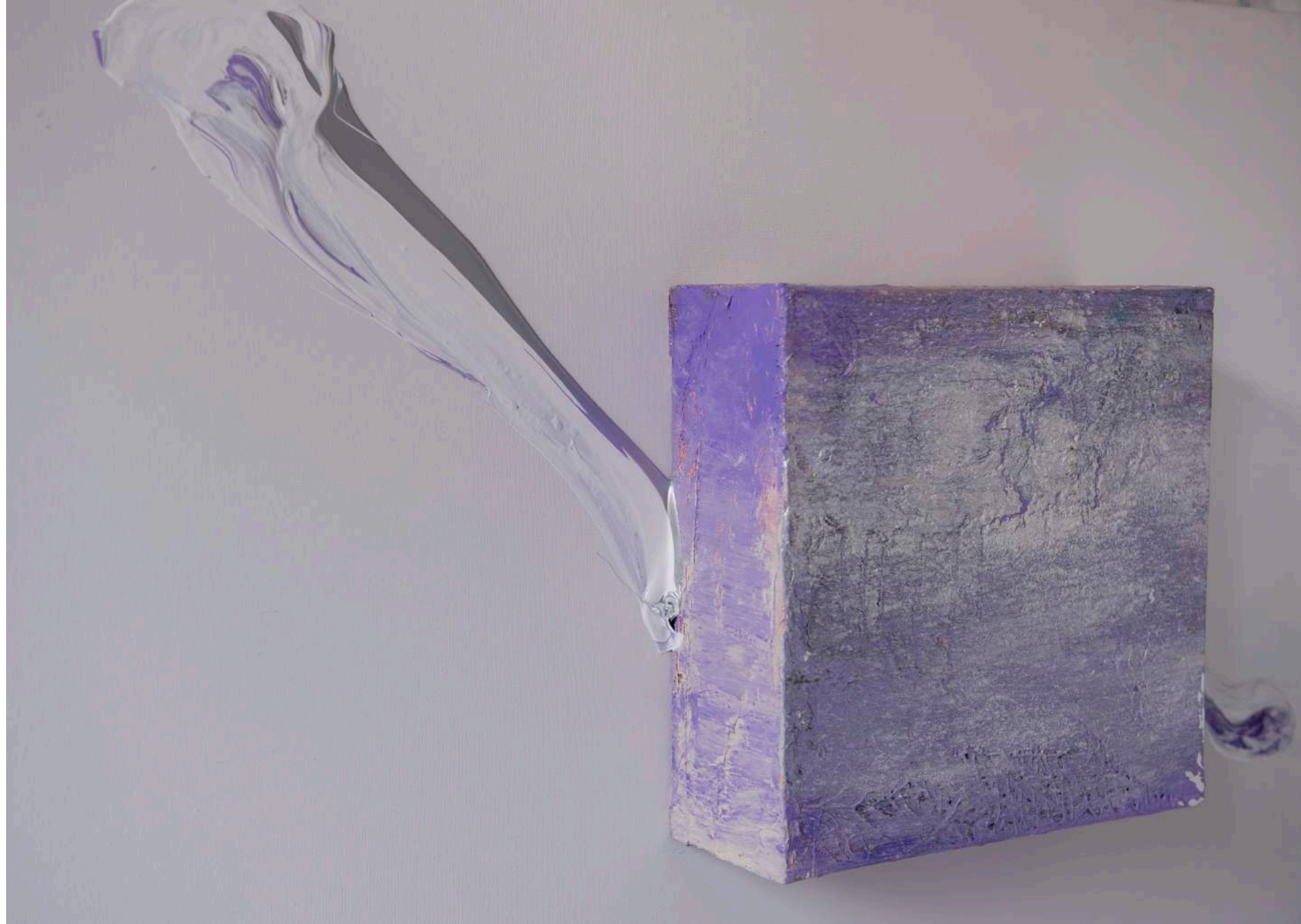
Aleaciones cósmicas, 2017 (Detalle). 100 x 100 x 17 cm. Técnica mixta.