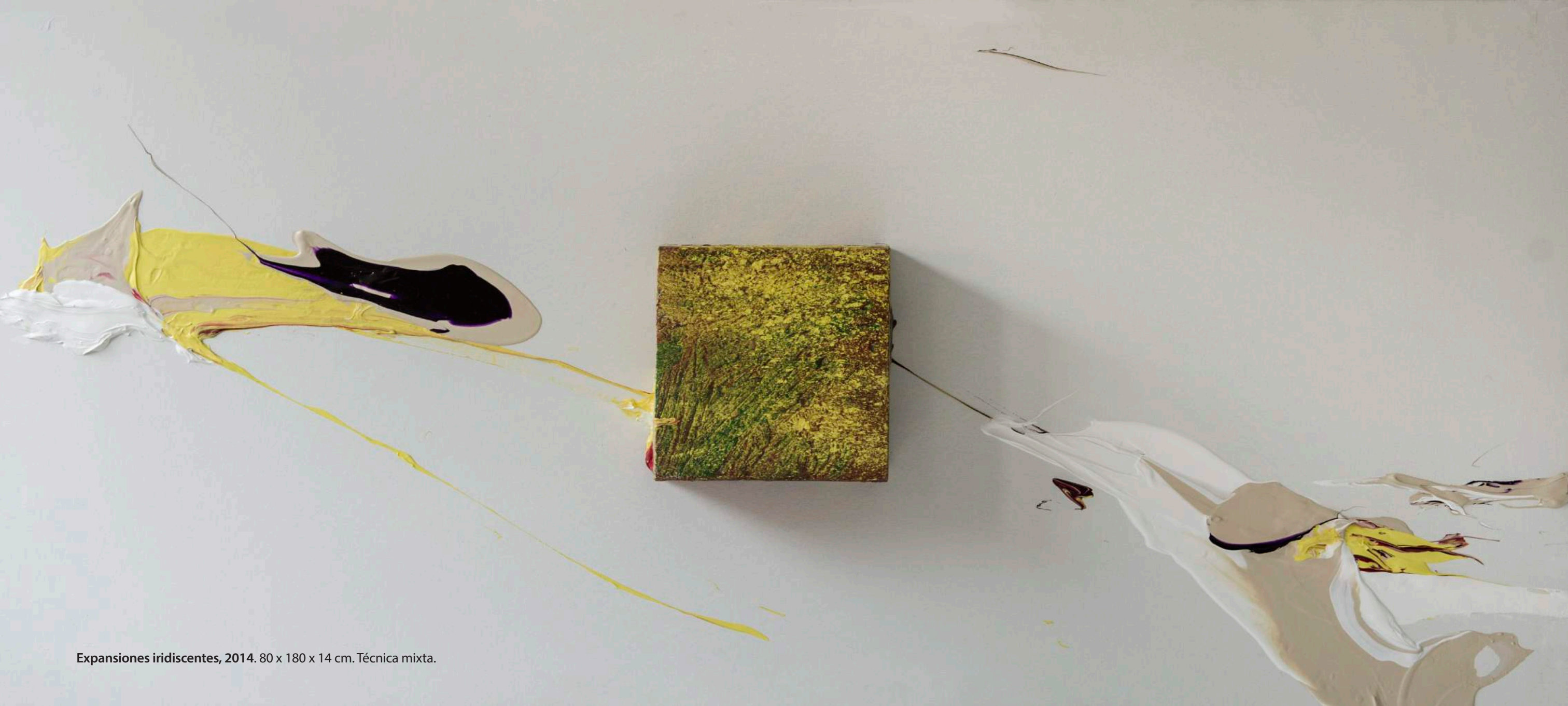
Expansiones iridiscentes, 2014. 80 x 180 x 14 cm. Técnica mixta.