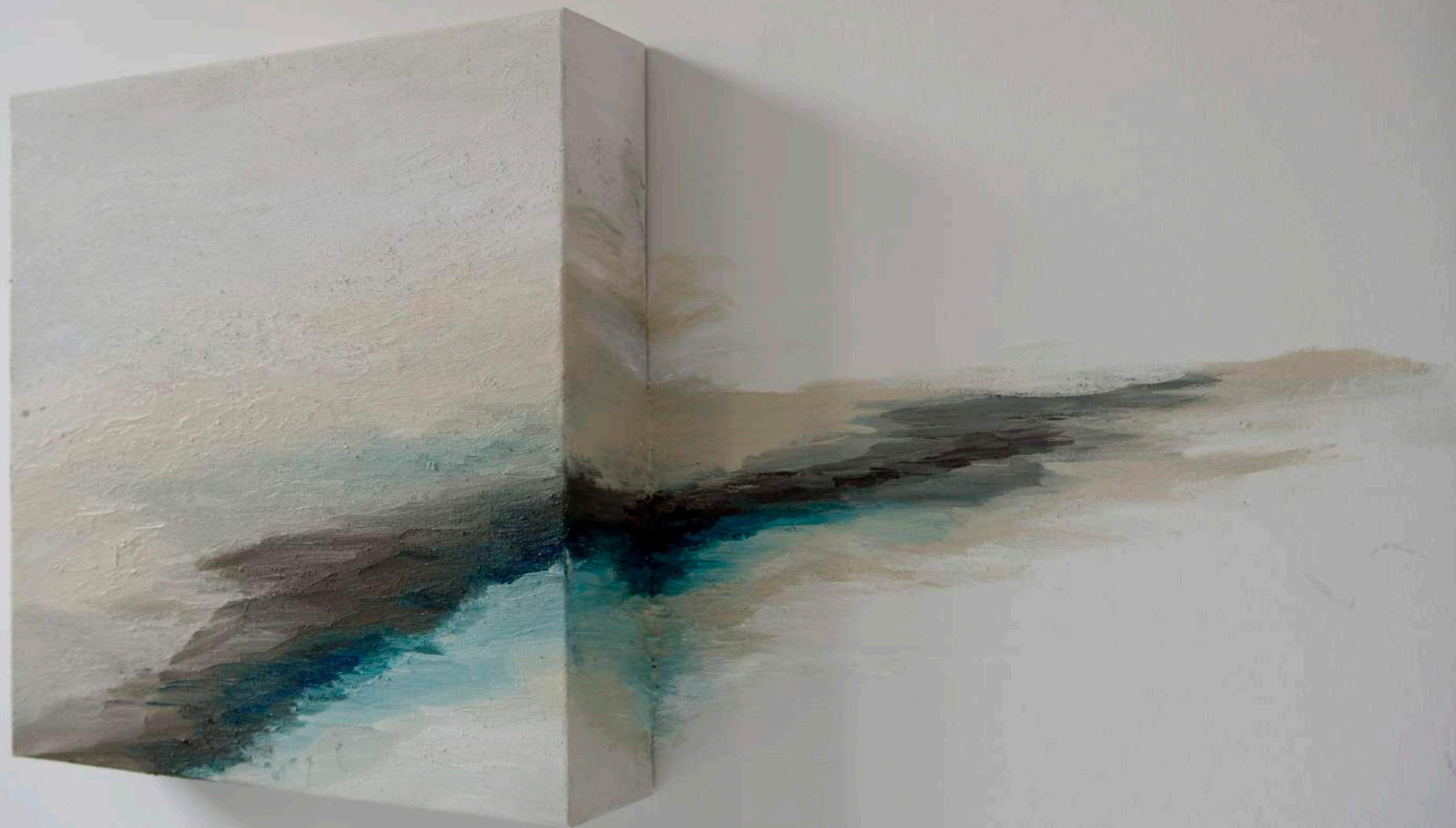
Paysages en fuite, 2017 (Detalle). 150 x 150 x 18 cm. Técnica mixta.