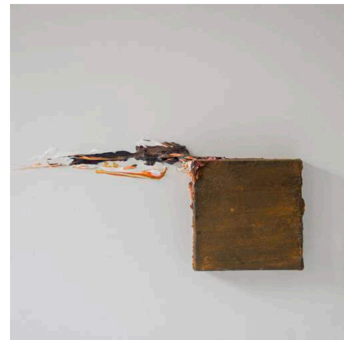
Estelas telúricas, 2013 50 x 50 x 13 cm. Técnica mixta.