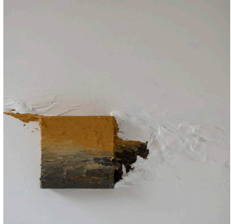
Landscape sailing across white ocean, 2013 50 x 50 x 8 cm. Técnica mixta.