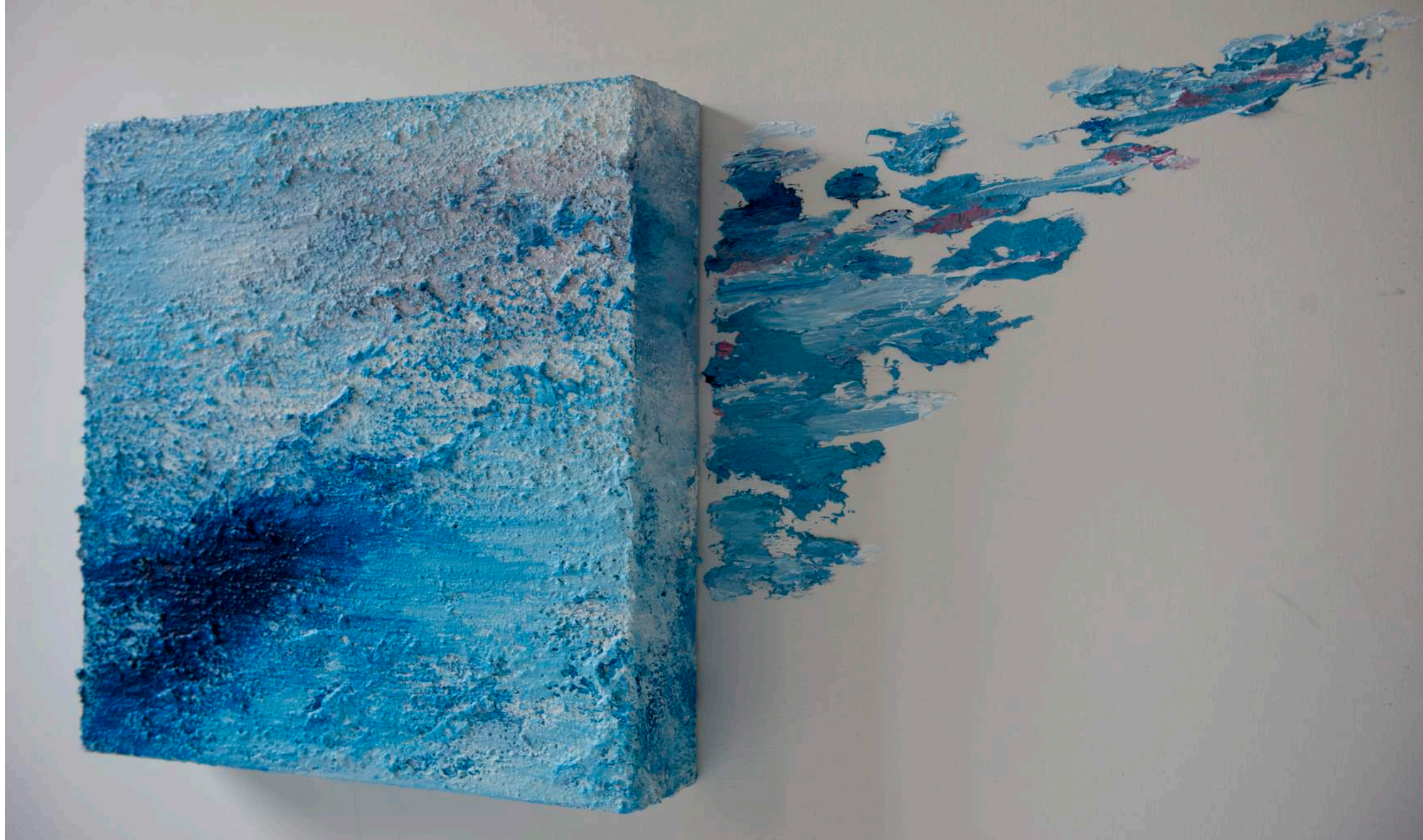
Escapadas celestes, 2017 (Detalle).150 x 150 x 17 cm. Técnica mixta