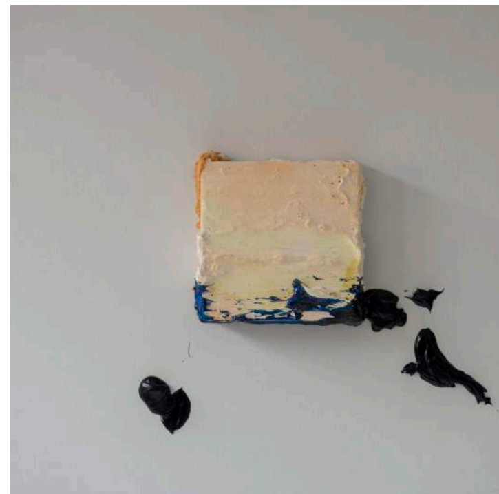
Landslides, 2013 50 x 50 x 13 cm. Técnica mixta.