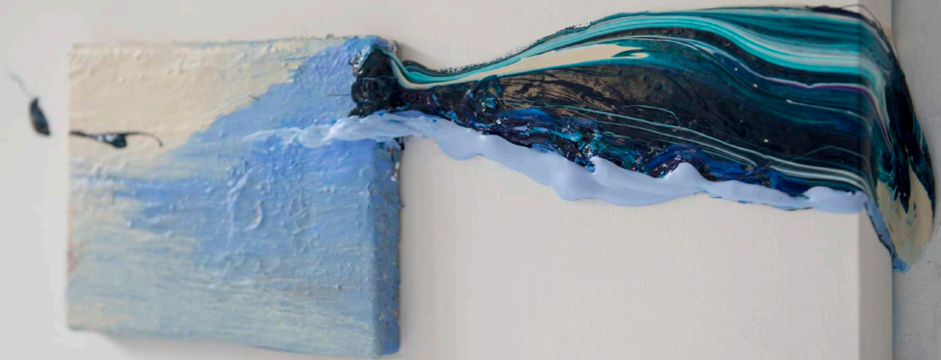
Rivers of painting in relief, 2014 (Detalle) 70 x 50 x 6 cm. Técnica mixta.