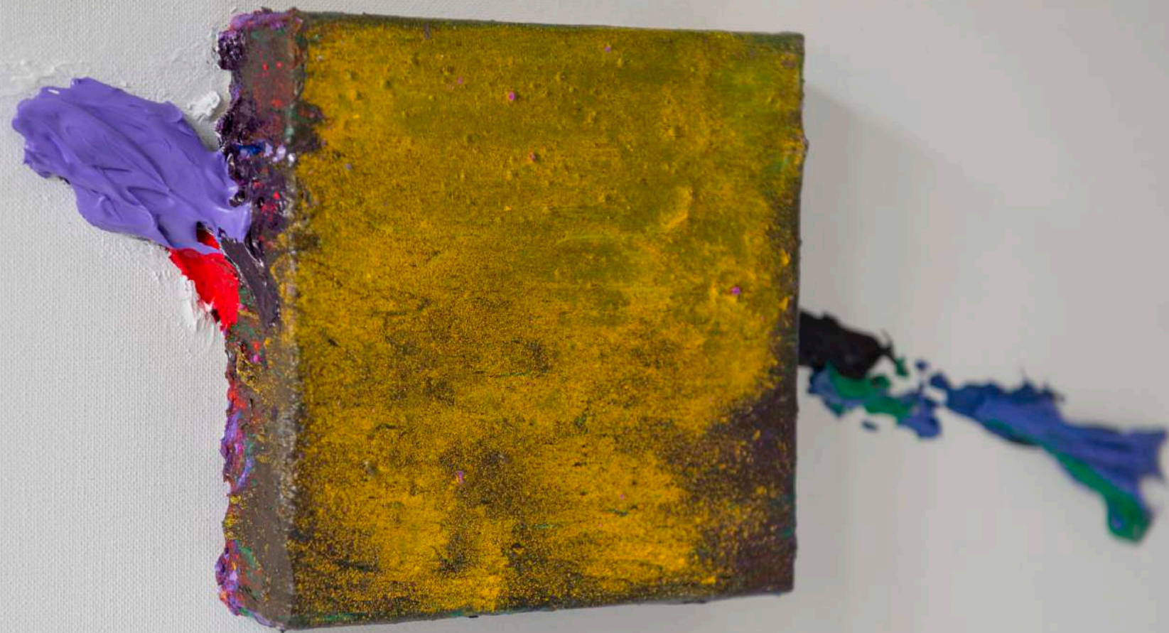
Couleurs éparses, 2013 (Detalle) 50 x 50 x 8 cm. Técnica mixta.