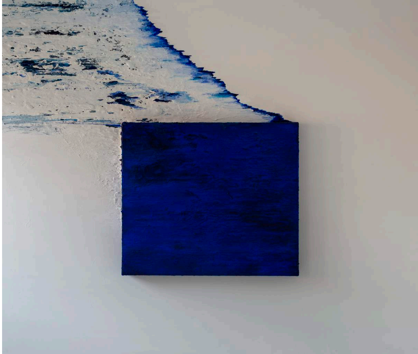
The journey of pigments, 2017 200 x 200 x 19 cm. Técnica mixta.