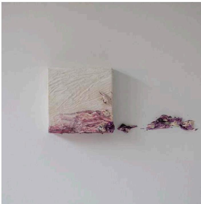
Saveurs visuelles, 2013 50 x 50 x 8 cm. Técnica mixta.