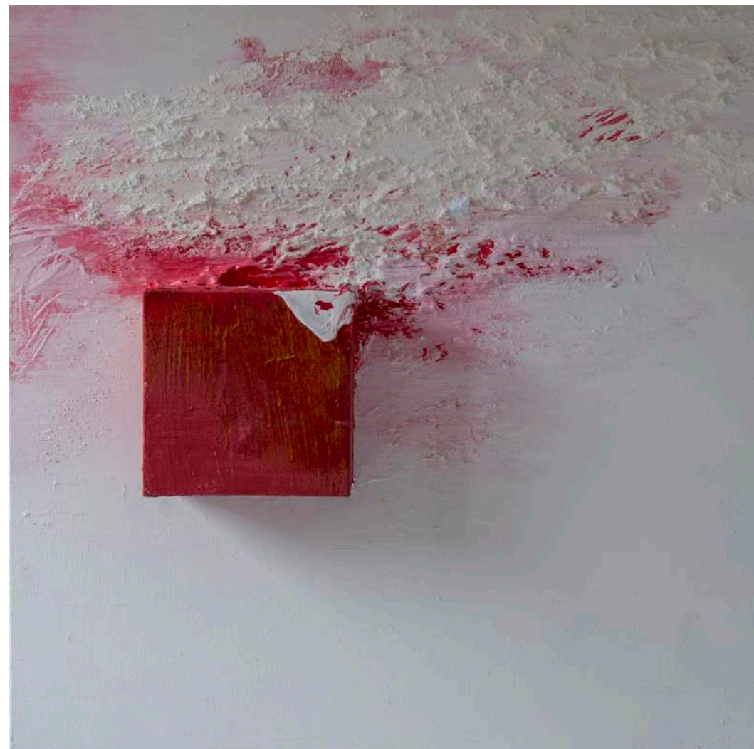
Listening "Sturm Und Drag" of Haydn, 2014 100 x 100 x 17 cm. Técnica mixta.