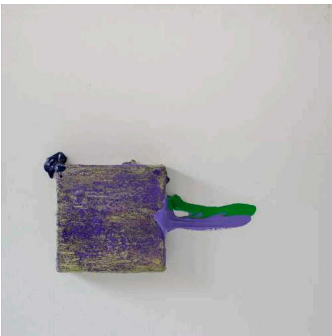
Emerging material colour, 2013 50 x 50 x 8 cm. Técnica mixta.