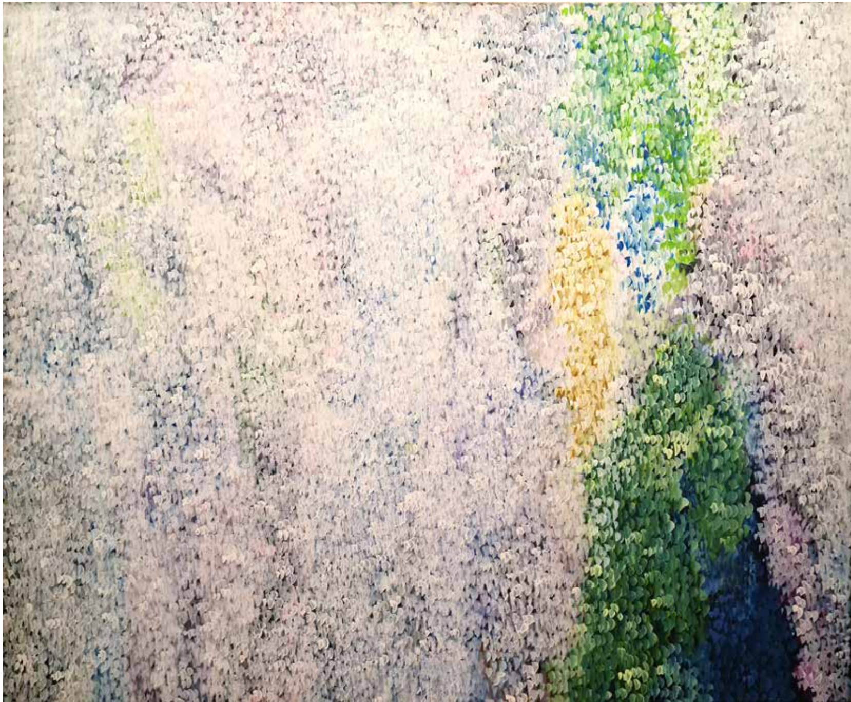
Soledad Sevilla, 2012. Lady blanca I . Óleo sobre lienzo. 86 x 105 cm