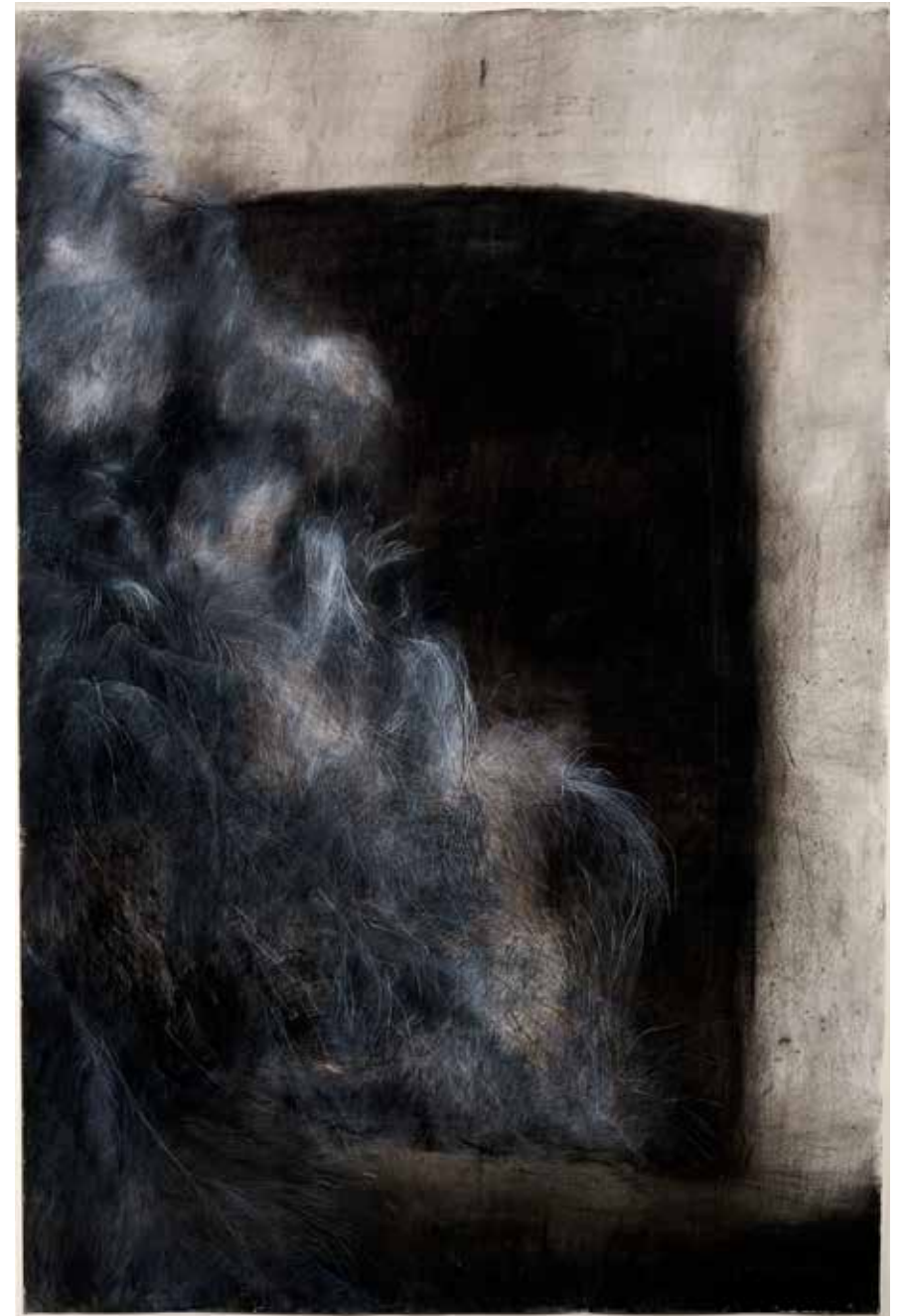
Soledad Sevilla, 2003 Maleza Carboncillo sobre papel 192 x 127 cm