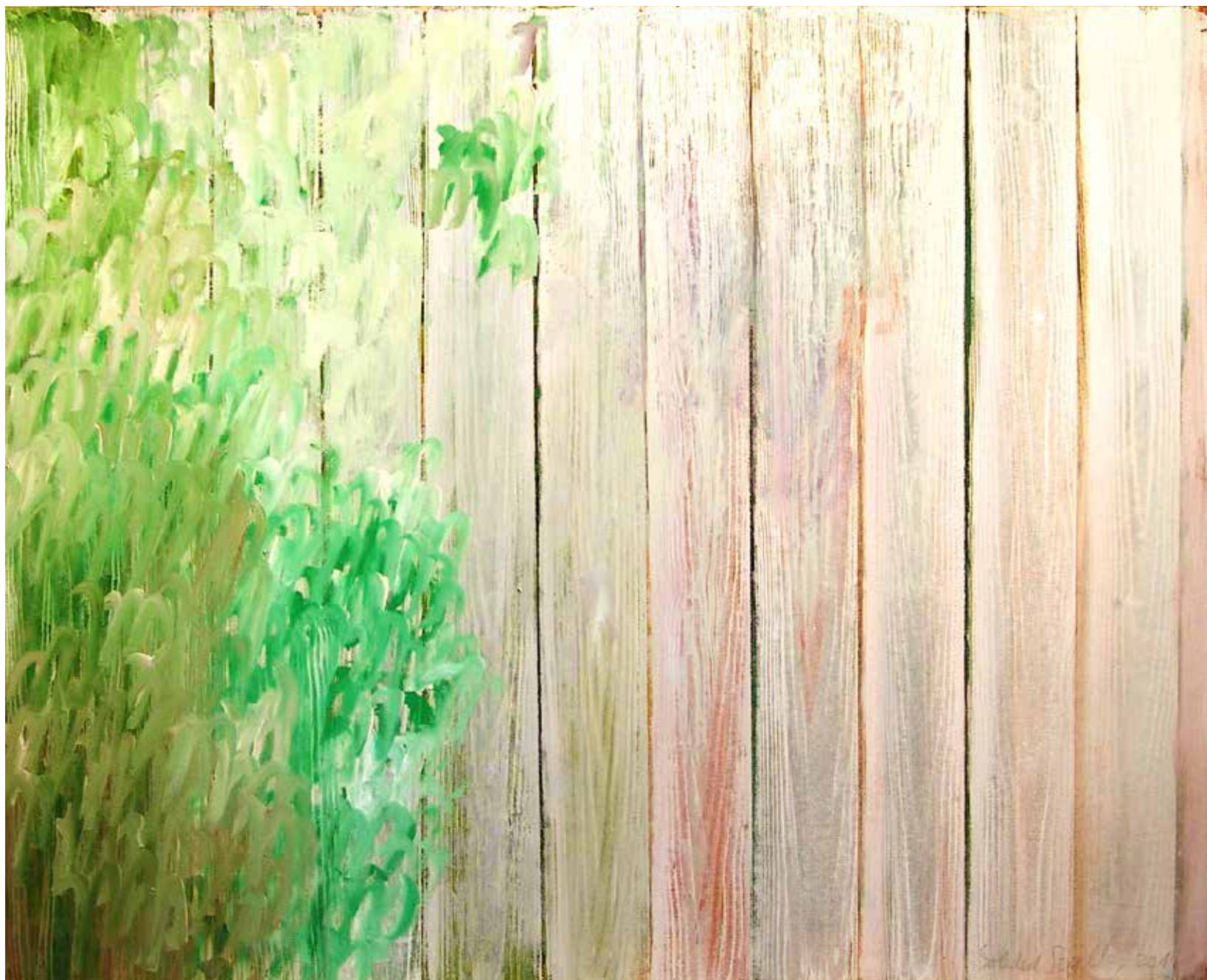
Soledad Sevilla, 2012. Serie Belicena . Acrílico sobre papel. 114 x 138 cm