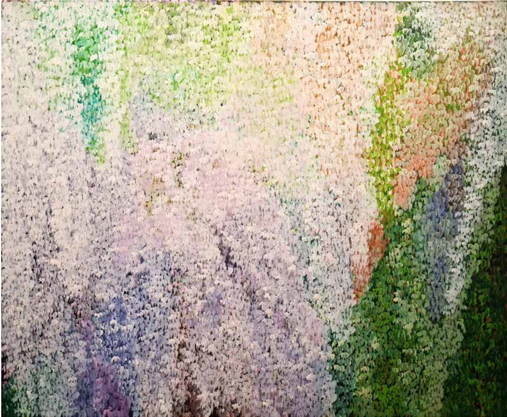
Soledad Sevilla, 2012. Lady blanca II . Óleo sobre lienzo. 86 x 105 cm