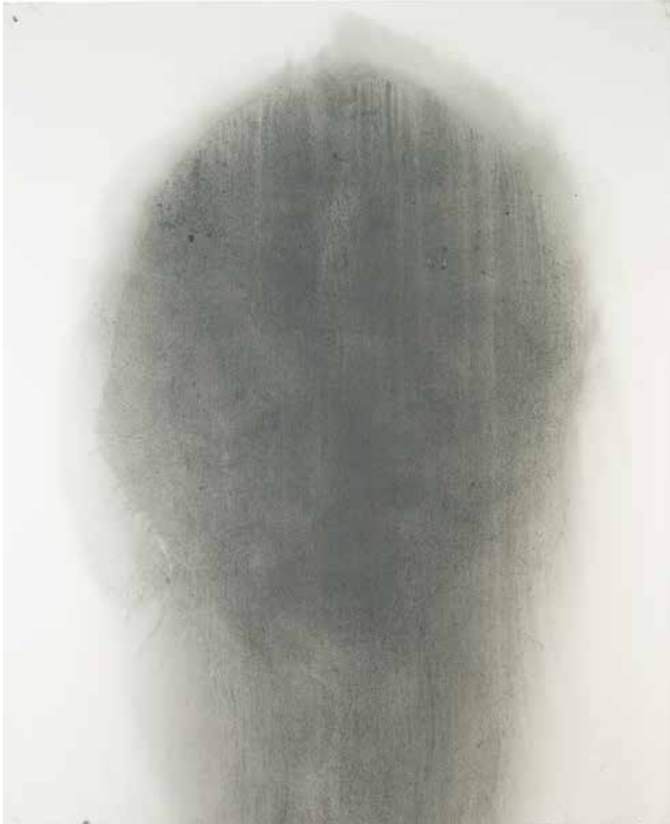
Nuria Vidal, 2021 Serie Rendición (Díptico). Pintura acrílica y grafito sobre papel. 140 x 114 cm c/u