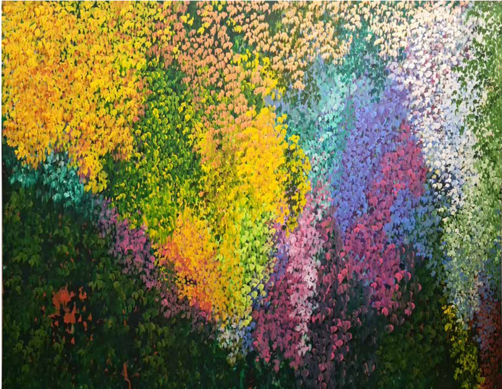
Soledad Sevilla, 2006. Días antes . Óleo sobre lienzo. 86 x 110 cm