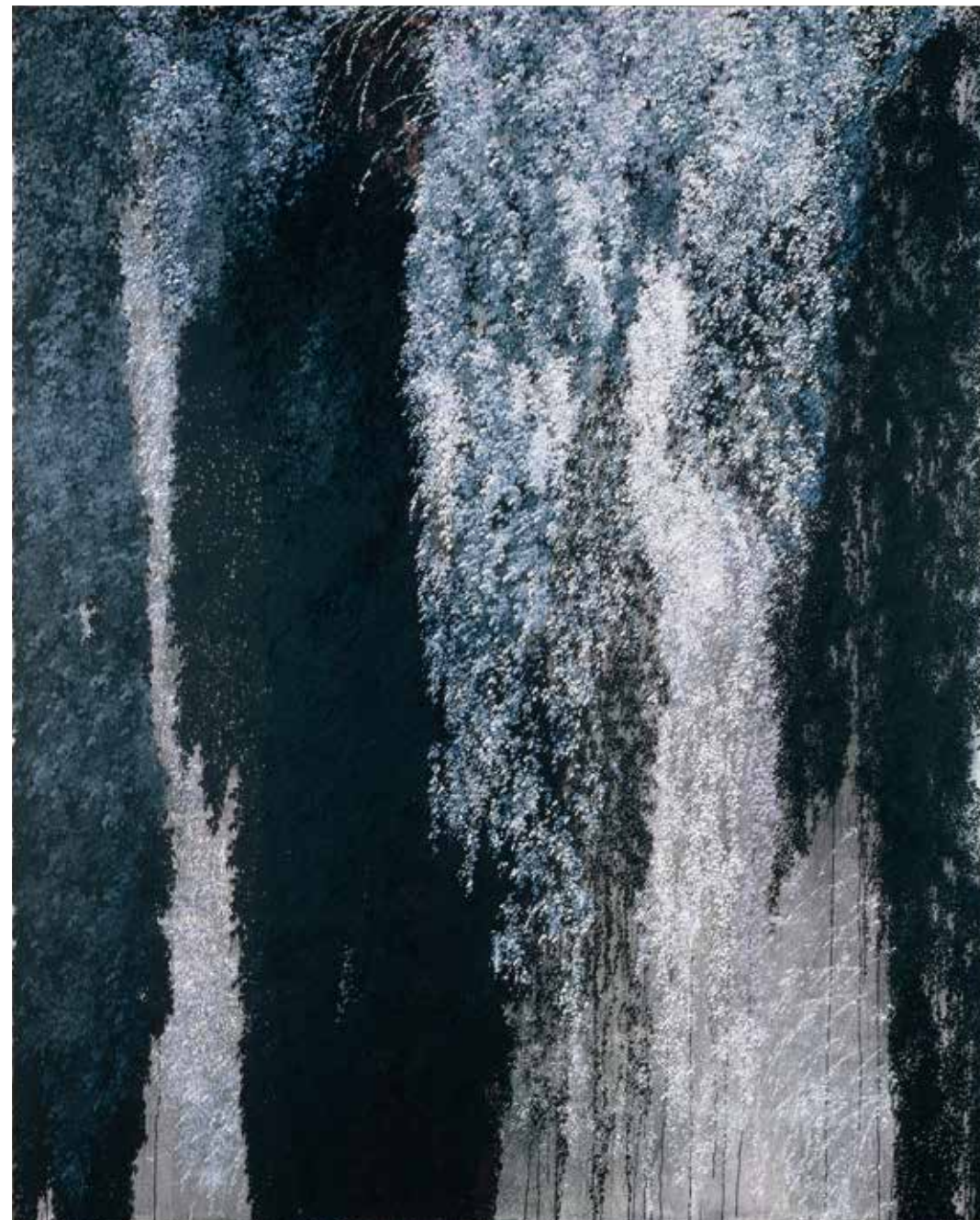
Soledad Sevilla, 2005 Sueño sin sonido Óleo sobre lienzo 250 x 200 cm