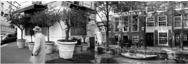
“COUPE DE CHAPEAU, 2009”