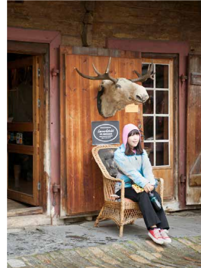
"Bergen", 2011. 50 x 40 cm.