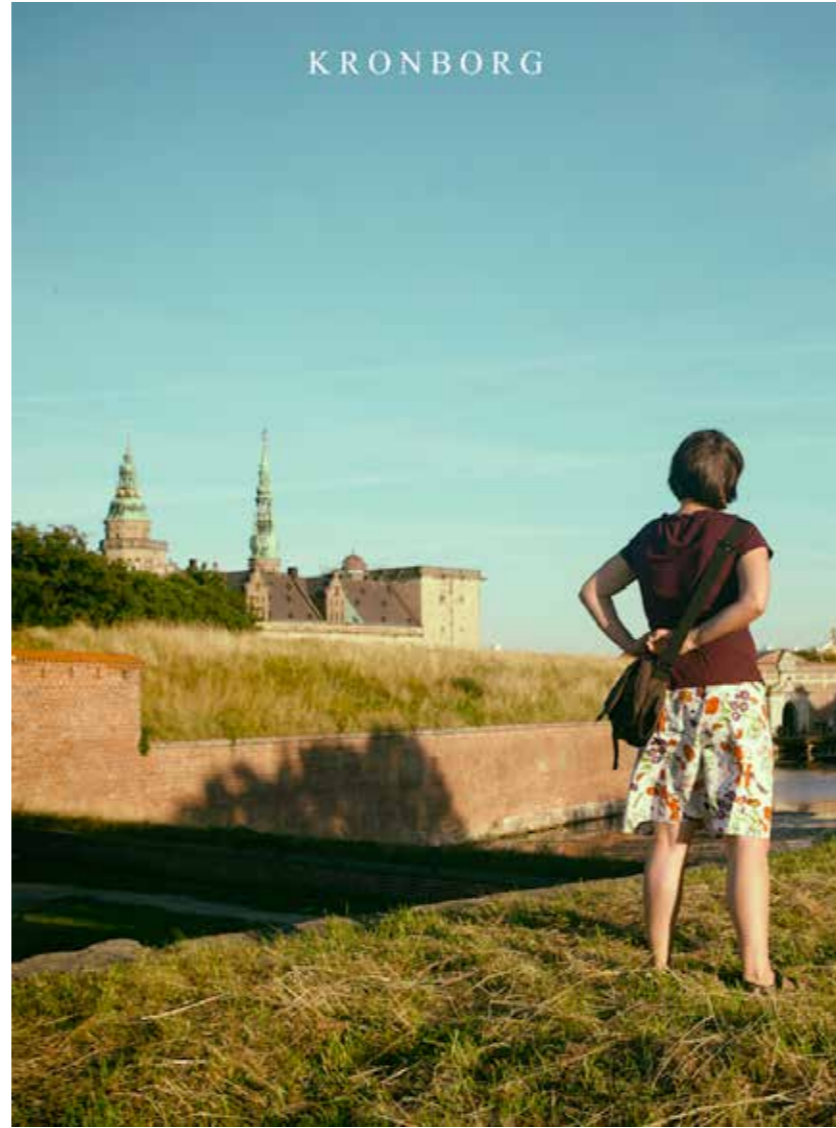
"Elsingor", 2016. 50 x 40 cm.