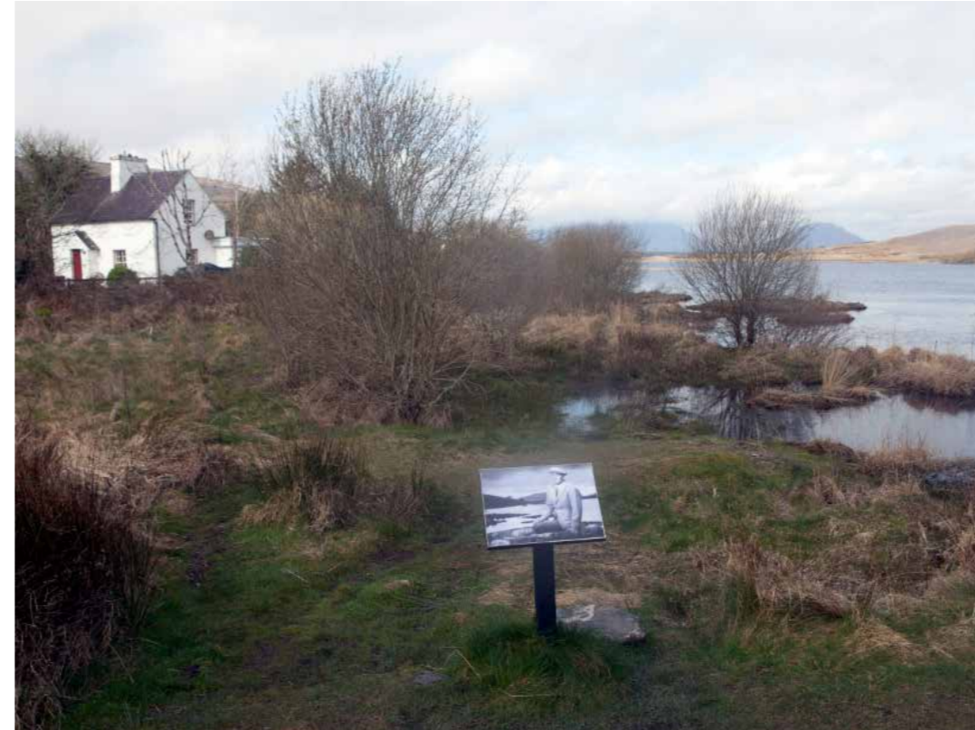
"Entre los lagos Bofin y Agraftard", 2015. 60 x 80 cm.