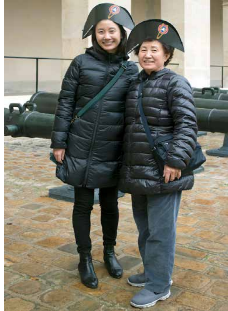
"Paris", 2016. 50 x 40 cm.