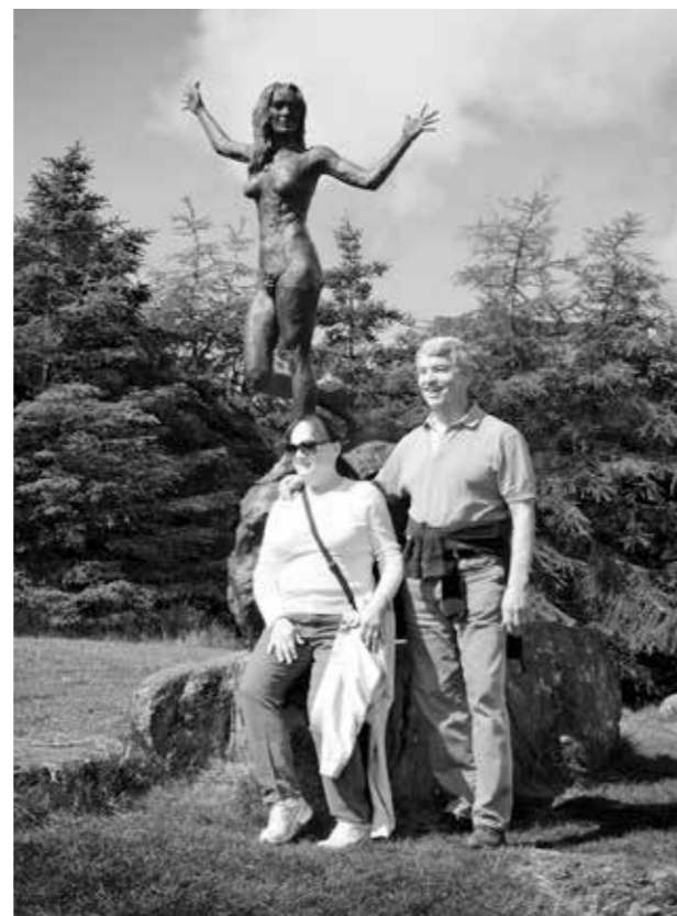
"Tórshavn", 2013. 50 x 40 cm.