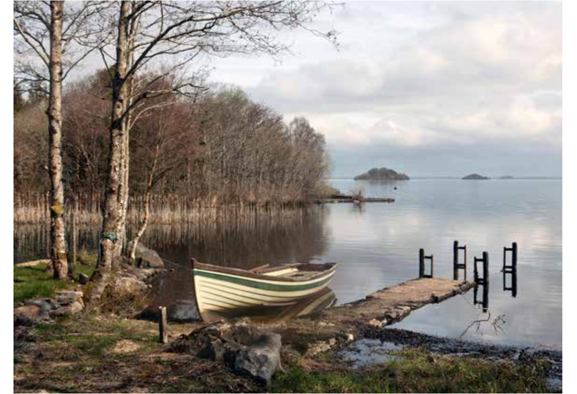
"Lago Corrib", 2015. 60 x 80 cm.