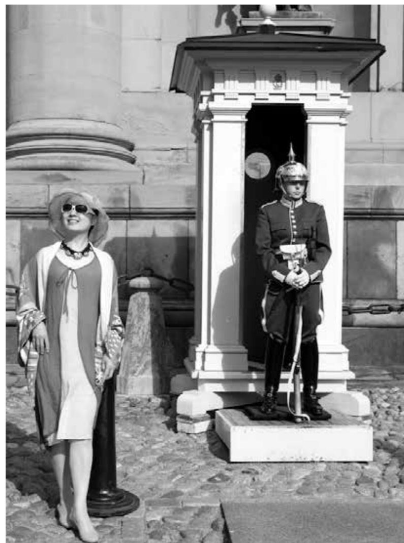
"Estocolmo", 2015. 50 x 40 cm.