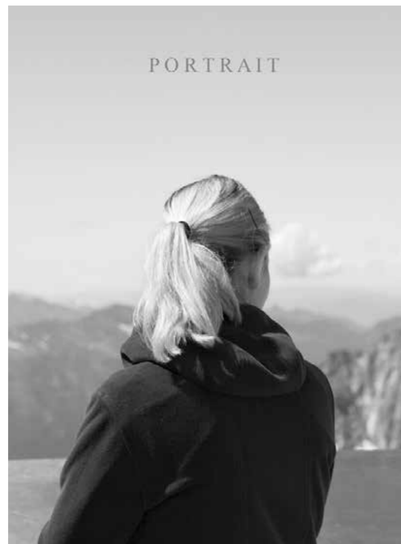
"Retrato", 2014. 50 x 40 cm.