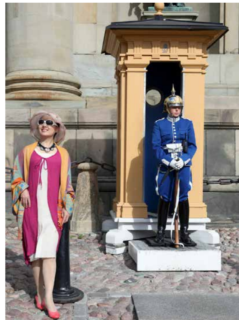
"Estocolmo", 2015. 50 x 40 cm.