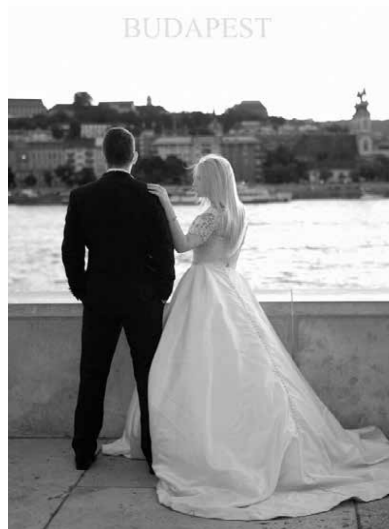
"Atardecer en Budapest", 2016. 50 x 40 cm.