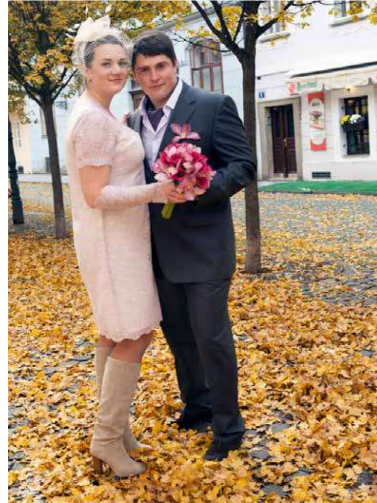
"Praga", 2013. 50 x 40 cm.