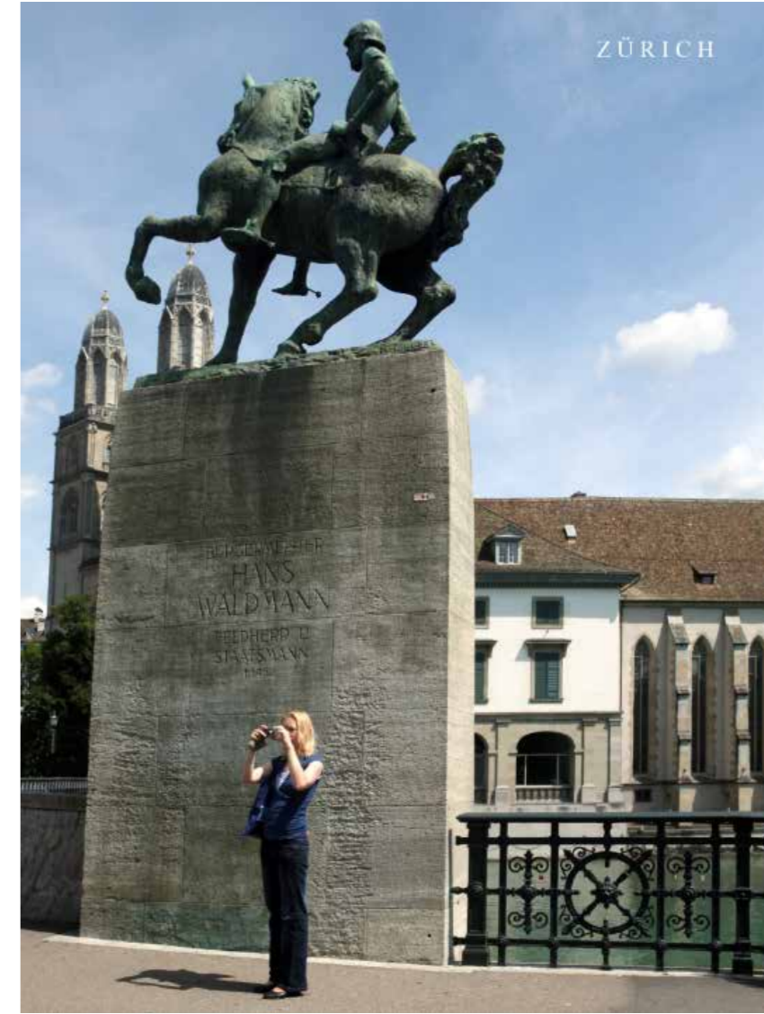
"Zurich", 2016. 50 x 40 cm.