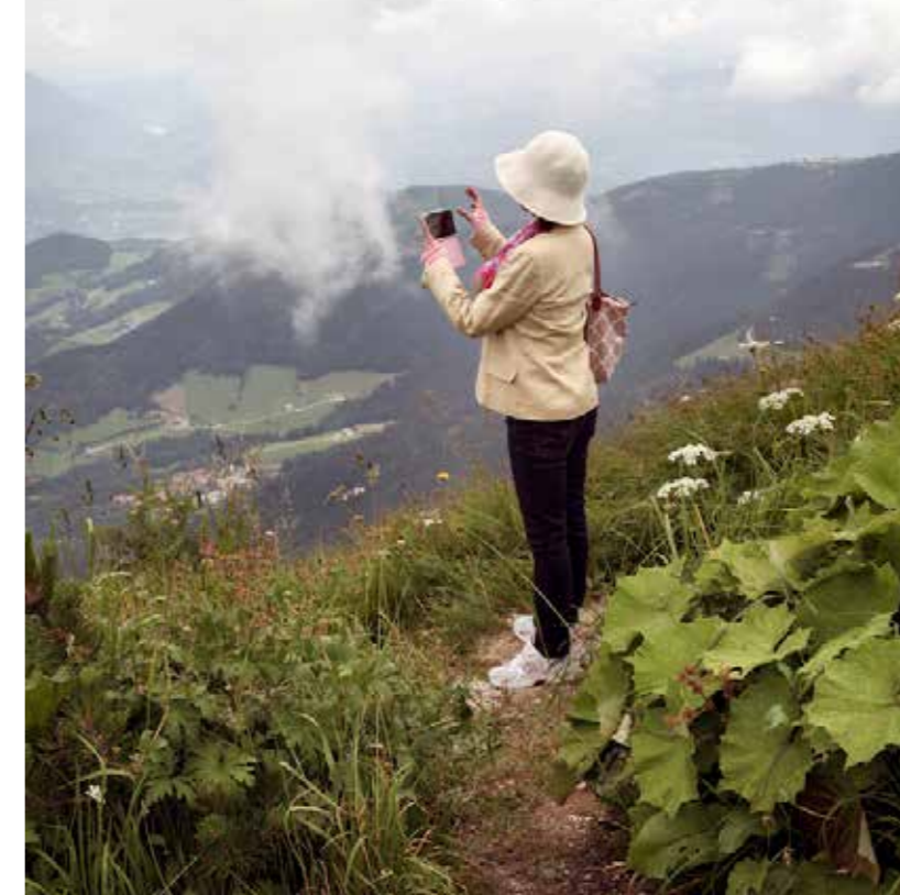
"Paisaje austriaco", 2016. 50 x 40 cm.

Beautiful landscape photos are often defined by the quality of light they were taken in. As a consequence, photographers tend to shoot early in the morning or during late afternoons when the sun is lower, less contrasty and often displays a subtle colour palette of moody hues. For this reason, the hours after dawn and before dusk are known as the 'magic hours'. If rising at dawn doesn't sit well with your idea of a relaxing weekend, don't panic - there are plenty of great landscape opportunities throughout the day.