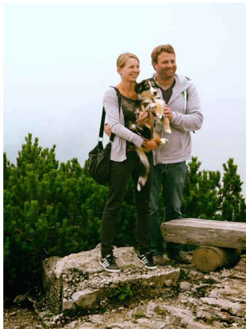
"Berchtesganden", 2015. 50 x 40 cm.