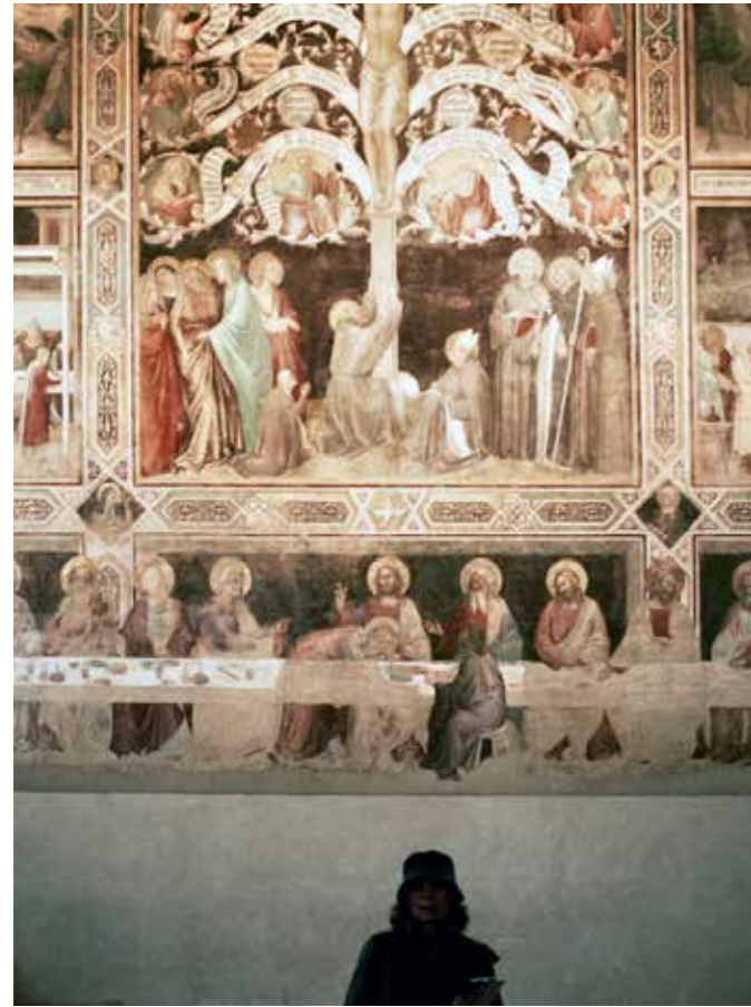
"Florenzia", 2016. 38 x 28 cm.