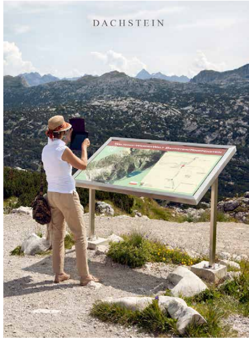
"Dachstein", 2016. 50 x 40 cm.