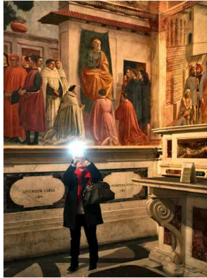
"Capilla Brancacci", 2016. 38 x 28 cm.