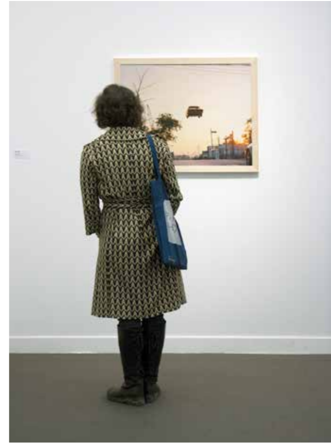
"París", 2016. 38 x 28 cm.