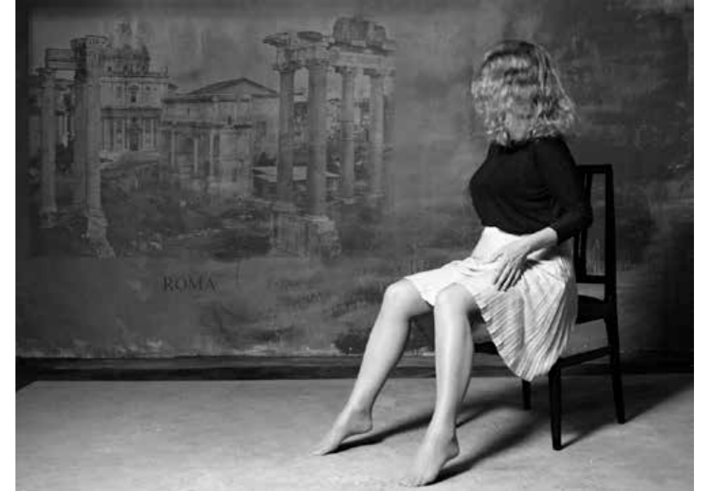
"Vista de Roma", 2016. 60 x 80 cm.