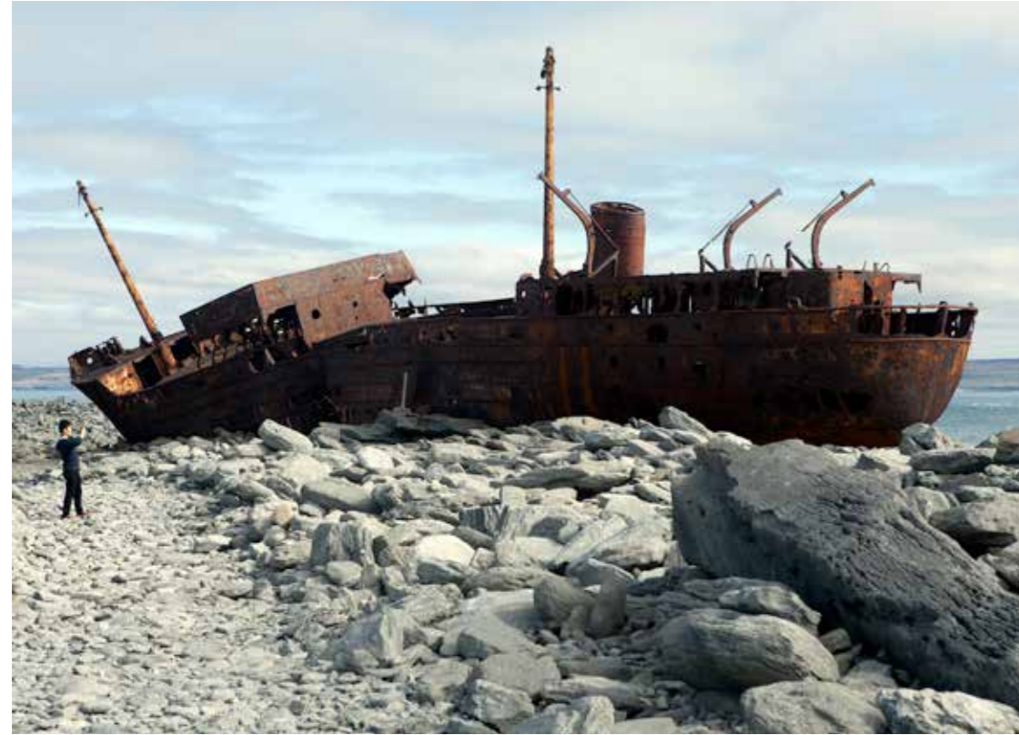
"Inisheer", 2015. 60 x 80 cm.