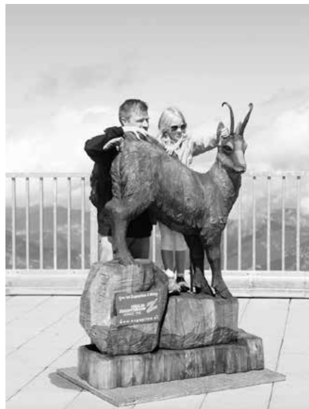
"Zugspitze", 2013. 50 x 40 cm.