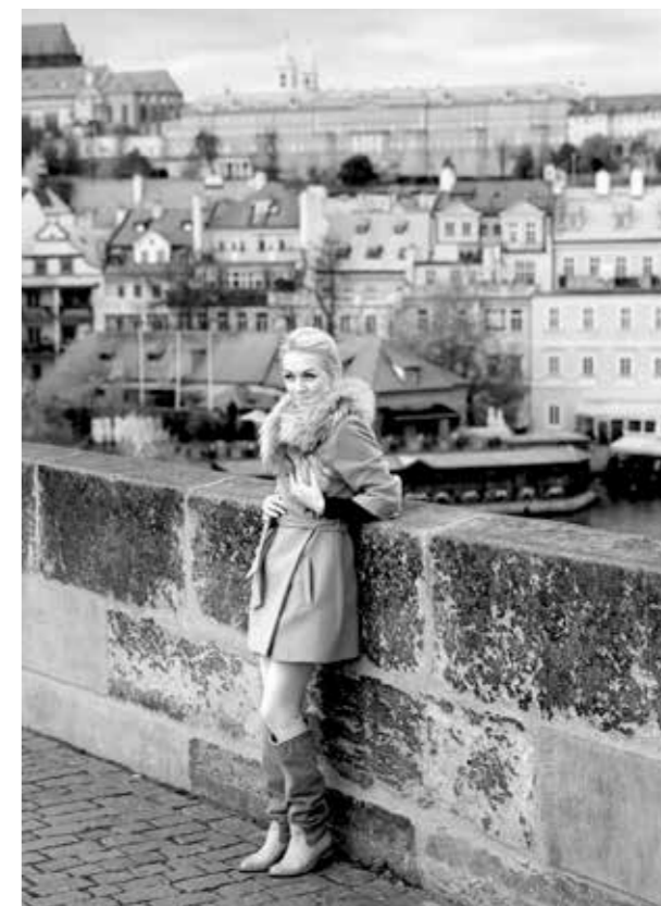
"Praga", 2013. 50 x 40 cm.