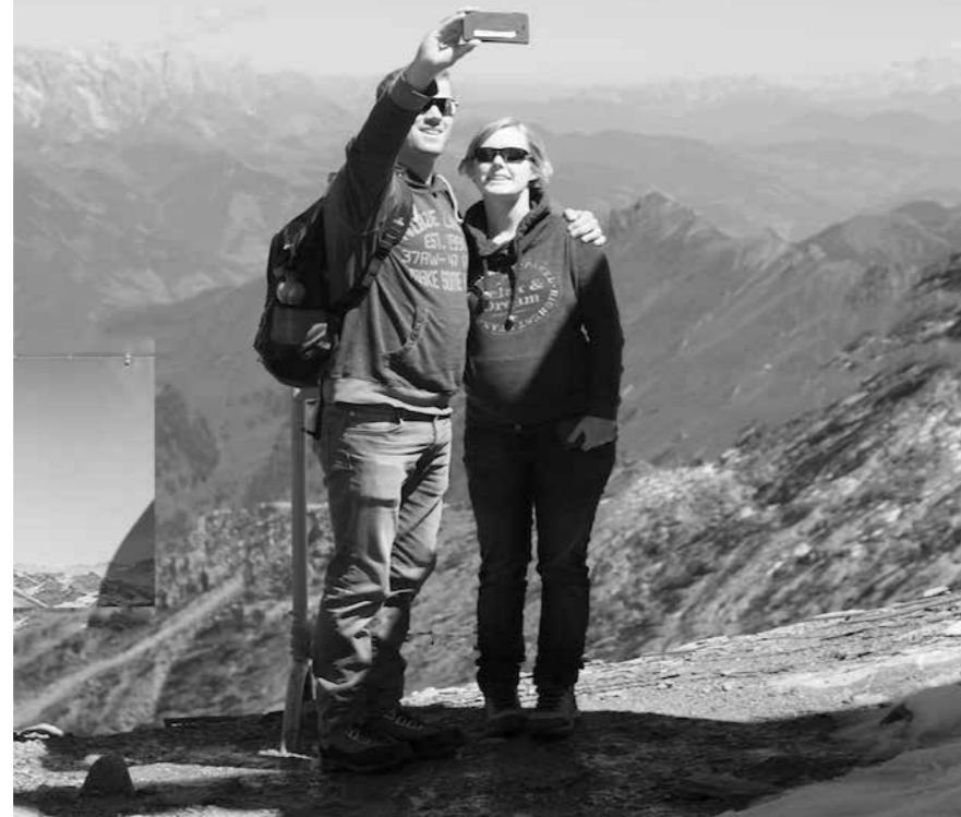
"Selfie en los Alpes", 2016. 80 x 60 cm.

A selfie is a self-portrait photograph, typically taken with a digital camera or camera phone held in the hand or supported by a selfie stick. Selfies are often shared on social networking services such as Facebook, Instagram and Twitter. They are usually flattering and made to appear casual. Most selfies are taken with a camera held at arm's length or pointed at a mirror, rather than by using a self-timer. A selfie stick can be used to position the camera farther away from the subject, allowing the camera to see more around them.