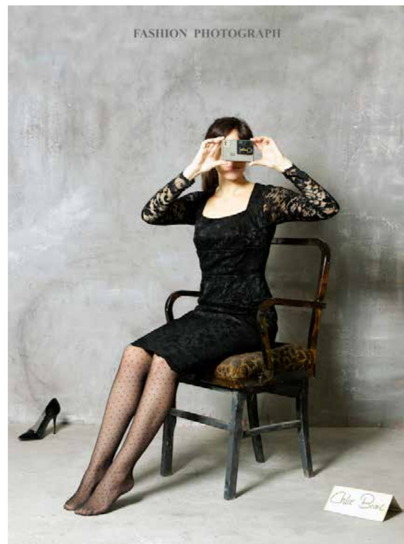
"Chloe Borel", 2013. 50 x 40 cm.