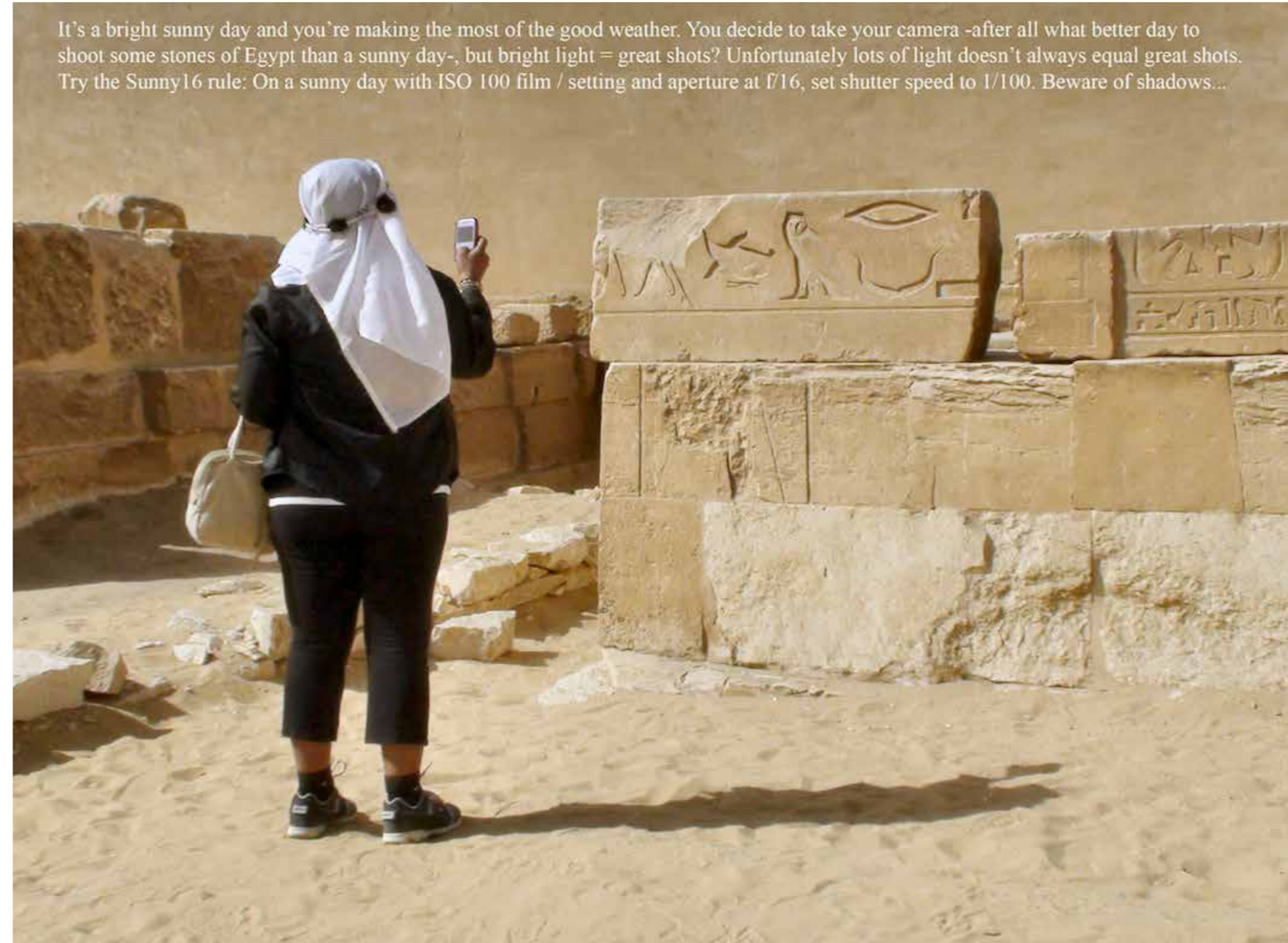
"Saqqara", 2010. 40 x 50 cm.