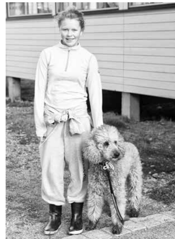
"Niña con su perro en Loneyarbyen", 2011. 50 x 40 cm.