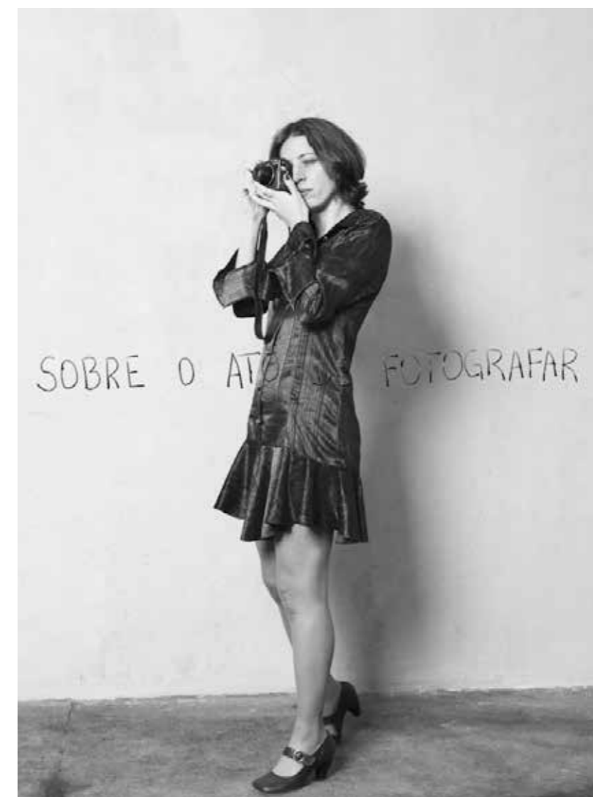
"Sobre o ato de fotografar", 2009. 50 x 40 cm.