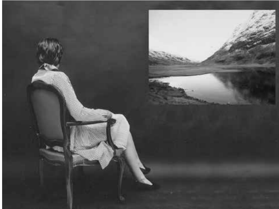
"Vista del lago de Como", 1983. 60 x 80 cm.