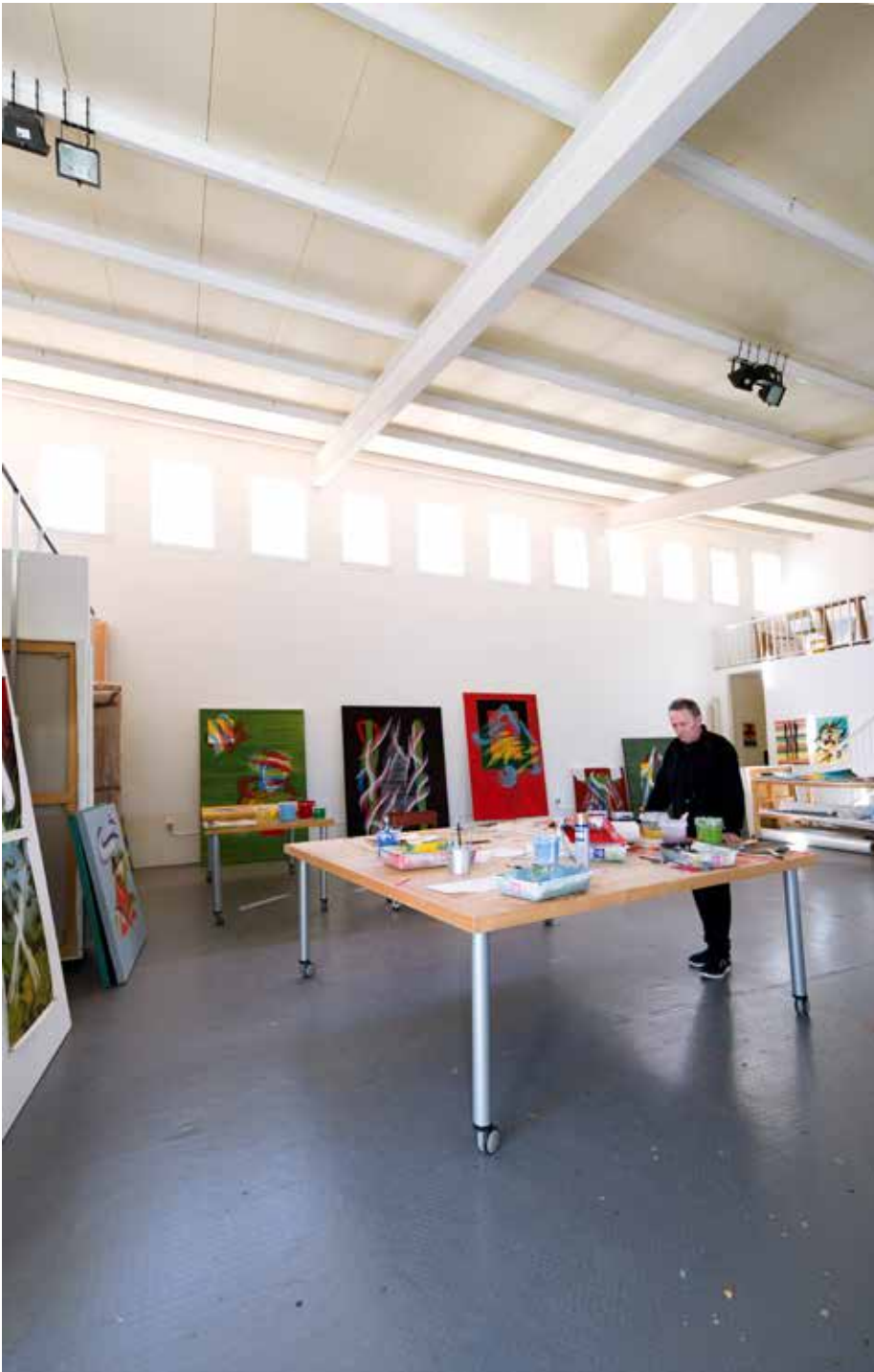
Broto en su estudio de Palma de Mallorca. 2022.

2018 Premio Tomas Francisco Prieto, FNMT, Madrid.