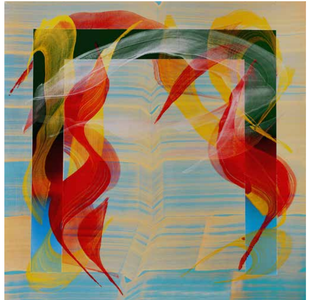
Sin título, 2022 Acrílico sobre lienzo 100 x 100 cm