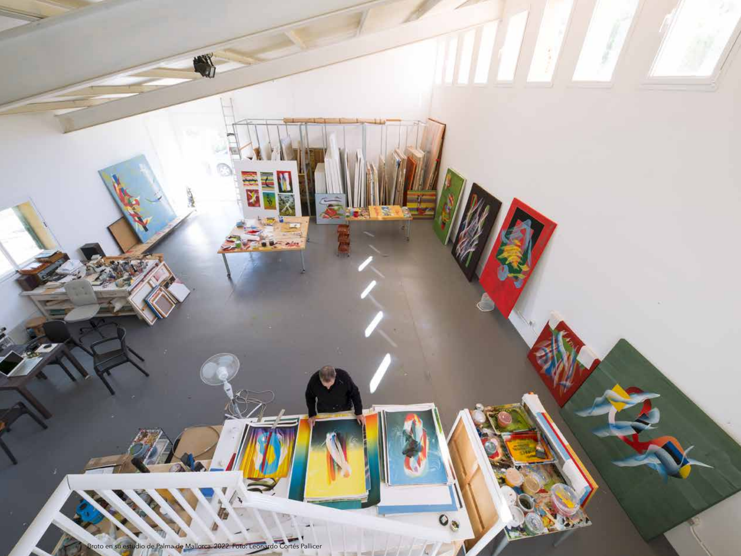
Broto en su estudio de Palma de Mallorca. 2022.