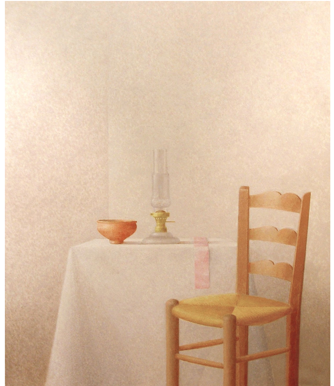
"Silla y naturaleza muerta con quinqué". Óleo sobre lienzo. 130 x 97 cm. 1993.