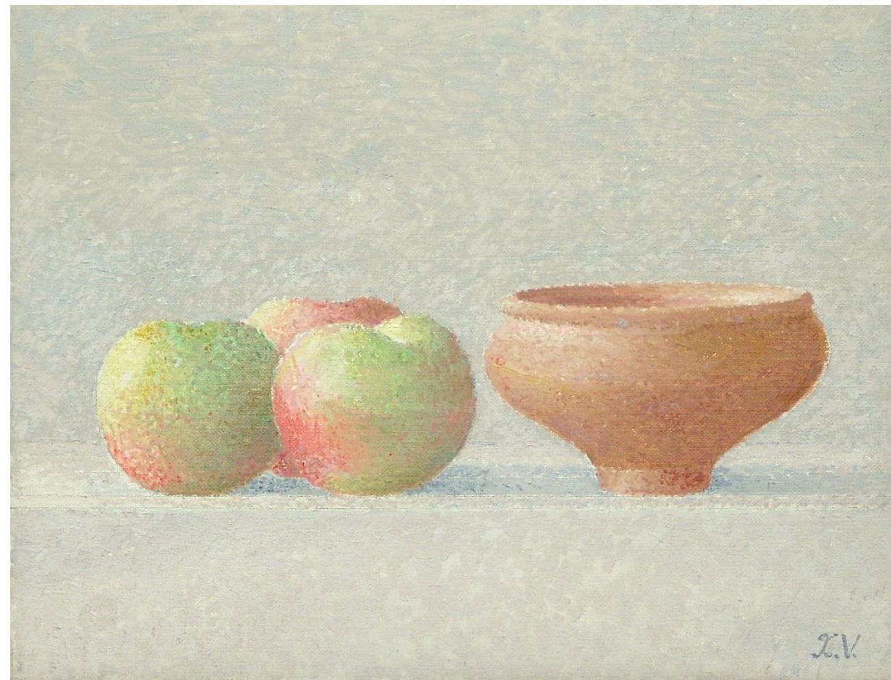
"Manzanas y cuenco". Óleo sobre lienzo. 27 x 35 cm. 2001.