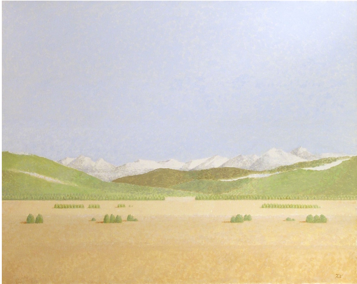
"Il Lucomagno. Ticino-Suiza". Óleo sobre lienzo. 73 x 92 cm. 2006.