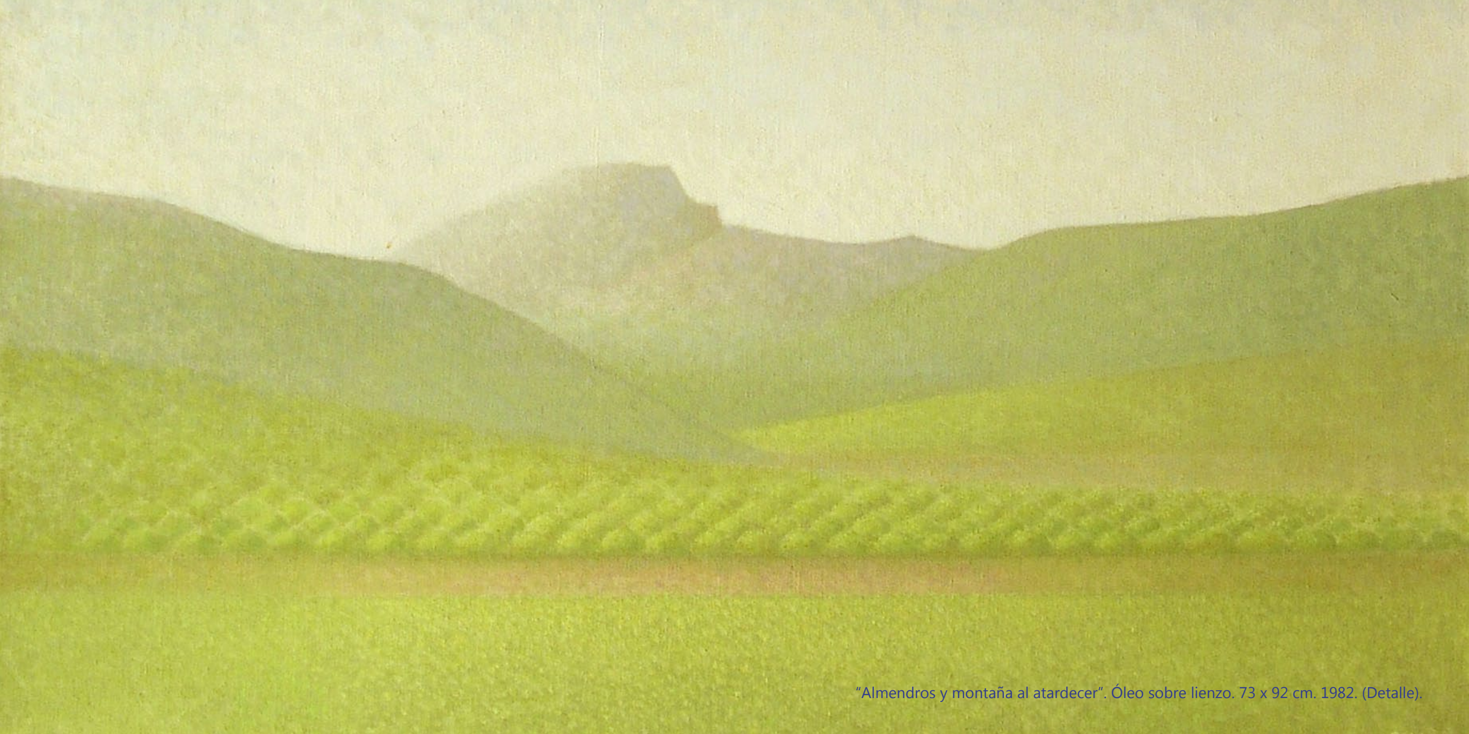
"Almendros y montaña al atardecer". Óleo sobre lienzo. 73 x 92 cm. 1982. (Detalle).