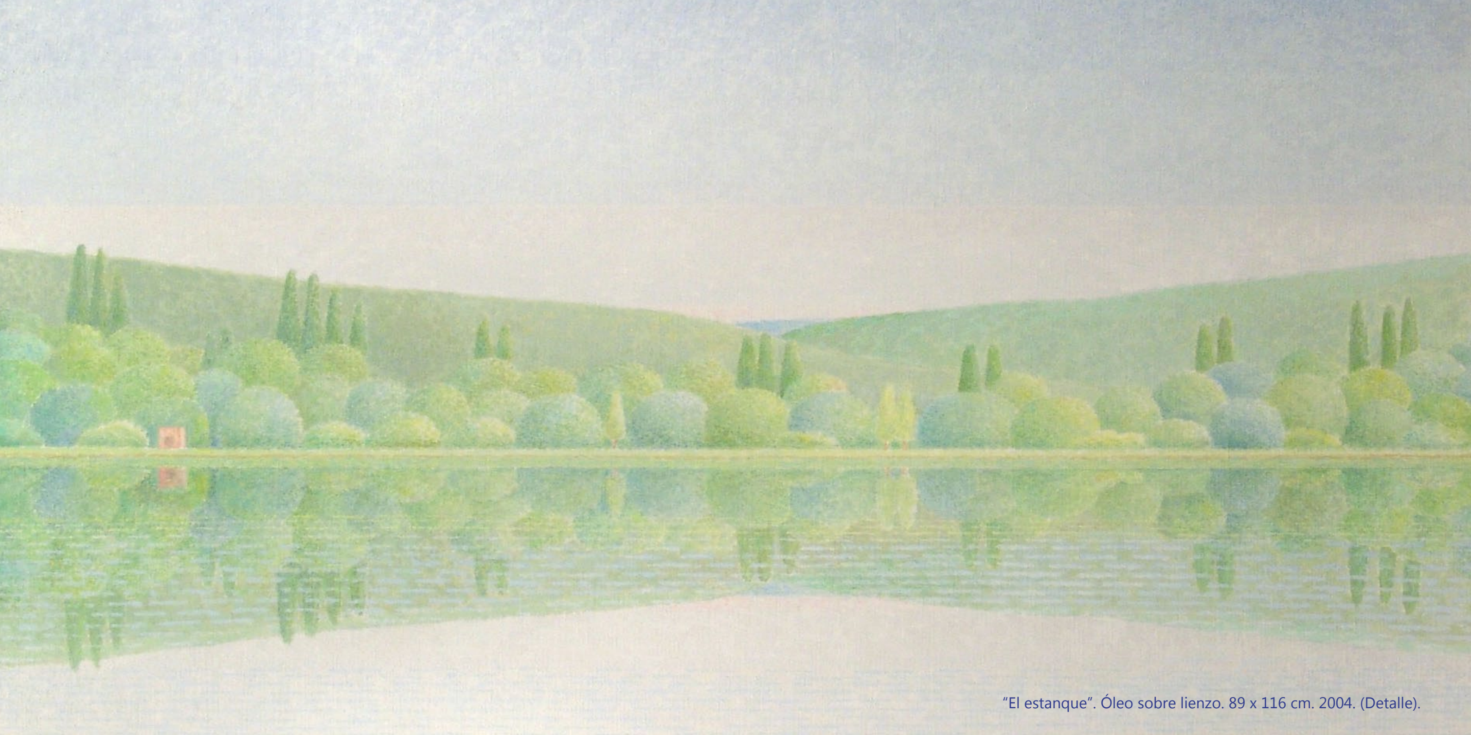
"El estanque". Óleo sobre lienzo. 89 x 116 cm. 2004. (Detalle).