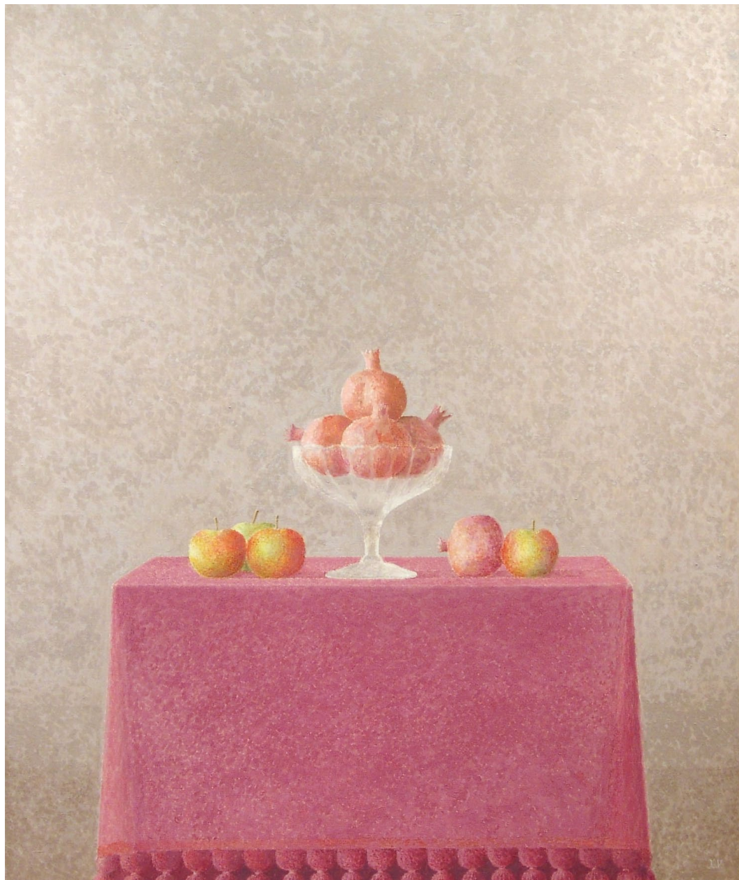
"Frutero con granadas". Óleo sobre lienzo. 116 x 89 cm. 2002.