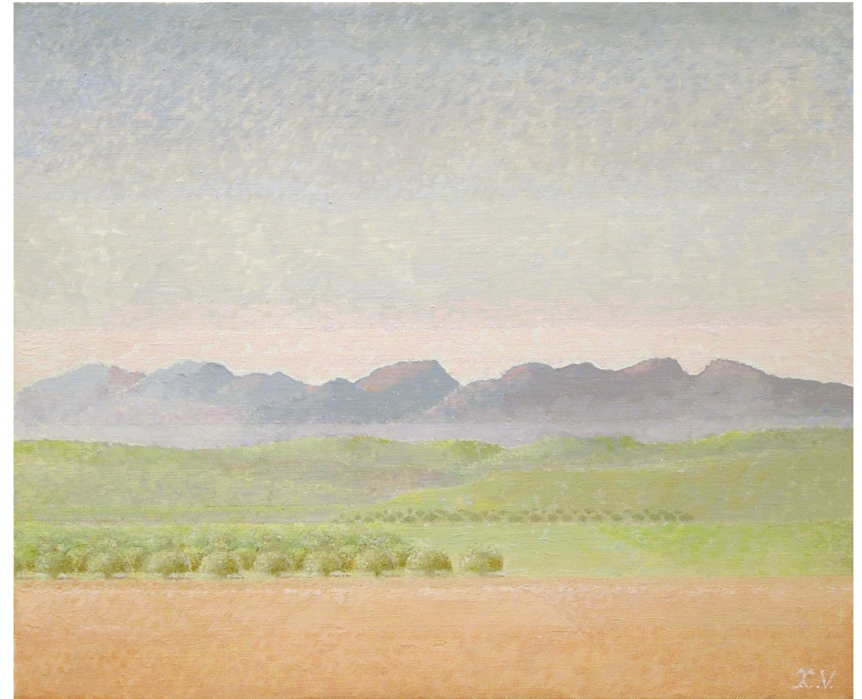
"Brumas vespertinas". Óleo sobre lienzo. 38 x 46 cm. 2006.