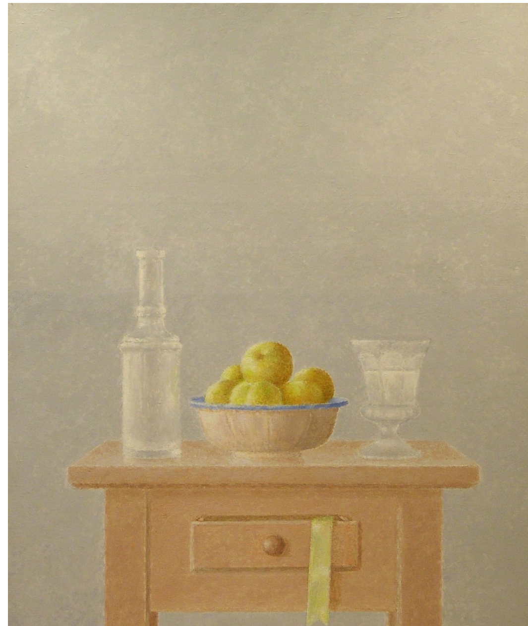
"Frutero con manzanas amarillas, botella y copa de cristal". Óleo sobre lienzo. 75 x 60 cm. 2006.