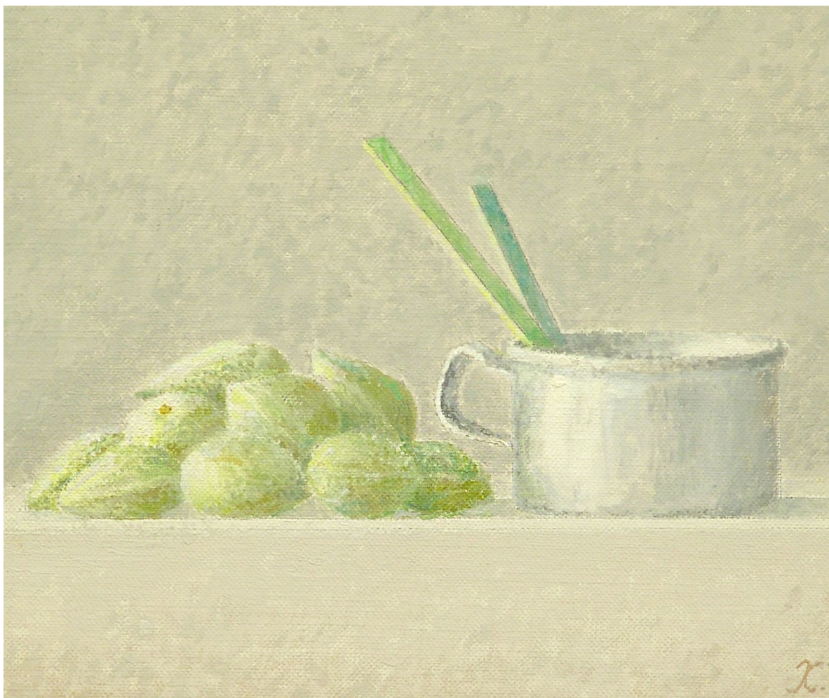
"Almendras verdes". Óleo sobre lienzo. 22 x 27 cm. 2000.