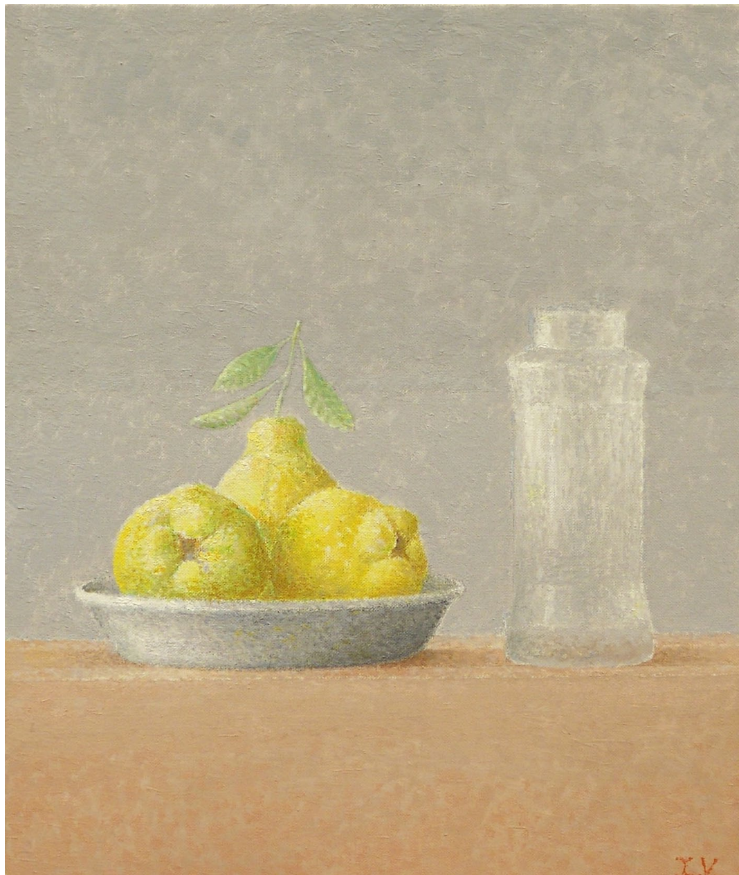
"Tres membrillos y tarro". Óleo sobre lienzo. 46 x 38 cm. 2004.