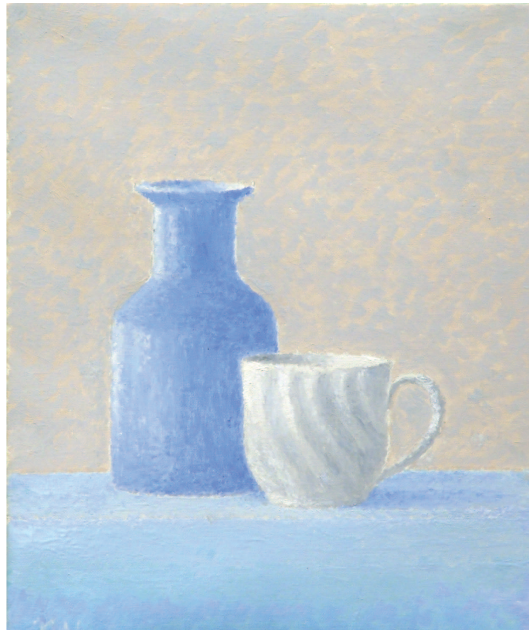
"Botella azul y taza blanca". Óleo sobre lienzo. 27 x 22 cm. 2006.