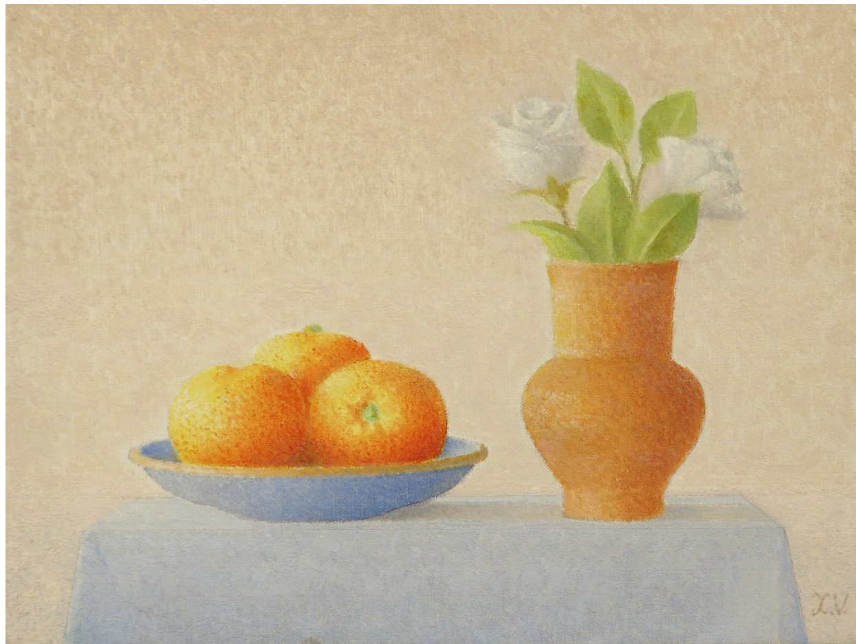
"Naranjas y rosas". Óleo sobre lienzo. 33 x 41 cm. 1997.