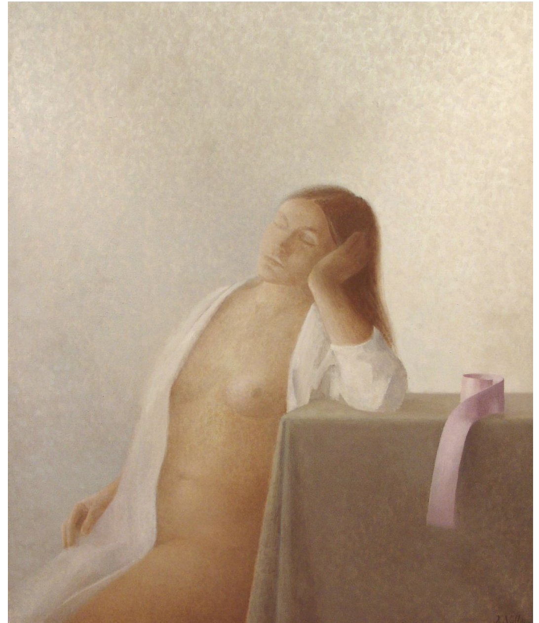
"Le repose". Óleo sobre lienzo. 116 x 89 cm. 1972.