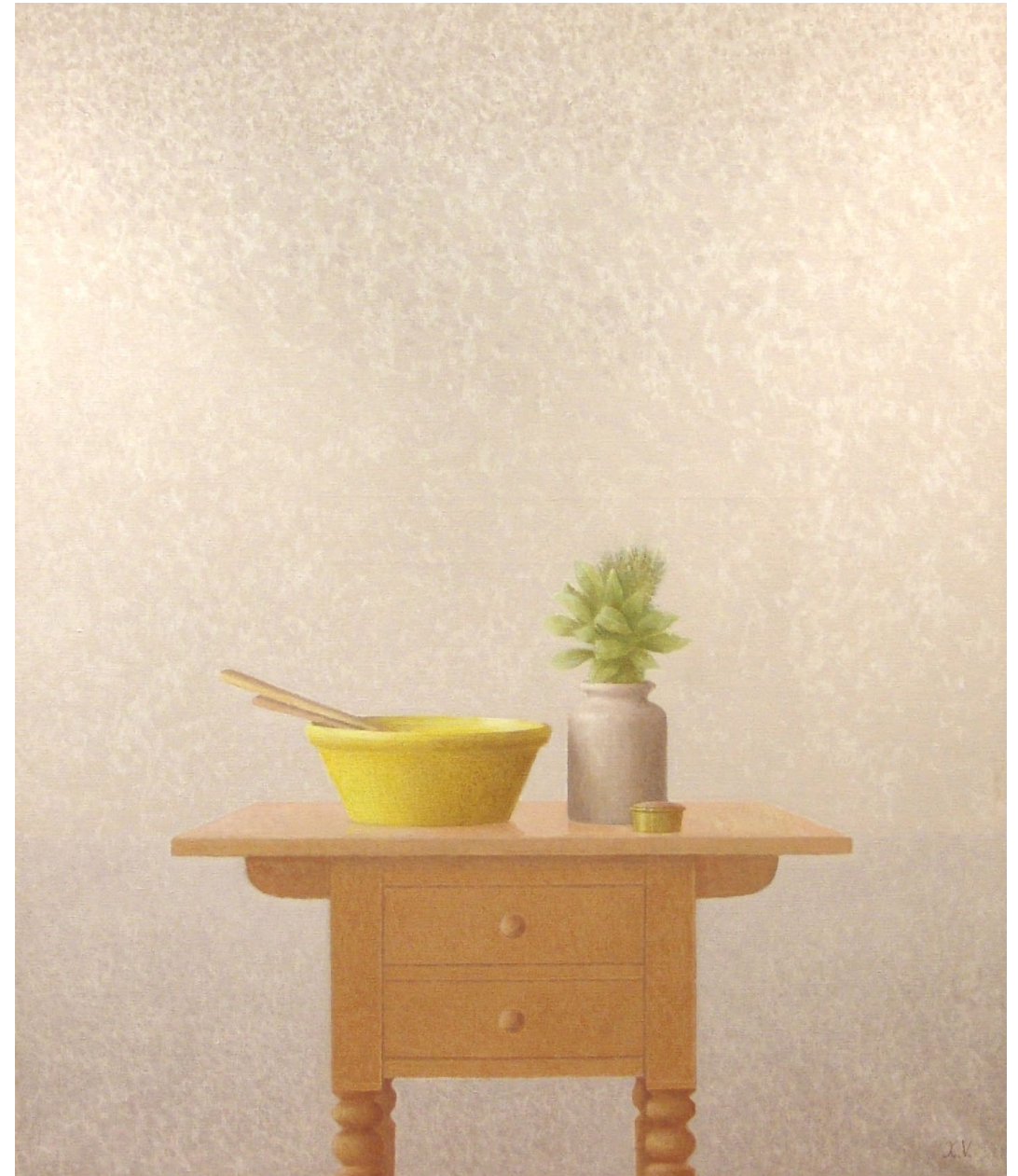
"Mesa con cerámica amarilla y tarro con hojas de laurel". Óleo sobre lienzo. 116 x 89 cm. 1988.