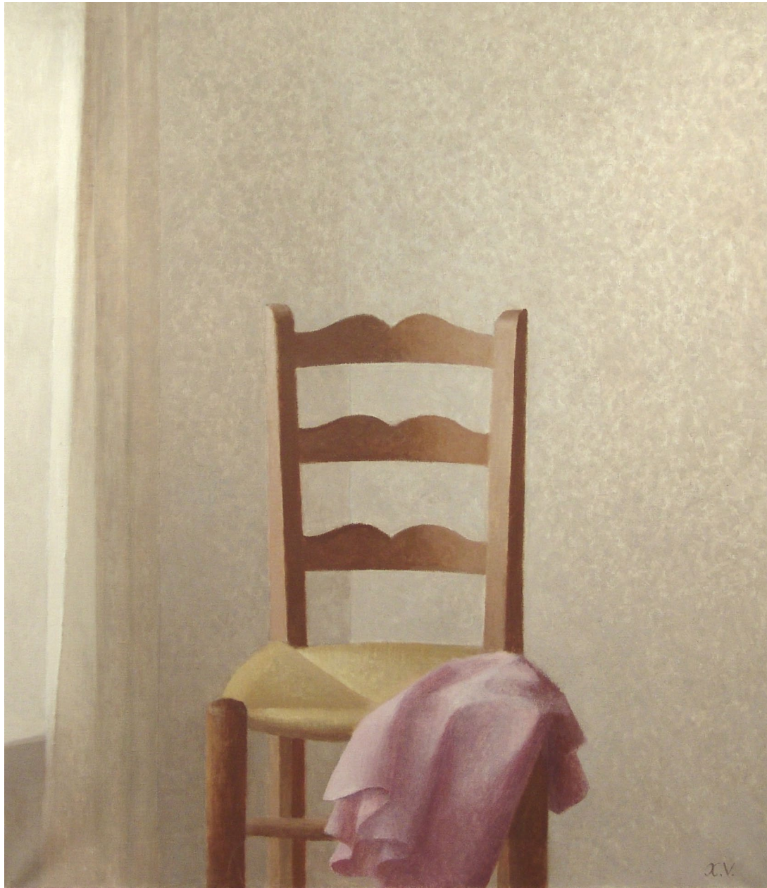
"La silla". Óleo sobre lienzo. 116 x 89 cm. 1972.