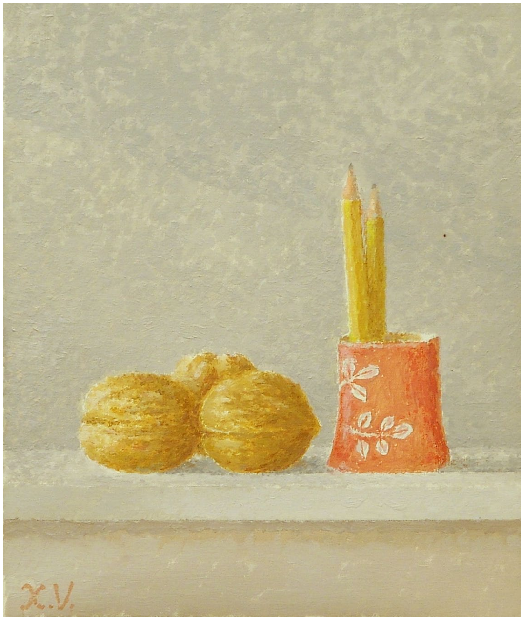
"Tres nueces y cerámica china con lápices". Óleo sobre lienzo. 27 x 22 cm. 2006.