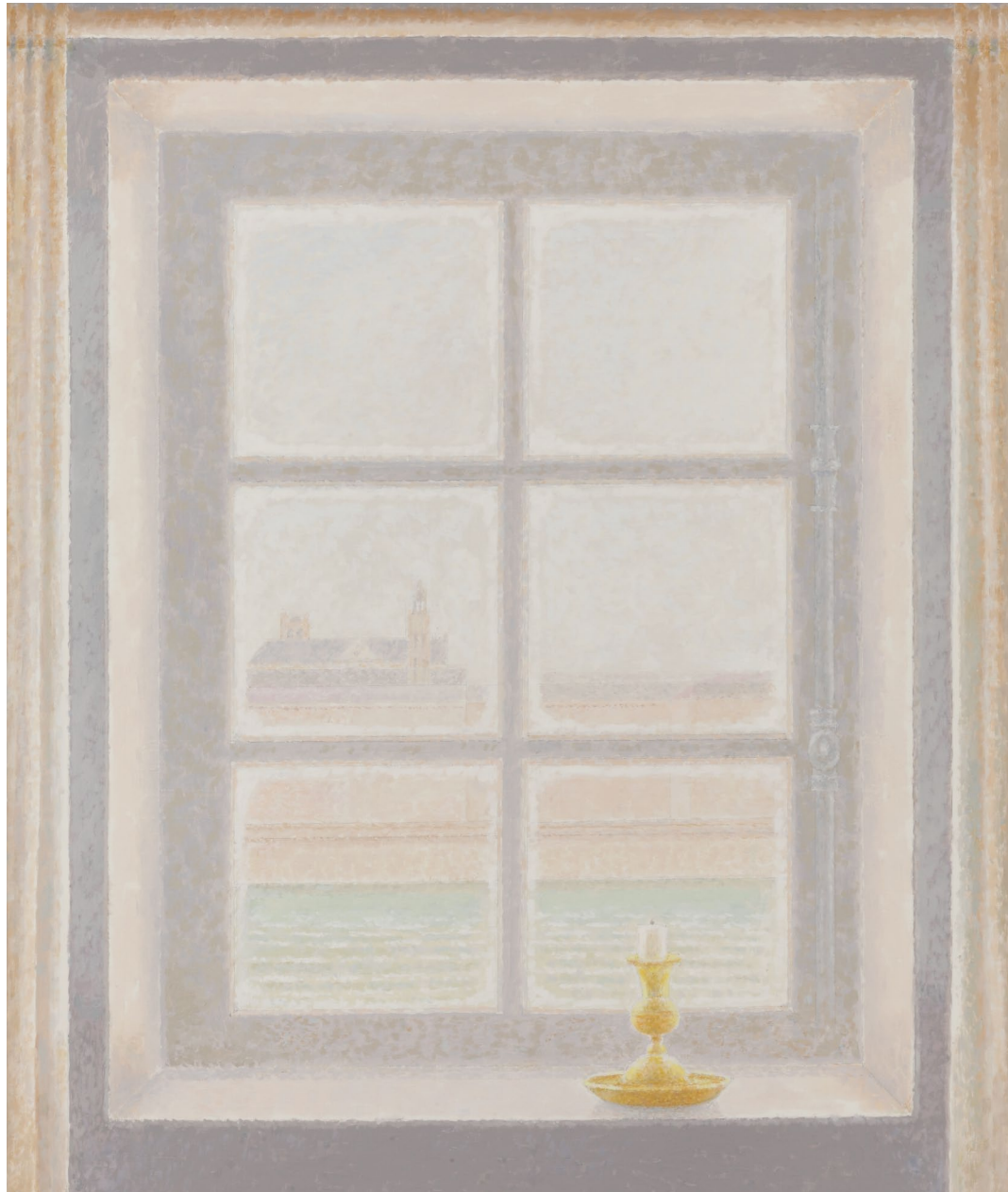
"Ventana en invierno sobre el Sena". Óleo sobre lienzo. 92 x 73 cm. 2006.