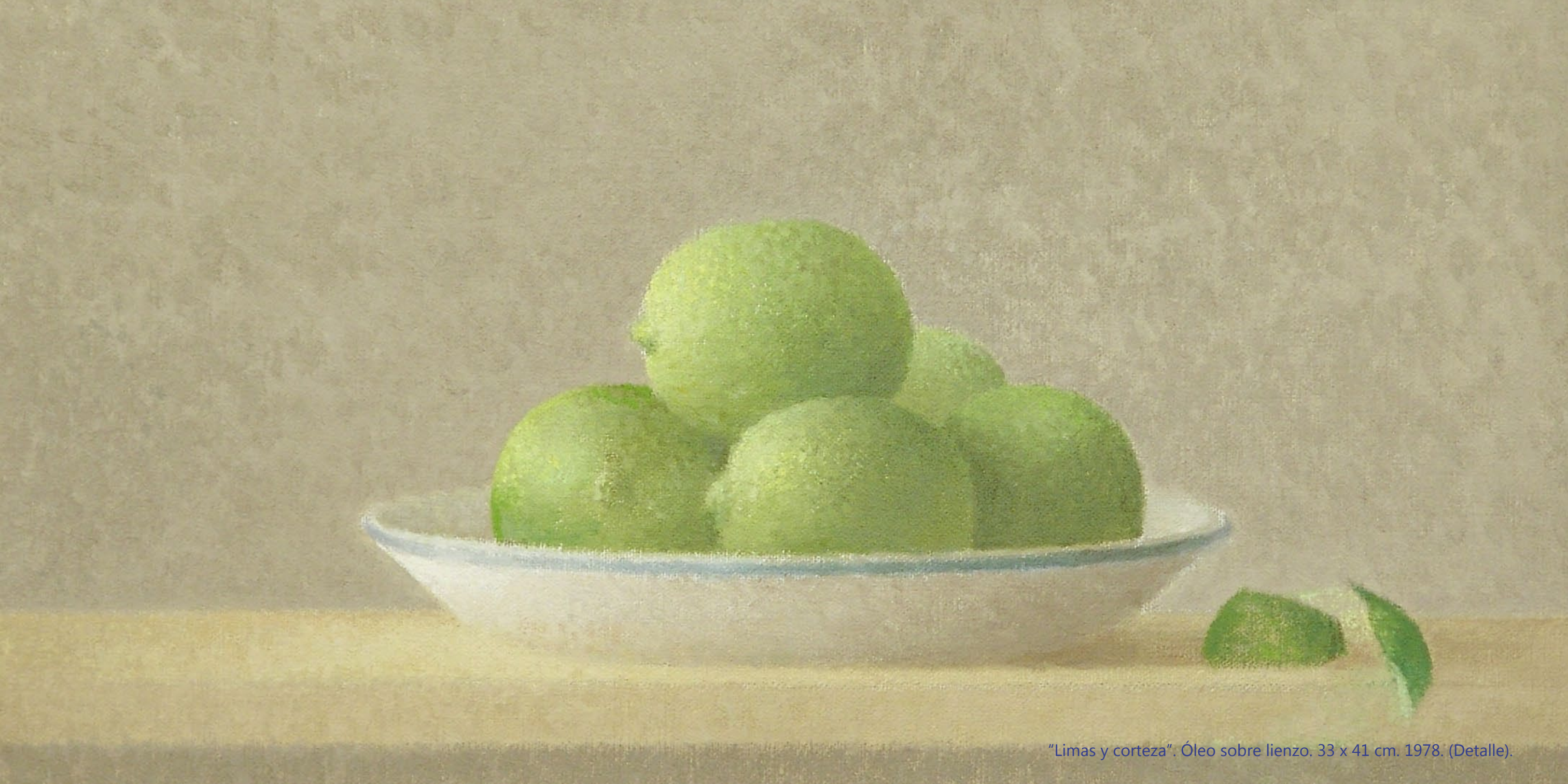
"Limas y corteza". Óleo sobre lienzo. 33 x 41 cm. 1978. (Detalle).