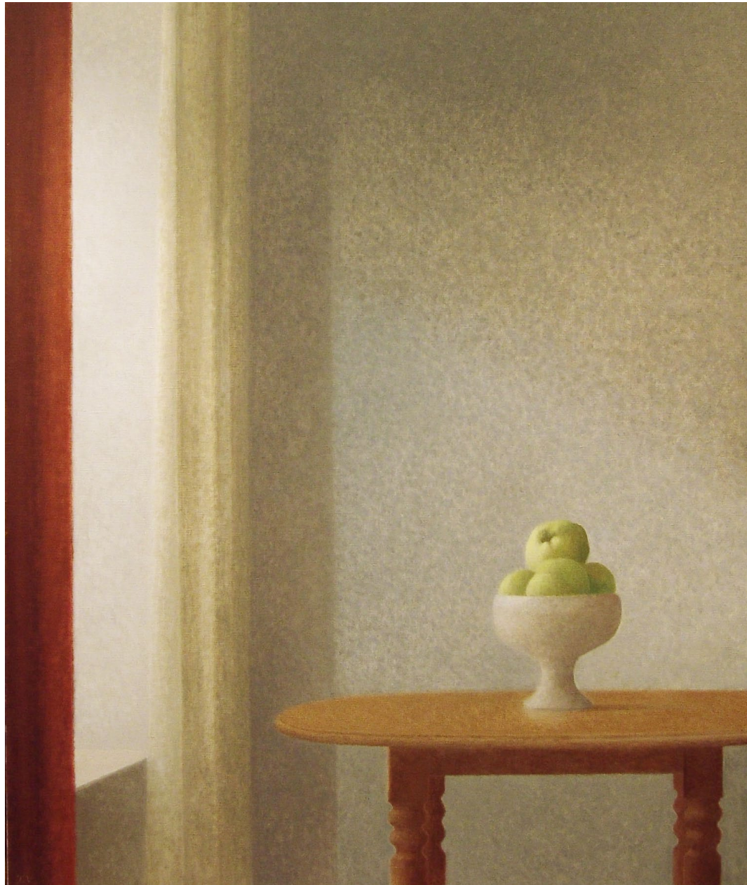
"Table au compotier". Óleo sobre lienzo. 130 x 97 cm. 1975.