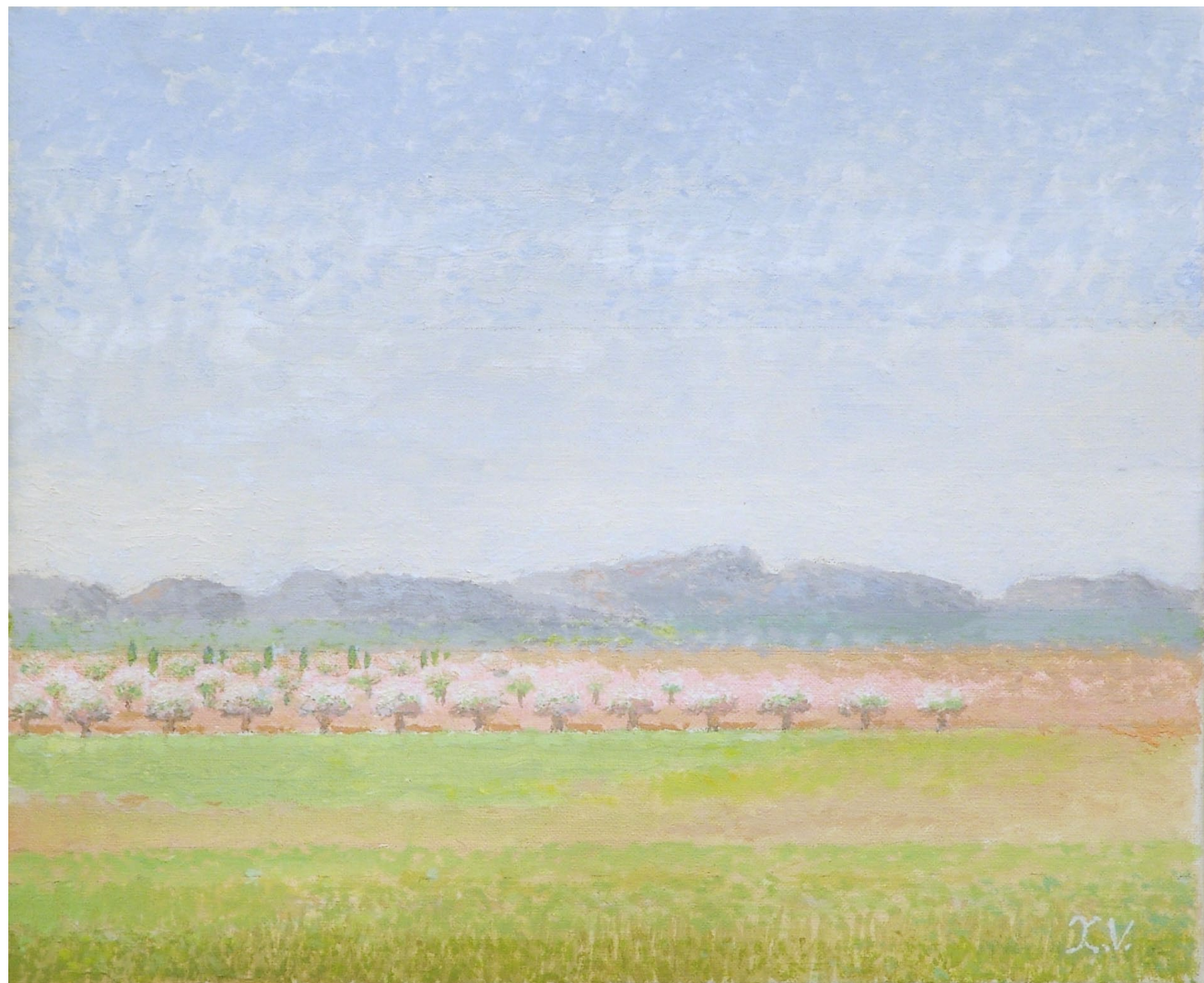
"Almendros en flor". Óleo sobre lienzo. 22 x 27 cm. 2006.