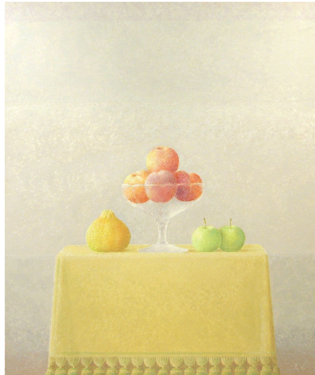
Taronja, frutero con duraznos y dos manzanas verdes sobre mantel aterciopelado y borlas. Óleo sobre lienzo. 92 x 73 cm. 2004.