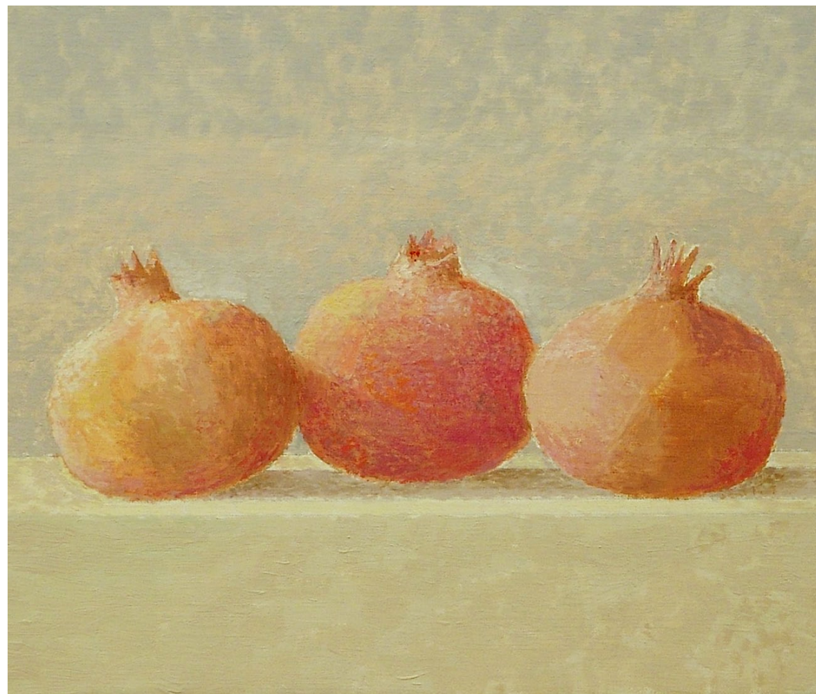
"Tres granadas". Óleo sobre lienzo. 27 x 33 cm. 2000.