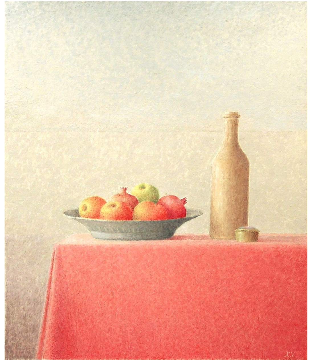
"Plato con manzanas, granadas y botella blanca". Óleo sobre lienzo. 73 x 60 cm. 2004.