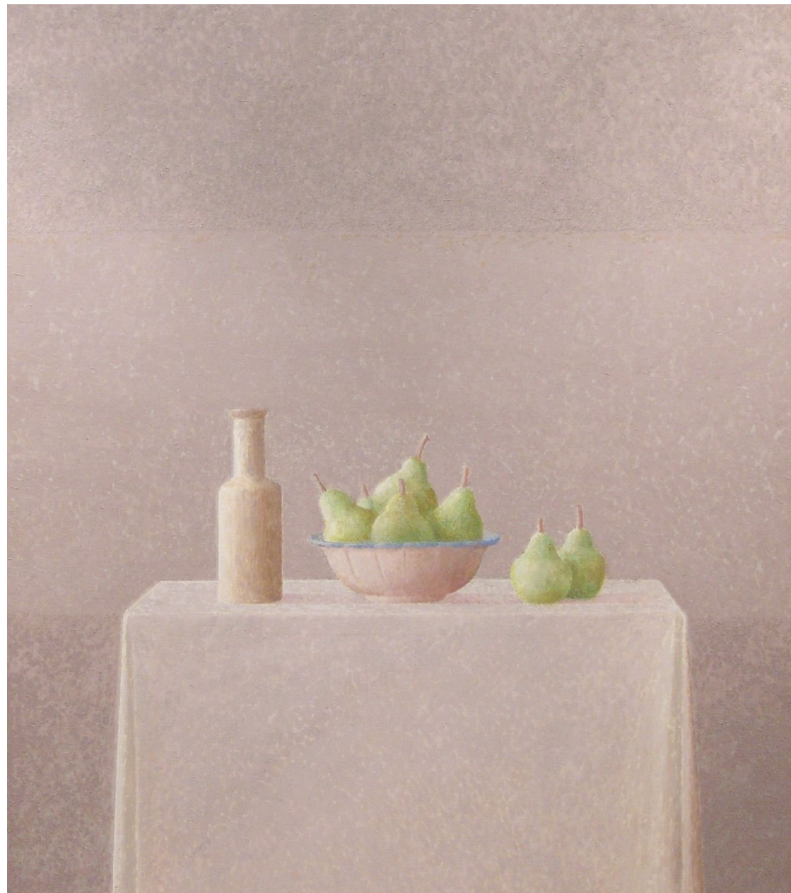
"Cerámica y peras". Óleo sobre lienzo. 116 x 89 cm. 2002.