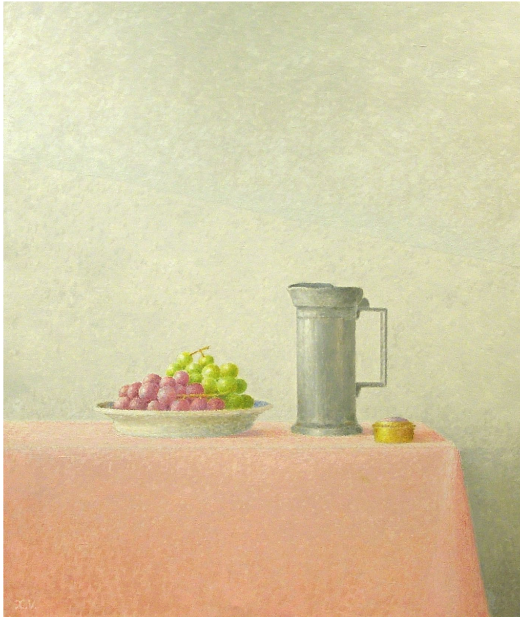
"Plato con uvas, recipiente de estaño y cajita dorada". Óleo sobre lienzo. 75 x 60 cm. 2006.