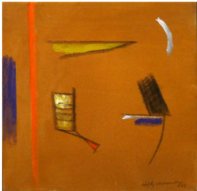
“OBJETOS”. Pintura sobre lienzo. 50 x 50 cm. 2003