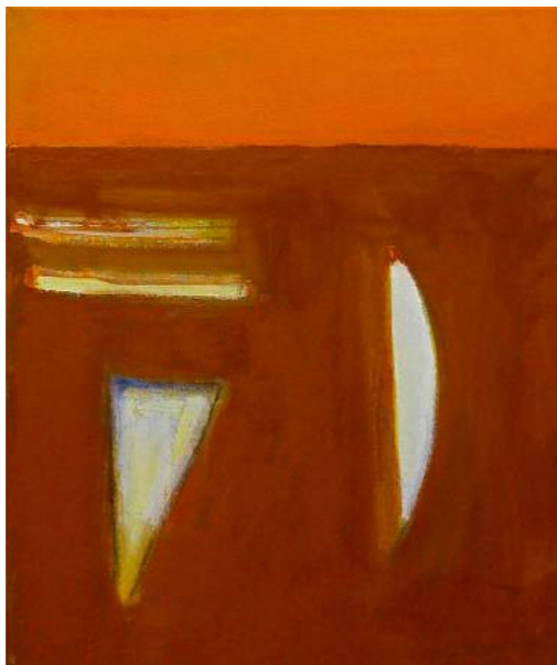
“HORIZÓ ROIG”. Pintura sobre lienzo. 46 x 38 cm. 2004