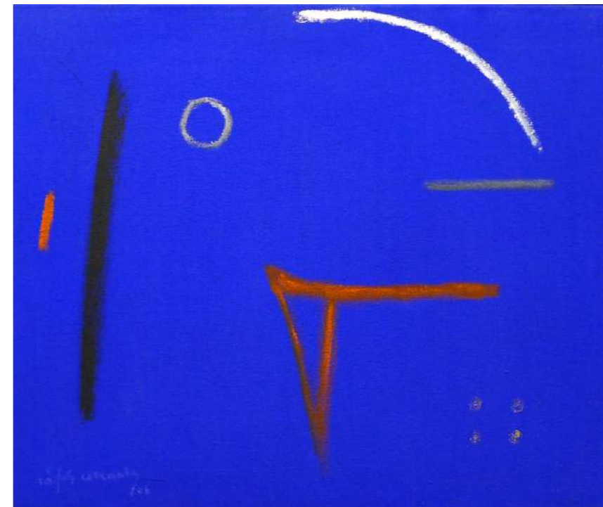
“SIGNOS DINS BLAU”. Pintura sobre lienzo. 54 x 65 cm. 2006