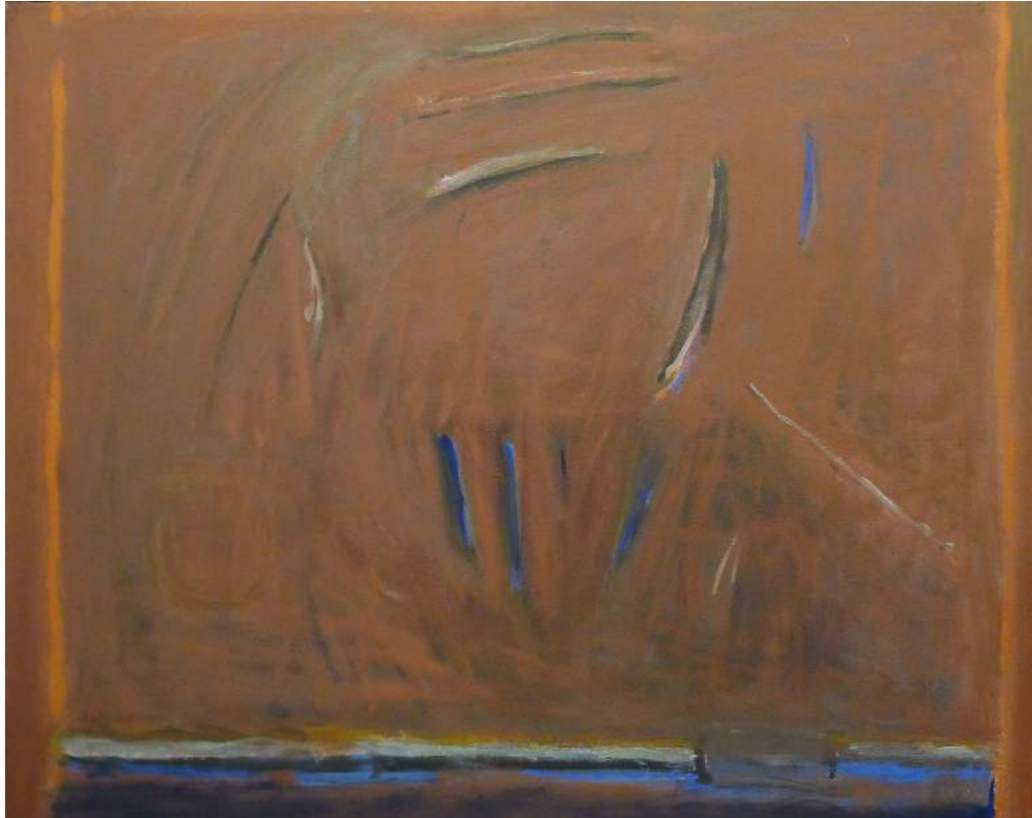
“CRÓNICA MEJICANA”. Pintura sobre lienzo. 114 x 146 cm. 1985