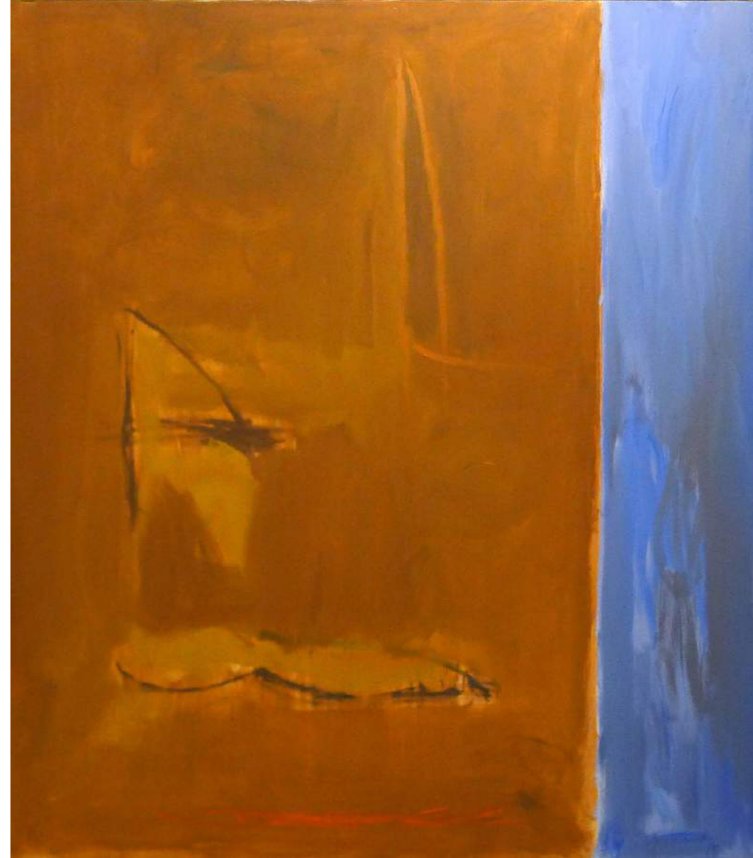
“MAR DE TERRA” Pintura sobre lienzo 195 x 180 cm 1990