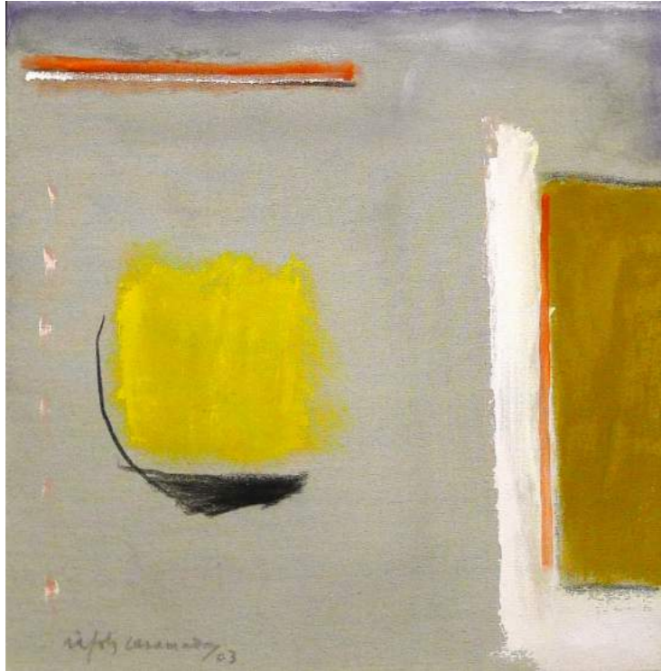
“CONSTRUCCIO”. Pintura sobre lienzo. 50 x 50 cm. 2003