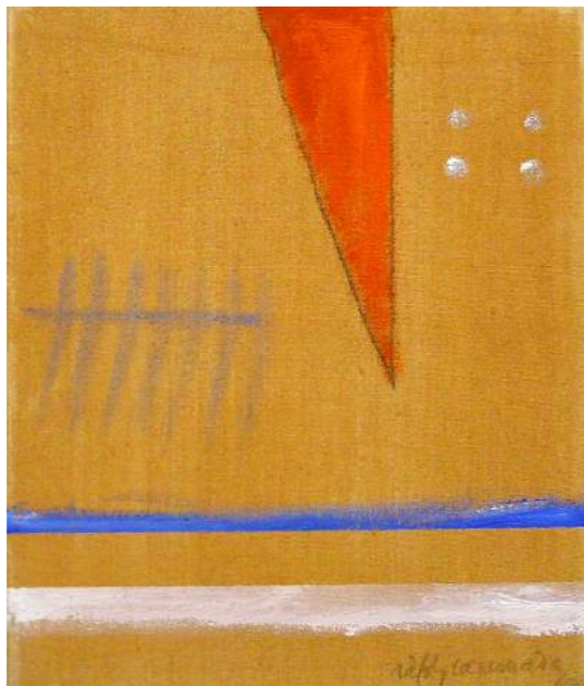
“ANGLE VERMELL”. Pintura sobre lienzo. 46 x 38 cm. 2004