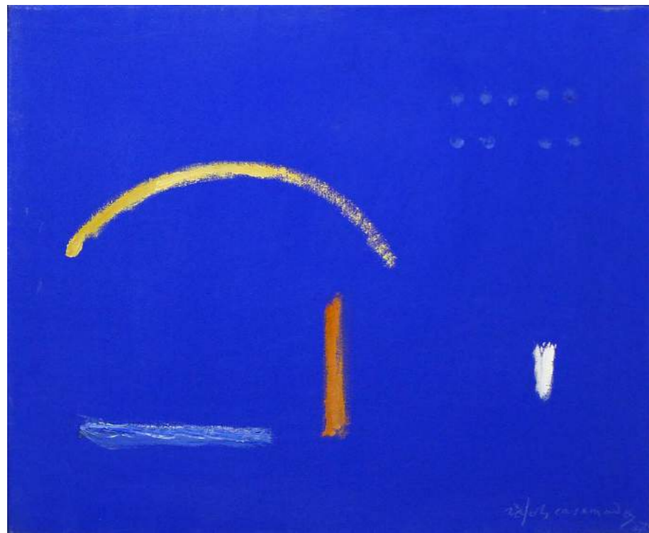
“ESPAI BLAU”. Pintura sobre lienzo.60 x 73 cm. 2007