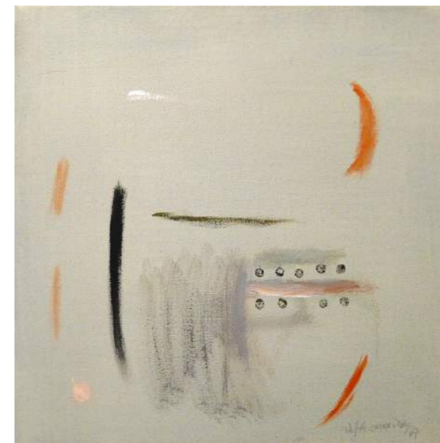
“RITME CREPUSCULAR”. Pintura sobre lienzo. 70 x 70 cm. 2007