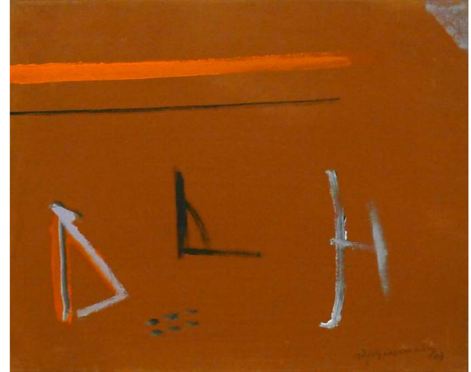
“TRES NOTES”. Pintura sobre lienzo. 46 x 55 cm. 2003