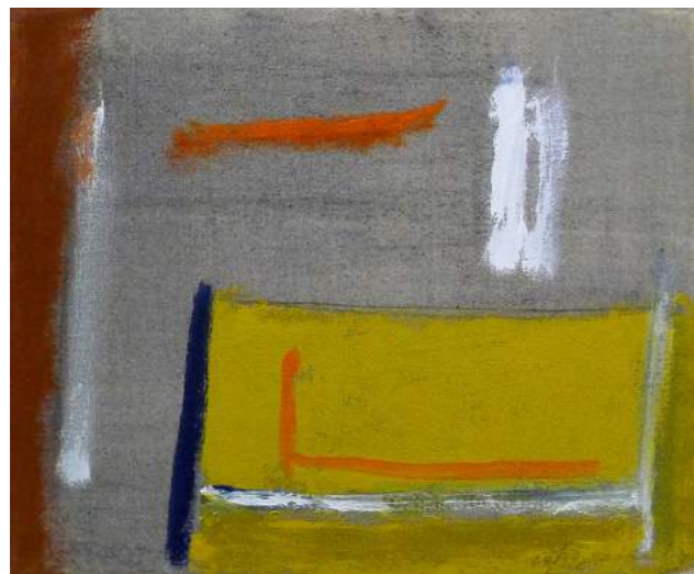
“ESTUDIO”. Pintura sobre lienzo. 38 x 46 cm. 2005