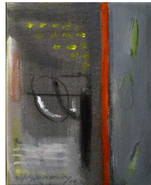
“RADLLA ROJA”. Pintura sobre lienzo. 41 x 33 cm. 2004