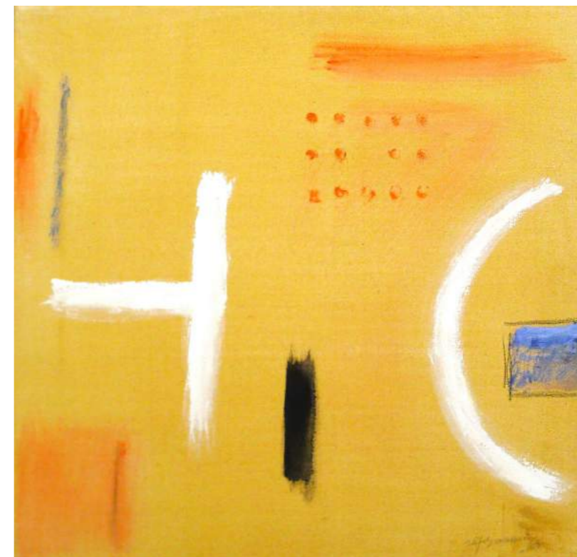
“SIGNOS DE LUZ”. Pintura sobre lienzo. 70 x 70 cm. 2007