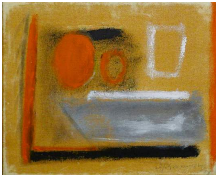
“CIRUNLOS”. Pintura sobre lienzo. 38 x 46 cm. 2005