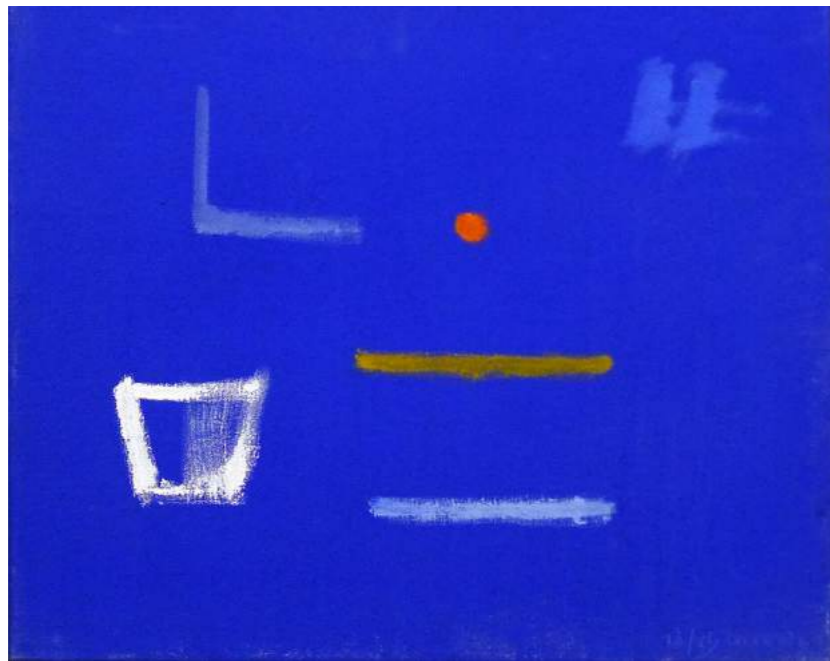
“PRESENCIES”. Pintura sobre lienzo. 46 x 55 cm. 2007