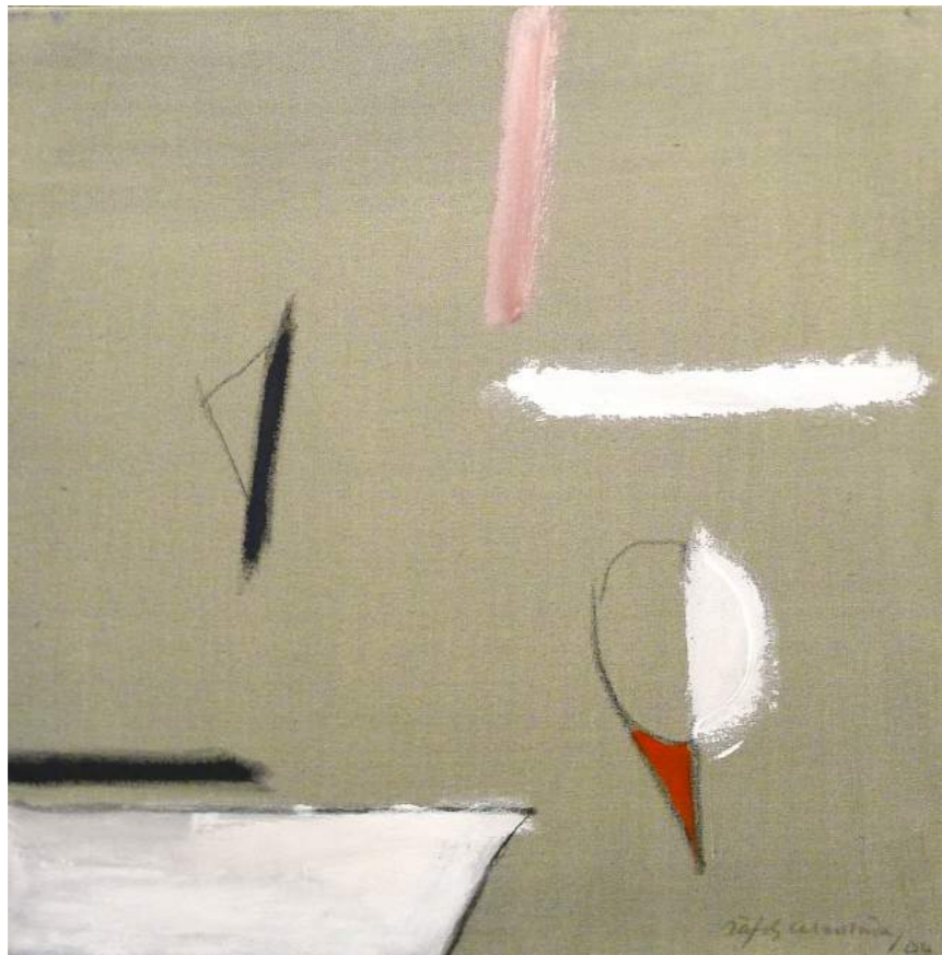
“RIMA EL GRIS”. Pintura sobre lienzo. 70 x 70 cm. 2004