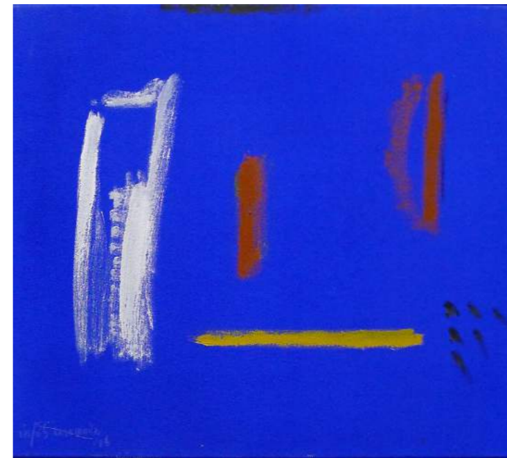
“NOCTURNO AZUL”. Pintura sobre lienzo. 46 x 55 cm. 2006