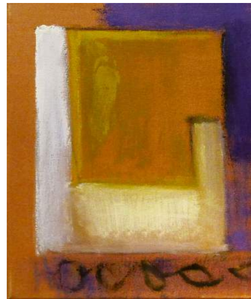
“CONSTRUCCIÓN”. Pintura sobre lienzo. 46 x 38 cm. 2004