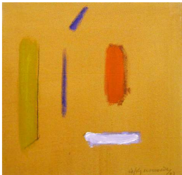
“EL MIRALL”. Pintura sobre lienzo. 50 x 50 cm. 2003