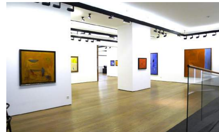
Galería Fernández-Braso. Marzo 2016

Sus cuadros se encuentran en museos y colecciones públicas y privadas de todo el mundo, como los Guggenheim de Nueva York y Bilbao, el British Museum y la Tate Gallery de Londres, el Museo de Arte Moderno de Nueva York, el Centro Pompidou de París y el Reina Sofía de Madrid.