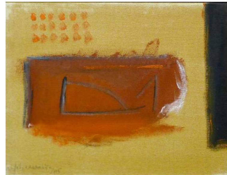
“SIGNOS”. Pintura sobre lienzo. 38 x 46 cm. 2005