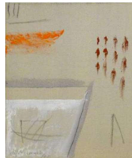
“MULTITUT”. Pintura sobre lienzo. 46 x 38 cm. 2005