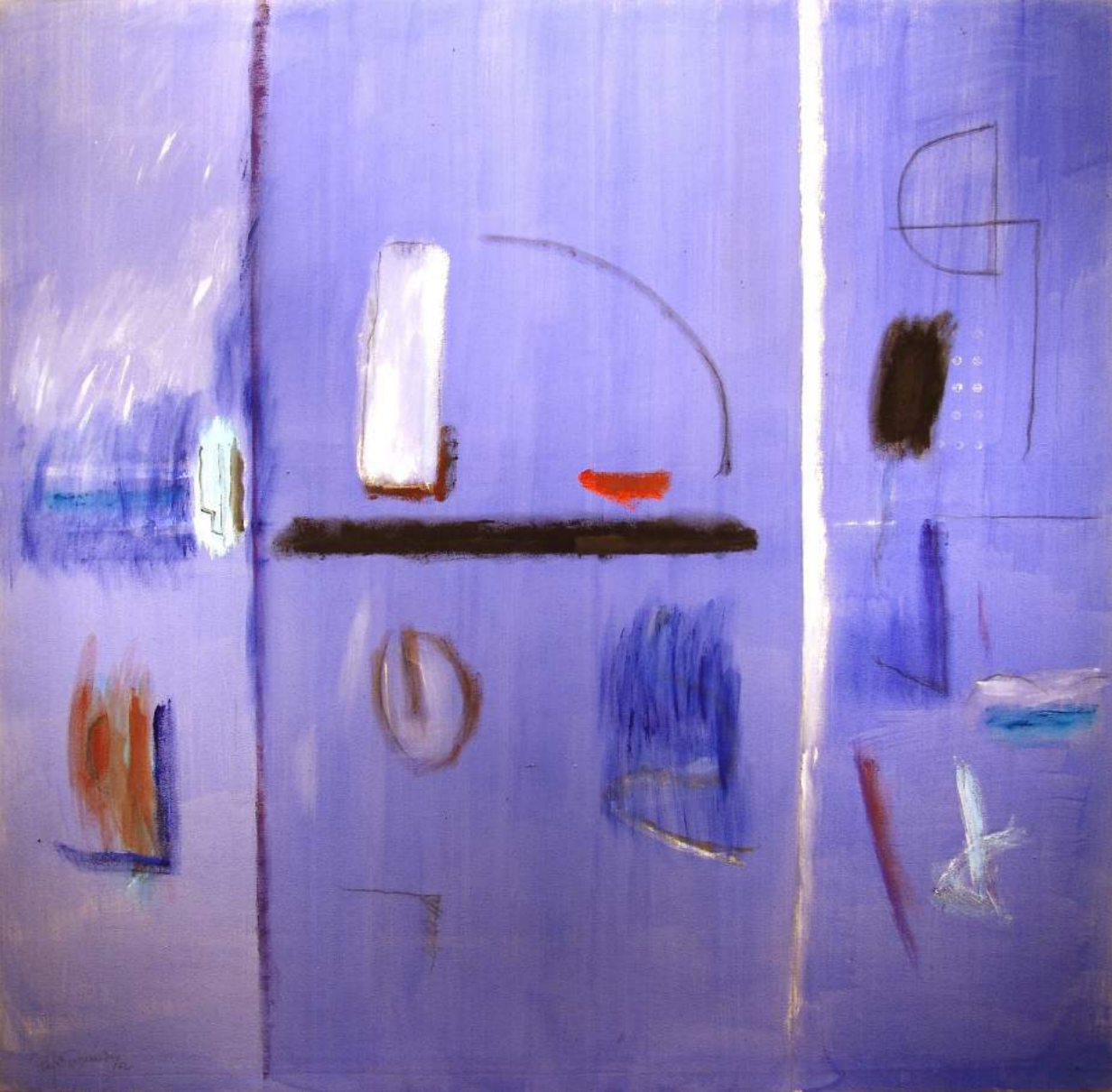
“TRIPLE SPAI” Pintura sobre lienzo 180 x 180 cm. 2002