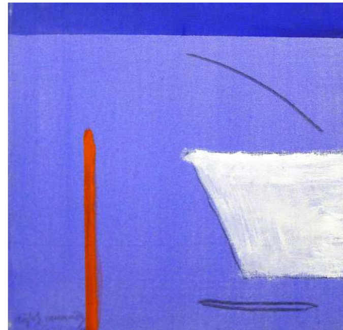
“DEL PORT”. Pintura sobre lienzo. 50 x 50 cm. 2004