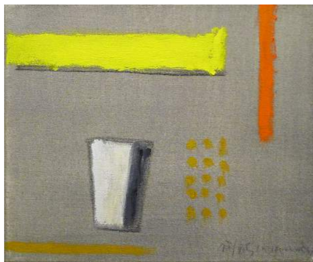
“OBJETOS”. Pintura sobre lienzo. 38 x 46 cm. 2005