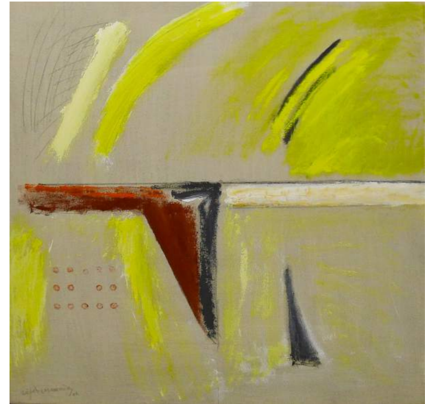
“RITMO AMARILLO”. Pintura sobre lienzo. 100 x 100 cm. 2005