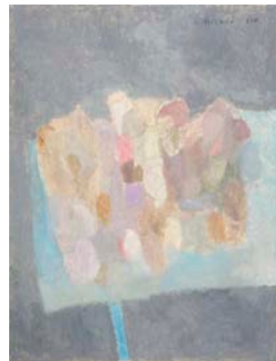
Globos , 1960 Óleo sobre cartulina 65 x 50 cm

Catálogo razonado de Mompó. Tomo 1. Pág. 228. Ref. 1960/28 Procedencia: Estudio del artista || Colección hijos de Hernández Mompó Exposiciones: Mompó , Logroño, Sala Amós Salvador, 1997; Segovia, Torreón de Lozoya, 1997 || Mompó , Murcia, Palacio Almodí, 1999