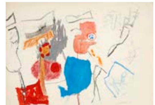
Sin título , 1961 Técnica mixta sobre papel 35 x 50 cm

Catálogo razonado de Mompó Tomo 1. Pág. 279. Ref. 1961/81 Procedencia: Estudio del artista || Colección hijos de Hernández Mompó