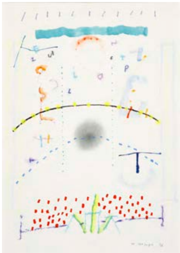
Campesinos en una plaza , 1976. Técnica mixta sobre papel 44 x 31 cm

Catálogo razonado de Mompó. Tomo 2. Pág. 274. Ref. 1976/28 Procedencia: Estudio del artista || Galería Juana Mordó, Madrid || Colección particular, Madrid