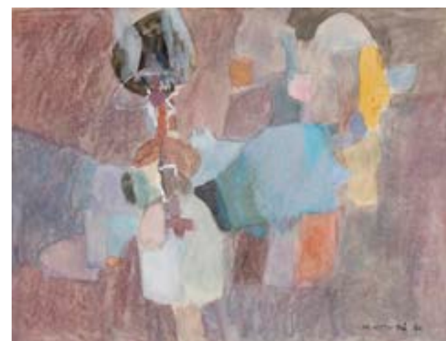
Sin título , 1960. Técnica mixta sobre papel. 50 x 66 cm

Catálogo razonado de Mompó Tomo 1. Pág. 232. Ref. 1960/36 Procedencia: Estudio del artista || Colección hijos de H. Mompó Exposiciones: Mompó íntimo (1958-1970). Teruel, Museo de Teruel, 1993; Mompó. Obra sobre papel . Cuenca. Museo de Arte Abstracto, Fundación Juan March, 2002