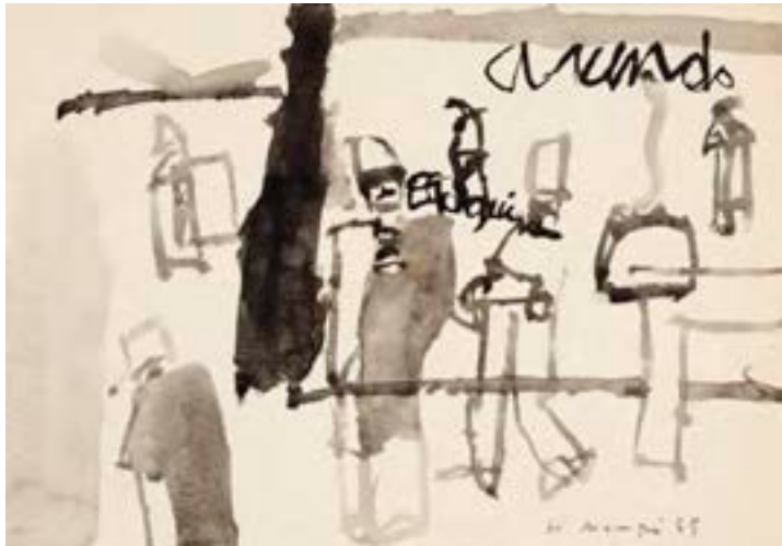
Sin título, 1965. Técnica mixta sobre papel. 19 x 28 cm

Catálogo razonado de Mompó. Tomo 1. Pág. 460. Ref. 1965/101