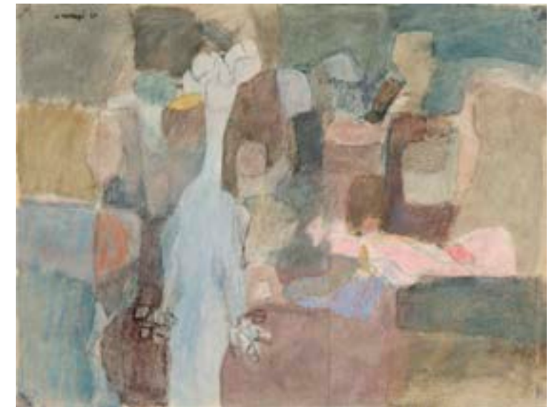
Sin título . 1960. Técnica mixta sobre papel. 50 x 66 cm

Exposiciones: Mompó íntimo (1958-1970) . Museo de Teruel, 1993