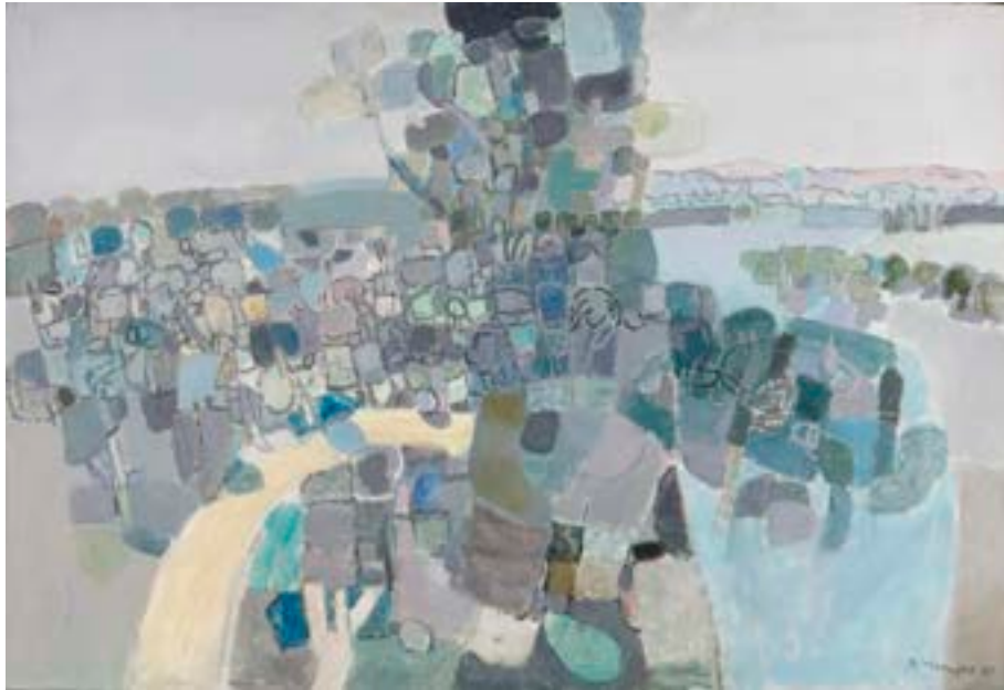
Sin título , 1960. Óleo sobre lienzo. 89 x 130 cm

Catálogo razonado de Mompó. Tomo 1. Pág. 217. Ref. 1960/9