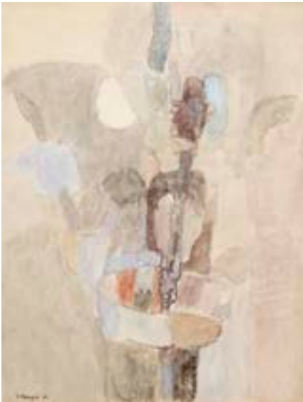
Vendedor de curritos , 1960 Técnica mixta sobre papel 65 x 50 cm

Exposiciones: Mompó íntimo (1958-1970) . Teruel, Museo de Teruel, 1993; Mompó. Obra sobre papel . Cuenca. Museo de Arte Abstracto, Fundación Juan March, 2002