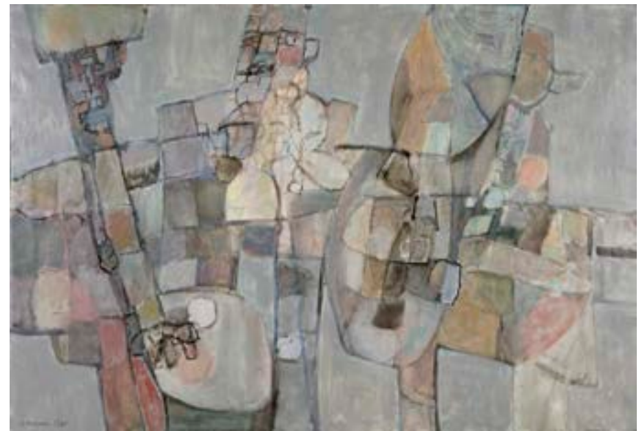
Tres músicos , 1960. Óleo y carboncillo sobre lienzo. 89 x 130 cm

Procedencia: Estudio del artista || Colección hijos de Hernández Mompó