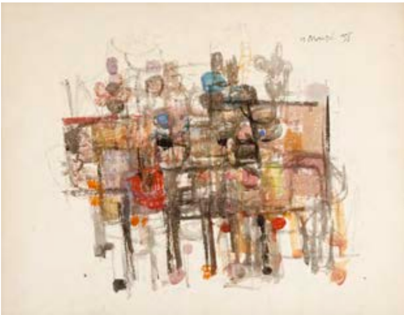
Comparsa , 1958. Técnica mixta sobre papel. 30 x 50 cm

Catálogo razonado de Mompó. Tomo 1. Pág. 186. Ref. 1958/7 Procedencia: Estudio del artista || Colección hijos de Hernández Mompó Exposiciones: Mompó íntimo (1958-1970) . Teruel, Museo de Teruel, 1993