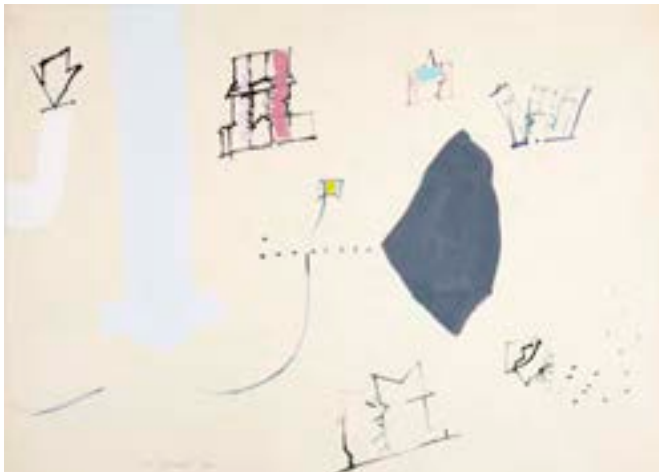
Sin título , 1970. Técnica mixta sobre papel. 50 x 69,5 cm

Catálogo razonado de Mompó. Tomo 2. Pág. 63. Ref. 1969/93 Procedencia: Estudio del artista || Colección hijos de Hernández Mompó Exposiciones: Mompó íntimo (1958-1970) . Teruel, Museo de Teruel, 1993