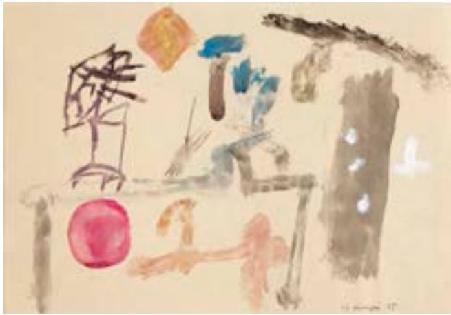
Sin título , 1965. Técnica mixta sobre papel. 21 x 30 cm

Catálogo razonado de Mompó. Tomo 1. Pág. 453. Ref. 1965/90 Procedencia: Estudio del artista || Colección hijos de H. Mompó