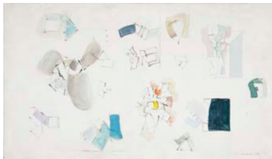
Mercado , 1969. Técnica mixta sobre lienzo. 42 x 73 cm

Exposiciones: XXXIV Exposizione Biennale Internazionale d'Arte di Venezia, Padiglione di Spagna, 1968