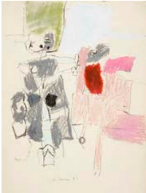
Sin título , 1961 Técnica mixta sobre papel 50 x 35 cm

Catálogo razonado de Mompó Tomo 1. Pág. 261 Ref. 1961/41 Procedencia: Estudio del artista || Colección hijos de Hernández Mompó