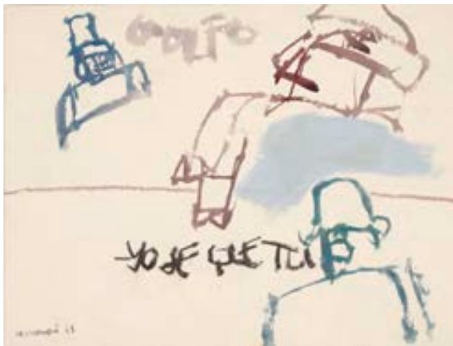
Sin título , 1965. Técnica mixta sobre papel. 19 x 25 cm

Catálogo razonado de Mompó. Tomo 1. Pág. 453. Ref. 1965/90 Procedencia: Estudio del artista || Colección hijos de H. Mompó