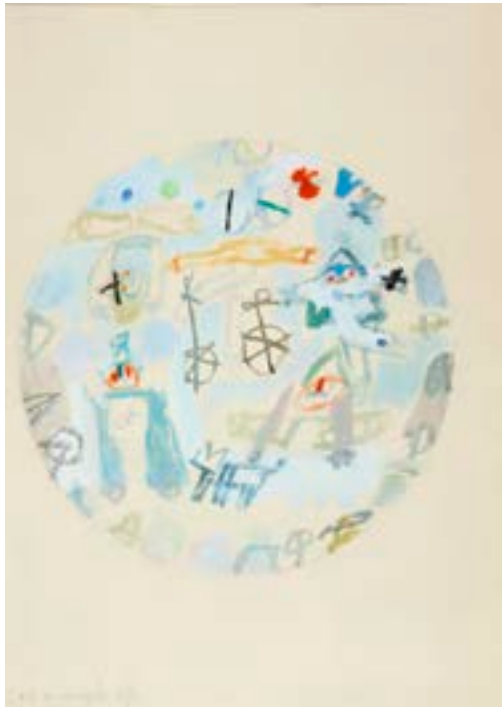
Circo , 1963 Técnica mixta sobre papel 65 x 50 cm

Procedencia: Estudio del artista || Colección particular, Madrid