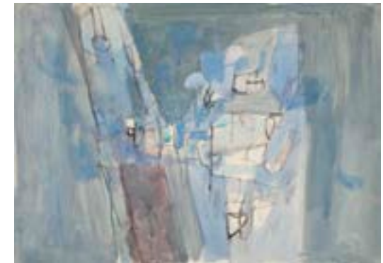
Sin título , 1961 Técnica mixta sobre papel 25 x 35 cm

Catálogo razonado de Mompó Tomo 1. Pág. 276. Ref. 1961/76 Procedencia: Estudio del artista || Colección hijos de Hernández Mompó