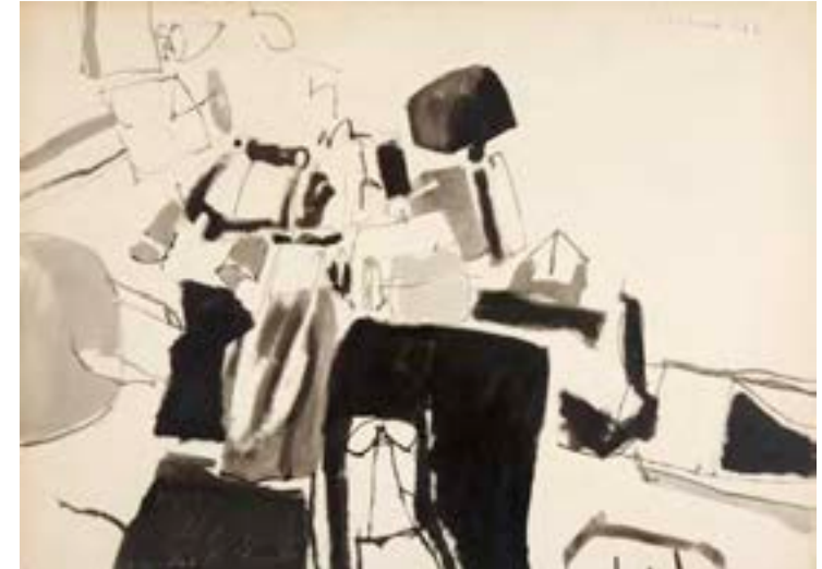
Sin título , 1962. Técnica mixta sobre papel. 50,5 x 70 cm

Catálogo razonado de Mompó. Tomo 1. Pág. 283. Ref. 1961/92 Procedencia: Estudio del artista || Colección hijos de Hernández Mompó