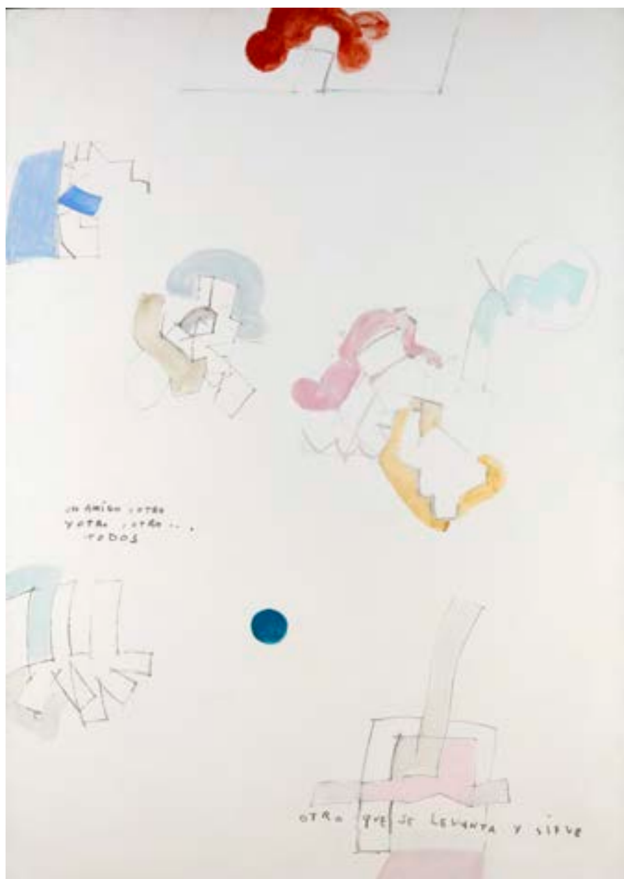
Otro que se levanta , 1968. Técnica mixta sobre lienzo. 195 x 130 cm

Catálogo razonado de Mompó. Tomo 1. Pág. 626. Ref. 1968/34