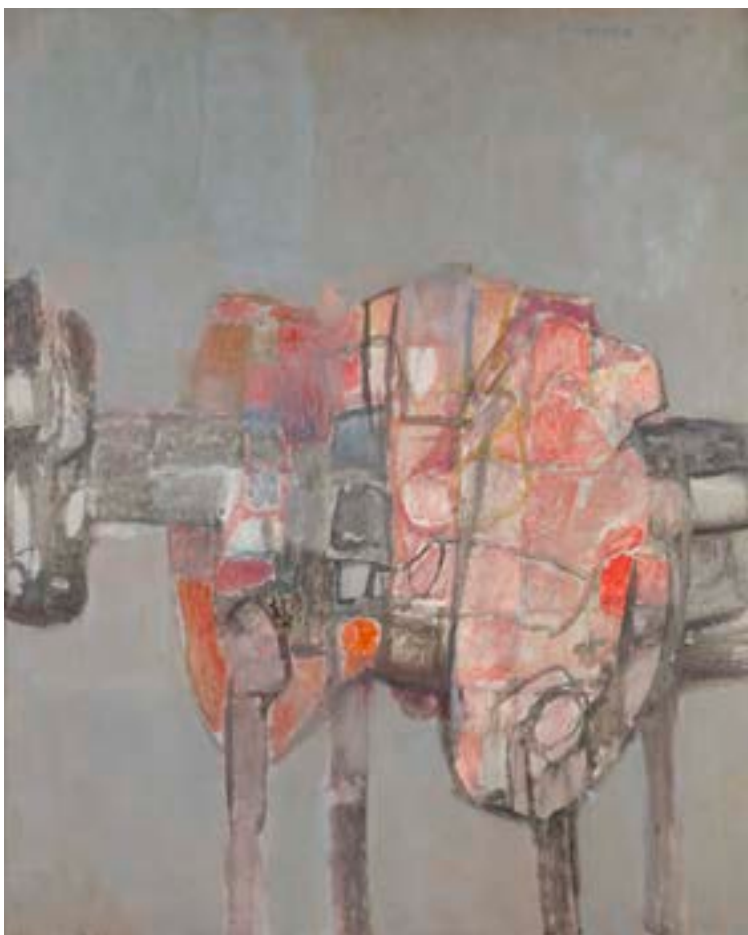
Borriquito , 1960. Óleo sobre lienzo. 100 x 81 cm

Catálogo razonado de Mompó. Tomo 1. Pág. 228. Ref. 1960/28 Procedencia: Estudio del artista || Colección hijos de Hernández Mompó Exposiciones: Mompó , Logroño, Sala Amós Salvador, 1997; Segovia, Torreón de Lozoya, 1997 || Mompó , Murcia, Palacio Almodí, 1999