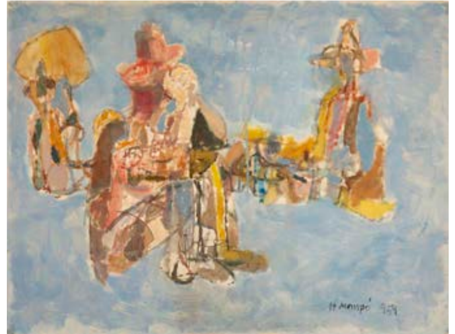
Vagabundo , 1959. Óleo sobre cartulina. 50 x 66 cm

Catálogo razonado de Mompó. Tomo 1. Pág. 183. Ref. 1958/3 Procedencia: Estudio del artista || Colección hijos de H. Mompó