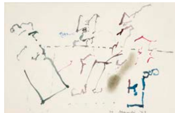
Están sentados , 1973. Técnica mixta sobre papel. 19 x 28 cm

Catálogo razonado de Mompó. Tomo 2. Pág. 274. Ref. 1976/28 Procedencia: Estudio del artista || Galería Juana Mordó, Madrid || Colección particular, Madrid