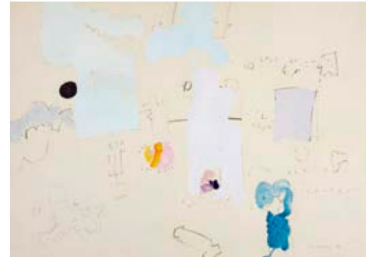
Sale al sol, 1968. Técnica mixta sobre papel. 50 x 70 cm

Procedencia: Estudio del artista || Colección hijos de Hernández Mompó