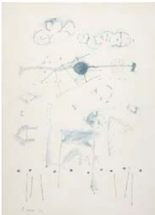
Sin título, 1978 Técnica mixta sobre papel 64 x 46 cm

Procedencia: Estudio del artista || Galería Theo, Madrid || Colección particular || Galería Cuatro Diecisiete, Madrid || Durán, Subastas de Arte, Madrid || Colección particular || Galería Juan Gris, Madrid Exposiciones: Mompó , Madrid, Galería Juan Gris, Galería Rayuela, 2004