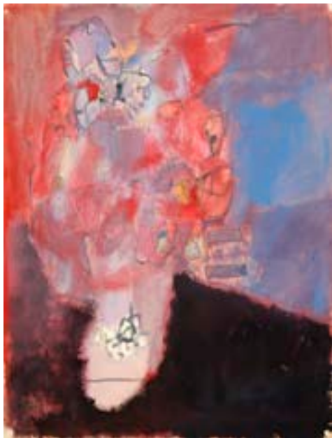
Sin título , 1961 Técnica mixta sobre papel 66 x 50 cm

Catálogo razonado de Mompó Tomo 1. Pág. 261 Ref. 1961/41 Procedencia: Estudio del artista || Colección hijos de Hernández Mompó