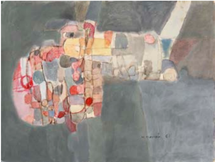
Sin título , 1961. Técnica mixta sobre cartulina. 50 x 66 cm

Catálogo razonado de Mompó. Tomo 1. Pág. 279. Ref. 1961/82