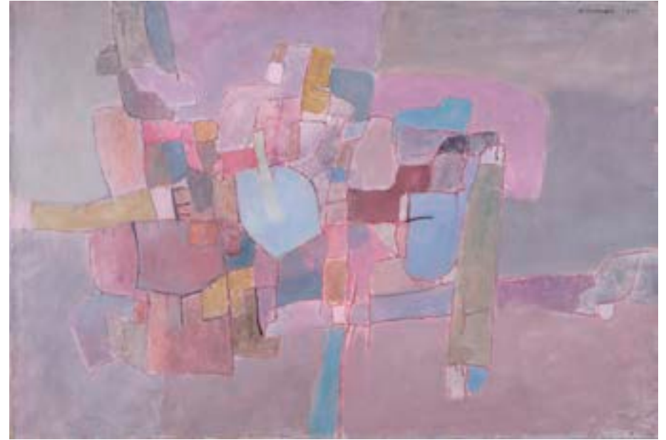
Sin título , 1960. Óleo sobre lienzo. 89 x 130 cm

Procedencia: Estudio del artista || Galería Theo, Madrid || Estudio del artista || Colección hijos de H. Mompó