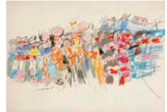
Sin título , 1961 Técnica mixta sobre papel 35 x 50 cm

Catálogo razonado de Mompó Tomo 1. Pág. 273. Ref. 1961/70 Procedencia: Estudio del artista || Colección hijos de Hernández Mompó