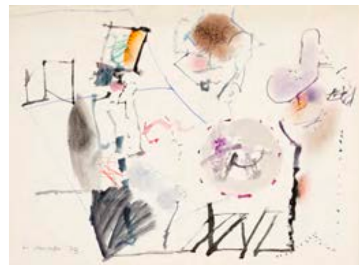
Sin título , 1973. Técnica mixta sobre cartulina. 28 x 38 cm

Obra certificada por familia H. Mompó Procedencia: Estudio del artista || Colección hijos de Hernández Mompó