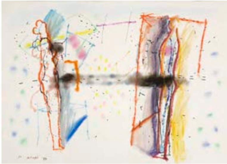
Sin título, 1977. Técnica mixta sobre papel. 46 x 64 cm

Catálogo razonado de Mompó. Tomo 2. Pág. 307. Ref. 1977/36