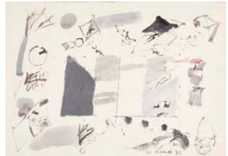
Sin título, 1971. Técnica mixta sobre papel. 24 x 34 cm

Catálogo razonado de Mompó. Tomo 2. Pág. 120. Ref. 1971/39 Procedencia: Estudio del artista || Colección hijos de Hernández Mompó