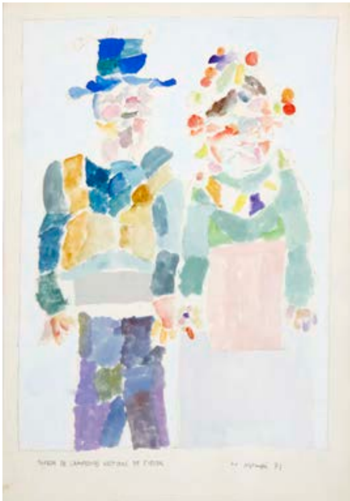
Pareja de campesinos vestidos de fiesta, 1971 Técnica mixta sobre papel. 50 x 35 cm

Catálogo razonado de Mompó. Tomo 2. Pág. 120. Ref. 1971/39 Procedencia: Estudio del artista || Colección hijos de Hernández Mompó