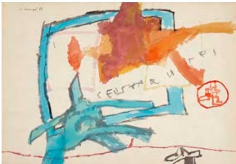
Personaje mirando una ventana y gente pasando, 1966 Técnica mixta sobre papel. 35 x 50 cm

Procedencia: Estudio del artista || Colección hijos de Hernández Mompó Exposiciones: Mompó íntimo (1958-1970) . Teruel, Museo de Teruel, 1993