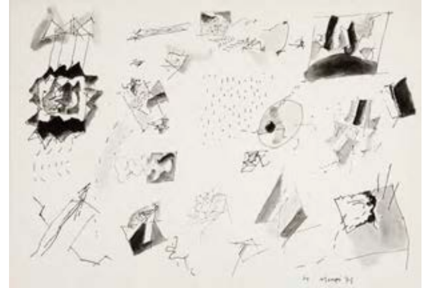
Sin título , 1971. Técnica mixta sobre cartulina. 35 x 50 cm

Catálogo razonado de Mompó. Tomo 2. Pág. 157. Ref. 1972/28 Procedencia: Estudio del artista || Colección hijos de Hernández Mompó Exposiciones: Mompó , Logroño, Sala Amós Salvador, Cultural Rioja, Ibercaja; Segovia, Torreón de Lozoya, Caja Segovia, 1997