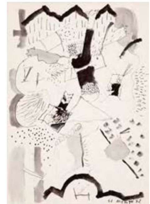
Sin título , 1972 Acrílico sobre lienzo 34 x 24 cm

Catálogo razonado de Mompó. Tomo ||. Pág. 135. Ref. 1971/73 Procedencia: Estudio del artista || Colección hijos de Hernández Mompó