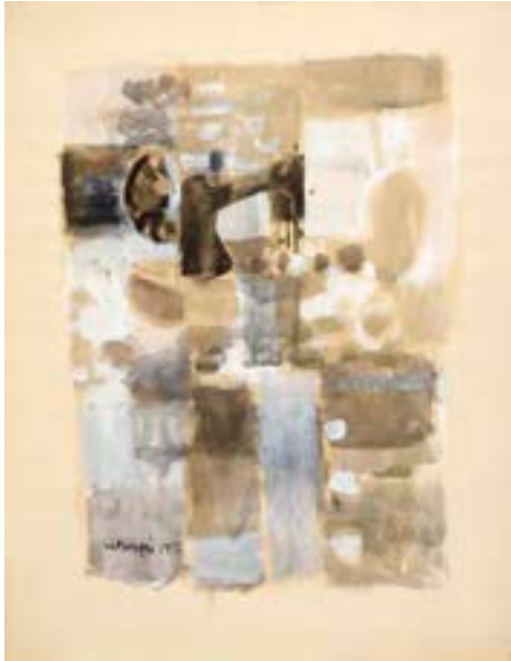
Máquina de coser , 1958 Técnica mixta sobre papel 60 x 50 cm

Catálogo razonado de Mompó. Tomo 1. Pág. 186. Ref. 1958/7 Procedencia: Estudio del artista || Colección hijos de Hernández Mompó Exposiciones: Mompó íntimo (1958-1970) . Teruel, Museo de Teruel, 1993