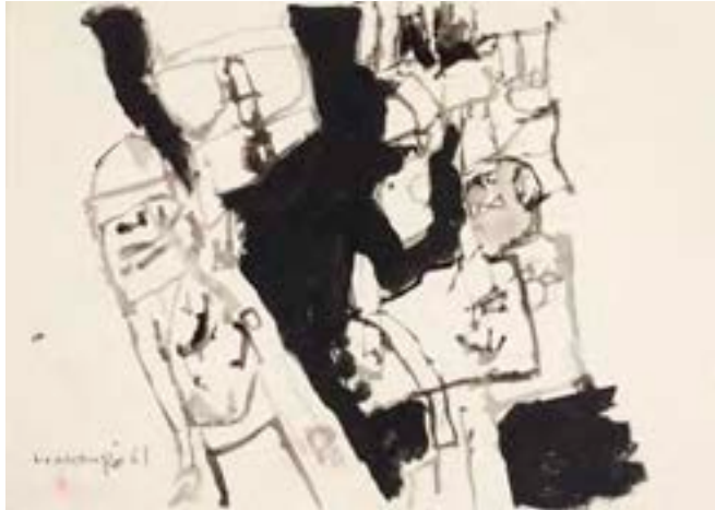
Sin título , 1961. Técnica mixta sobre papel. 25 x 34,5 cm

Catálogo razonado de Mompó. Tomo 1. Pág. 283. Ref. 1961/92 Procedencia: Estudio del artista || Colección hijos de Hernández Mompó