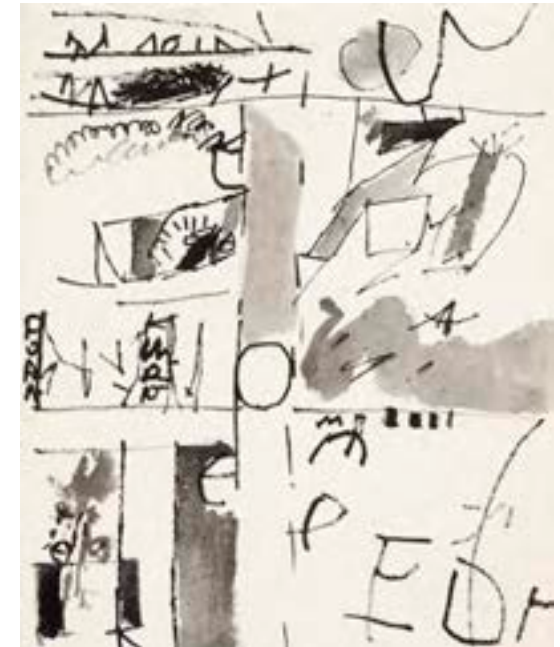
Sin título , 1964 Técnica mixta sobre papel 22 x 16,5 cm

Catálogo razonado de Mompó Tomo 1. Pág. 358. Ref. 1963/57 Procedencia: Estudio del artista || Colección hijos de Hernández Mompó