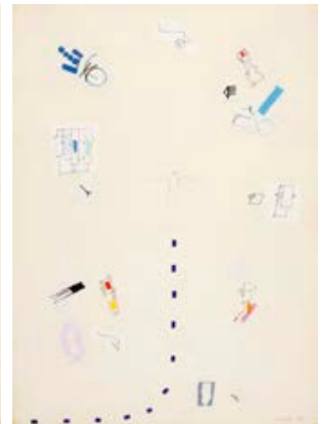
Cuatro collages , 1970. Técnica mixta y collage sobre cartulina. 70 x 50 cm c/u

Catálogo razonado de Mompó. Tomo 2. Pág. 84. Ref. 1970/34 Procedencia: Estudio del artista || Colección hijos de Hernández Mompó Exposiciones: Mompó íntimo (1958-1970) . Teruel, Museo de Teruel, 1993; Mompó , Logroño, Sala Amós Salvador, 1997; Segovia, Torreón de Lozoya, 1997 || Mompó , Murcia, Palacio Almudí, 1999; Mompó , Zaragoza, Museo Pablo Serrano, 2001