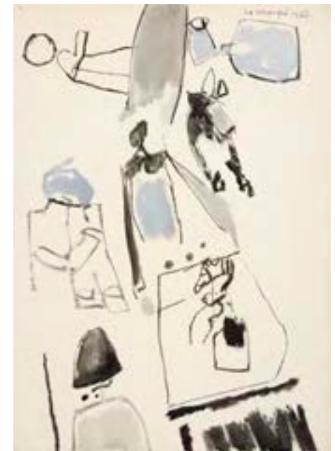
Sin título , 1962 Técnica mixta sobre papel 55 x 38,5 cm

Catálogo razonado de Mompó. Tomo 1. Pág. 288. Ref. 1961/102 Procedencia: Estudio del artista || Colección hijos de Hernández Mompó Exposiciones: Mompó íntimo (1958-1970) Teruel, Museo de Teruel, 1993