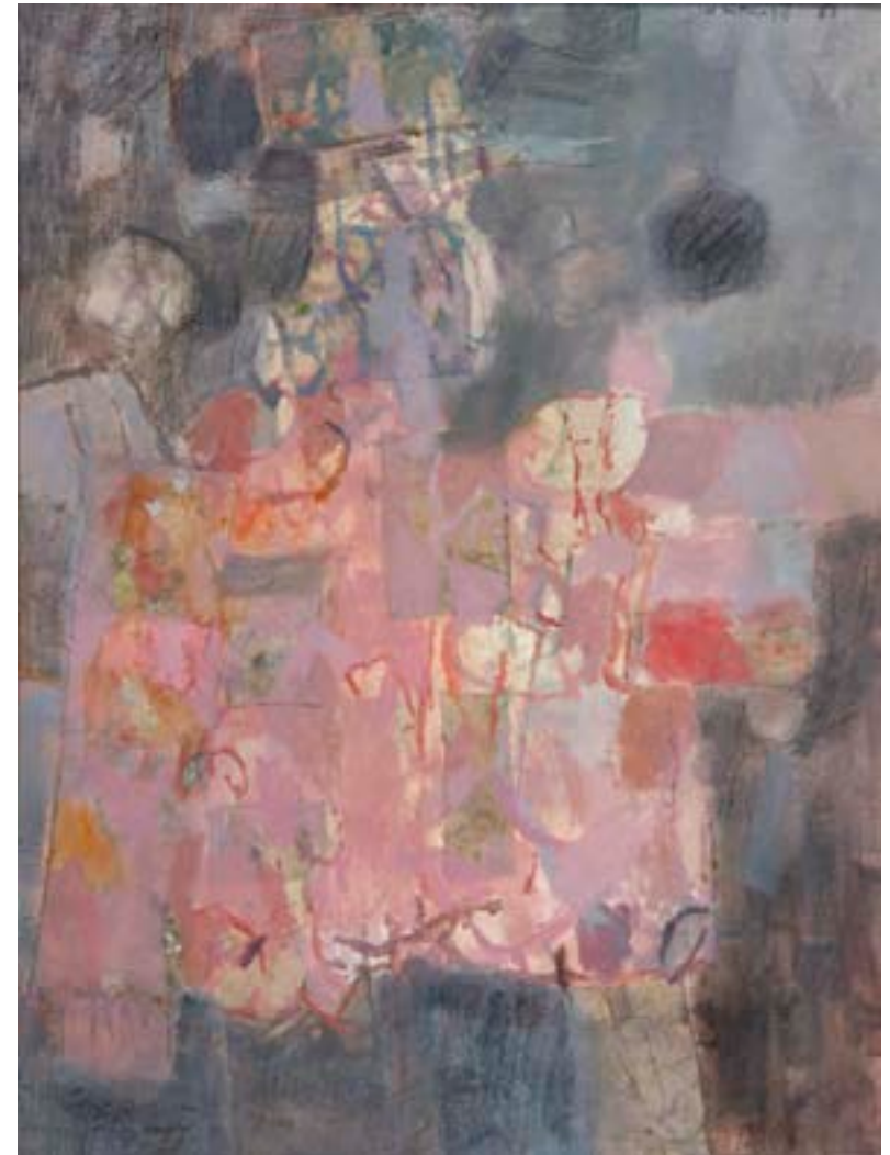
Vendedor , 1961. Óleo, carboncillo y collage sobre lienzo. 61 x 46 cm

Procedencia: Estudio del artista || Colección hijos de Hernández Mompó