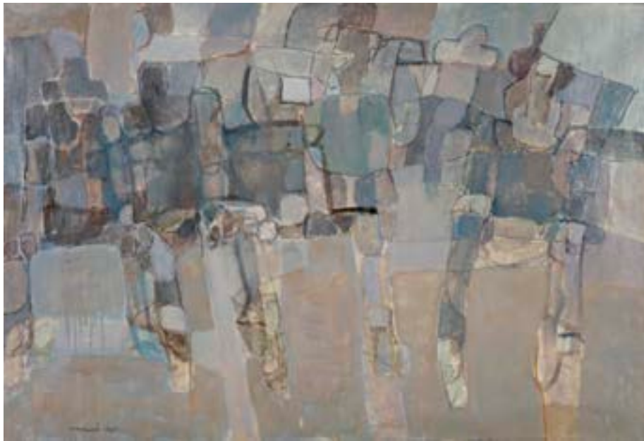
Tres músicos , 1960. Óleo y carboncillo sobre lienzo. 89 x 130 cm

Catálogo razonado de Mompó. Tomo 1. Pág. 215. Ref. 1960/5