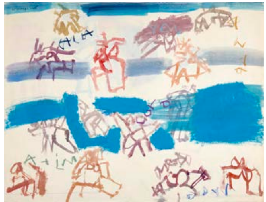
Playa , 1965. Técnica mixta sobre papel. 51 x 66 cm

Catálogo razonado de Mompó. Tomo 1. Pág. 459. Ref. 1965/98 Procedencia: Estudio del artista || Colección hijos de Hernández Mompó