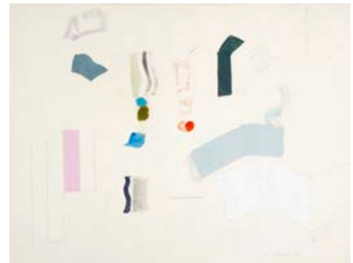
Sin título, 1969. Técnica mixta sobre papel. 32,5 x 40,5 cm

Procedencia: Estudio del artista || Colección hijos de Hernández Mompó