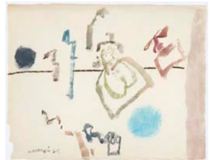
Sin título , 1965. Técnica mixta papel. 26,5 x 34 cm

Catálogo razonado de Mompó Tomo 1. Pág. 401. Ref. 1964/84 Procedencia: Estudio del artista || Colección hijos de Hernández Mompó