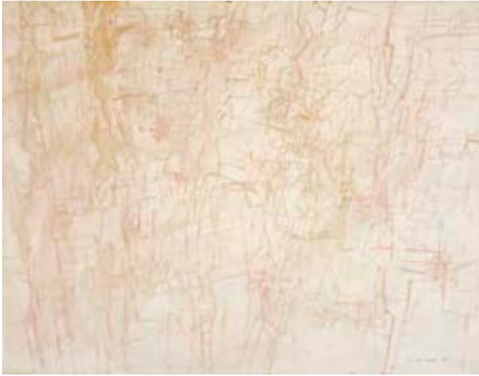
Sin título , 1960. Técnica mixta sobre cartulina. 50 x 65,5 cm

Catálogo razonado de Mompó. Tomo 1. Pág. 234. Ref. 1960/40