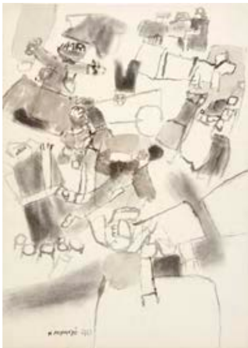
Sin título , 1961 Técnica mixta sobre papel 70 x 50 cm

Catálogo razonado de Mompó. Tomo 1. Pág. 328. Ref. 1962/81 Procedencia: Estudio del artista || Colección hijos de Hernández Mompó Exposiciones: Mompó íntimo (1958-1970) . Teruel, Museo de Teruel, 1993