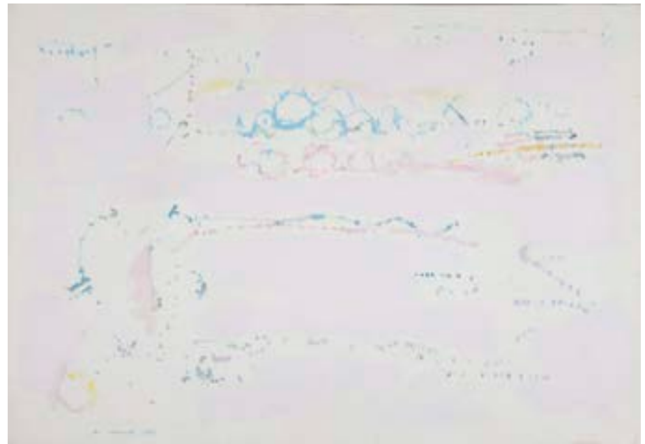
Paisaje con nubes, 1980. Acrílico sobre papel pegado a tabla. 51 x 73,5 cm

Procedencia: Estudio del artista || Colección hijos de Hernández Mompó