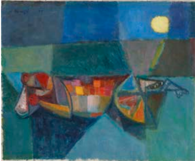
Payaso durmiendo cerca del mar , 1955. Óleo sobre lienzo. 40 x 48 cm

Catálogo razonado de Mompó. Tomo 1. Pág. 149. Ref. 1955/9 Procedencia: Estudio del artista || Colección hijos de H. Mompó Exposiciones: H. Mompó , Madrid, Sala Clan, 1957