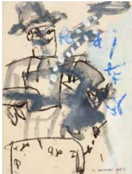
Sonríe , 1963 Técnica mixta sobre papel 25 x 17 cm

Procedencia: Estudio del artista || Colección particular, Madrid