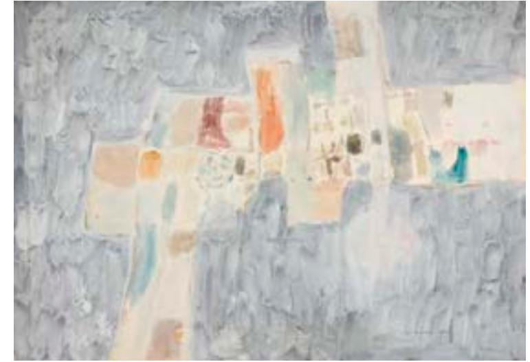
Sin título , 1960. Técnica mixta sobre papel. 50 x 68 cm

Exposiciones: Mompó íntimo (1958-1970) . Teruel, Museo de Teruel, 1993