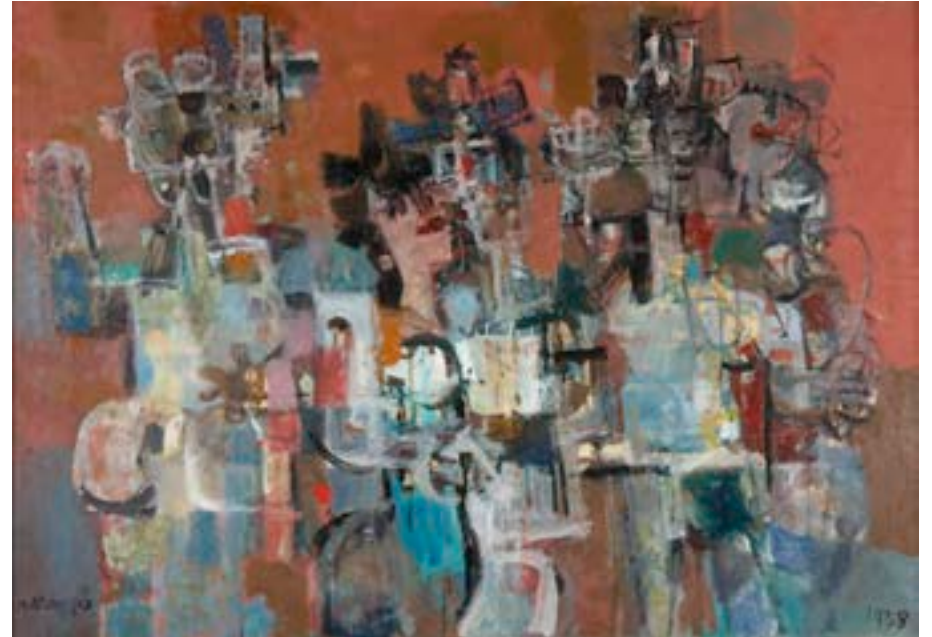
Parejas bailando , 1958. Óleo y carboncillo sobre lienzo. 70 x 100 cm

Catálogo razonado de Mompó. Tomo 1. Pág. 149. Ref. 1955/9 Procedencia: Estudio del artista || Colección hijos de H. Mompó Exposiciones: H. Mompó , Madrid, Sala Clan, 1957