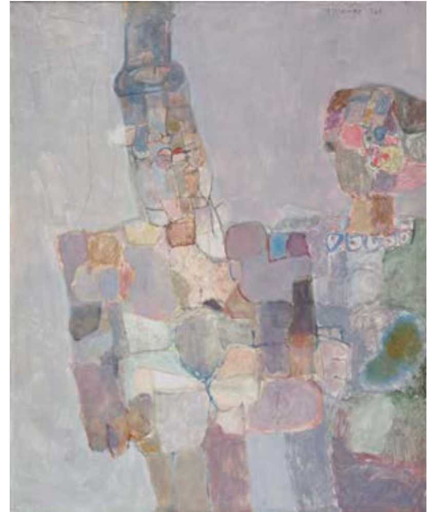
Matrimonio , 1960. Óleo sobre lienzo. 81 x 65 cm

Catálogo razonado de Mompó. Tomo 1. Pág. 190. Ref. 1958/16 Procedencia: Estudio del artista || Colección hijos de Hernández Mompó