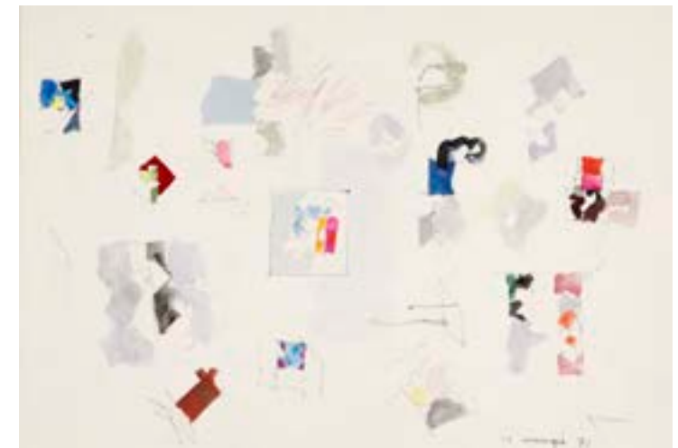
Ventanas, 1971. Técnica mixta sobre papel. 24 x 34 cm

Catálogo razonado de Mompó. Tomo 2 Pág. 139. Ref. 1971/79 Procedencia: Estudio del artista || Colección hijos de Hernández Mompó