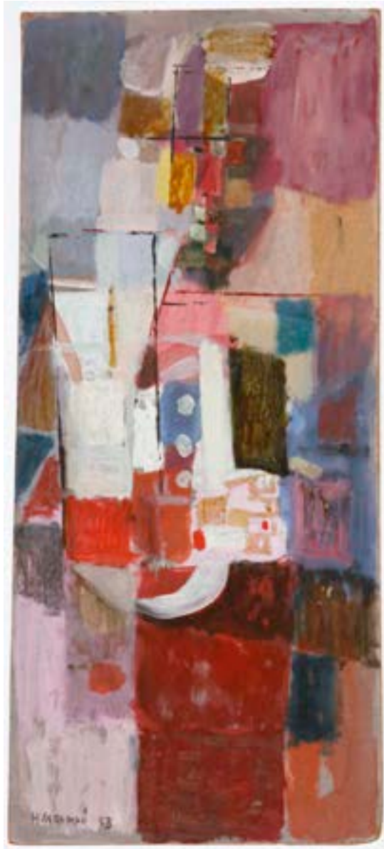
Personaje , 1958. Óleo sobre tabla. 57 x 25 cm

Catálogo razonado de Mompó. Tomo 1. Pág. 183. Ref. 1958/3 Procedencia: Estudio del artista || Colección hijos de H. Mompó